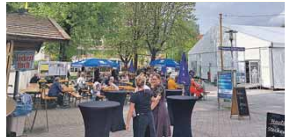
Ab 25. April läuft der Festzeltbetrieb mit Biergarten, Kinderkarussell, Schießstand, Glückshafen und Fischbraterei.

Das anschließende Böllerfest-schießen des Schützenkranzes Moosach gehört ebenfalls zur guten Tradition. Ab 12 Uhr sorgen »Die Schmalzer«, eine fünfköpfige Gruppe aus dem Bayerischen Wald, für musikalische Unterhaltung. Das Ende der Feierlichkeiten ist für 22 Uhr geplant. Änderungen des Programms sind vorbehalten.