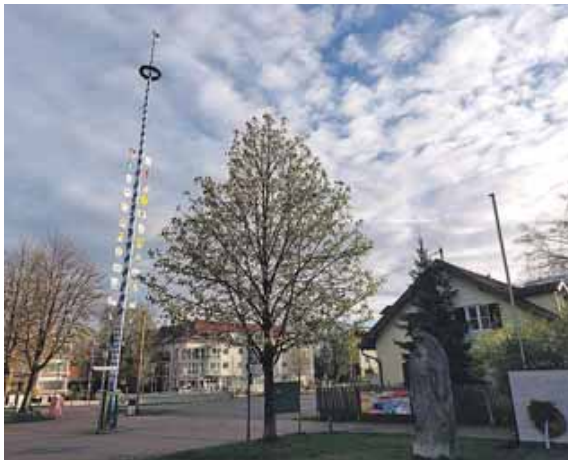
Auf dem Moosacher St.-Martins-Platz wird traditionell in den Mai gefeiert – und das sieben Tage lang.