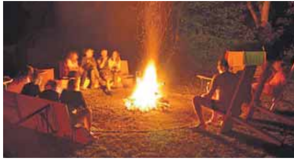
Hinein in die Natur und ab ans Lagerfeuer, heißt es wieder in den Pflingstferien.

16 Jahren und ist dank finanzieller Unterstützung des Bezirksausschusses Moosach kostenlos. Das Angebot beinhaltet Fahrtkosten, Unter-