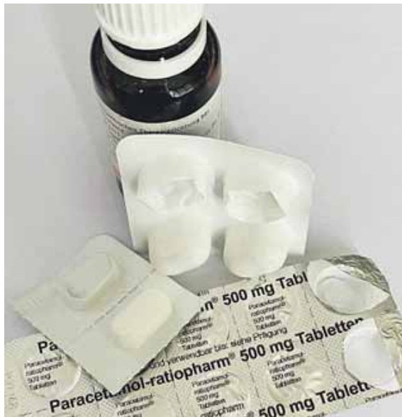
Altarzneimittel dürfen über die Restmülltonne entsorgt werden. Größere Menge sollten über die Schadstoffsammelstelle entsorgt werden.

»Was man wirklich braucht, hängt natürlich von den Lebensumständen ab«, rät Apotheker Aurnhammer.