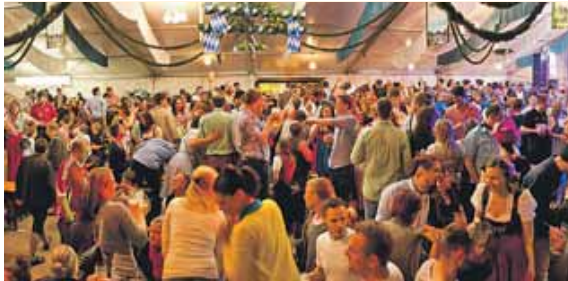
Im Festzelt ist für Partystimmung gesorgt. Verschiedene Bands werden dort spielen.

Hierzu laden der Moosacher Gesamtverein und der Bezirksausschuss 10 gemeinsam mit dem Festwirt Stiffl ein. Im Moosacher Ortskern, gleich neben dem Pelkovenschlössl und der alten Martinskirche, läuft der bekannte und beliebte Festzeltbetrieb mit Biergarten, Kinderkarussell, Schießstand, Glückshafen, Süßigkeitenstand und Fischbraterei. Tischreservierungen im Festzelt sind nicht möglich. Anstich für das Maifest ist am Donnerstag, 25. April, um 18 Uhr, dazu spielt der Musikverein »Harmonie Neubiberg«. Zuvor findet um 17 Uhr das Treffen der örtlichen Vereine beim Alten Wirt statt. Sieben Tage lang läuft in Herzen Moosachs ein bun-