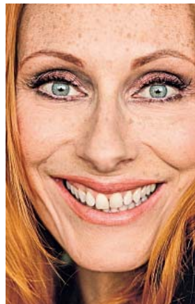
Andrea Sawatzki