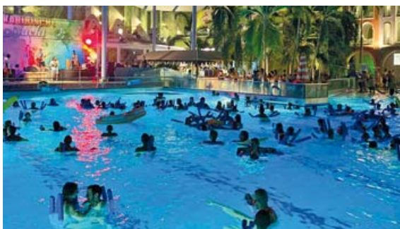
Am 12. Oktober lädt die THERME ERDING zur Karibischen Nacht ein.

Die karibische Band steht für pure Lebensfreude und heizt den Gästen mit ihrer feurigen Mischung aus Latin, Reggae und Pop so richtig ein. Urlaubsflair der besonderen Art versprüht die unvergessliche Feuer-Limbo-Show und die exotische Obst- und Cocktail-Verkostung. Sportlich-aktiv wird's beim Limbo-Tanzen mit dem Animationsteam und bei der großen Verlosung gewinnt man mit etwas Glück tolle Preise. Kostenfreie Erinnerungsfotos sind an der Fotostation erhältlich.