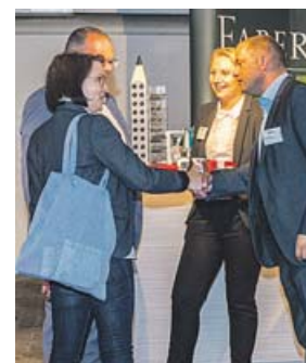
Direkter Austausch: Kunde