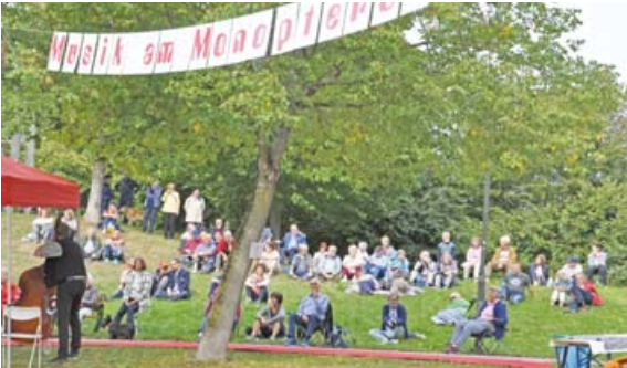
Ein Blick auf das Festivalgelände.