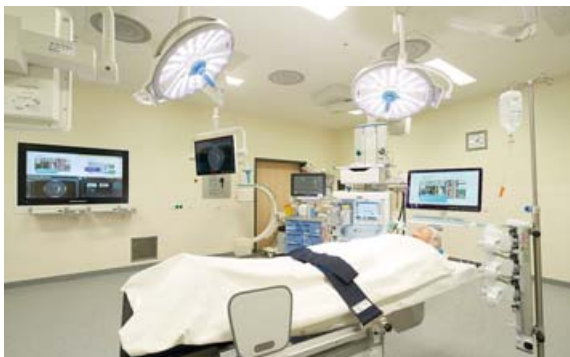
Einblick in den OP der Gefäßchirurgie: Der 62 Quadratmeter große Saal ist auf dem neuesten Stand der Technik. Ein Highlight ist das hochmoderne Bild- und Videomanagementsystem.

Beispiel auf der Toilette Herzprobleme bekommt, wird das sofort über ein digitales Alarmsystem gemeldet und die Hilfsmaßnahmen können direkt eingeleitet werden. Beeindruckend auch die Wahlleistungsstation im sechsten Stock, deren Sonderleistungen nur in der Privat- oder Zusatz-Versicherung mit inbegriffen sind. Zur Besichtigung stand ein 21-Quadratmeter-Einbettzimmer bereit mit Traumblick auf Dachau, großem Flatscreen-TV, Damast-Bettwäsche, hochwertiger Möblierung, Essen a la carte, Mini-Bar (auf Wunsch mit Alkohol, wenn es der Arzt erlaubt) und großem, voll ausgestattetem Badezimmer. »Der Standard gleicht einem Vierstern-Superior-Hotel«, versicherte Nasri. Die einladende Lounge mit großer Kaffeebar konnte ebenfalls besichtigt werden. Tatsächlich bekam man den Eindruck: Wenn schon krank, dann hier. Die Operationssäle sind mit hochmoderner Technik ausgestattet. Ein Highlight ist das Bild- und Videomanagementsystem. Es steuert, verwaltet und dokumentiert Daten, Bilder und Videos und sorgt für einen schnellen, sicheren Datenfluss. In den dezentralen, hydraulisch verstellbaren OP-Leuchten sind Kameras eingebaut.