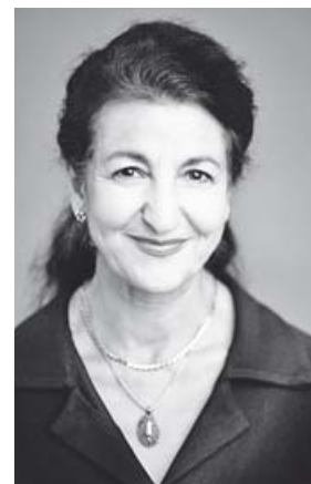
Necla Kelek

Necla Kelek ist eine deutsch-türkische Sozialwissenschaftlerin, Publizistin, Frauenrechtlerin und Islamkritikerin türkischer Abstammung mit diversen Auftritten in den öffentlichen Medien. Von ihr erschienen zahlreiche Buch- und Presseveröffentlichungen. Die Bestseller-Autorin warnt in ihrem neuen Debattenbuch davor, dass muslimische Frauen inmitten unserer modernen Gesellschaft Unrecht er-