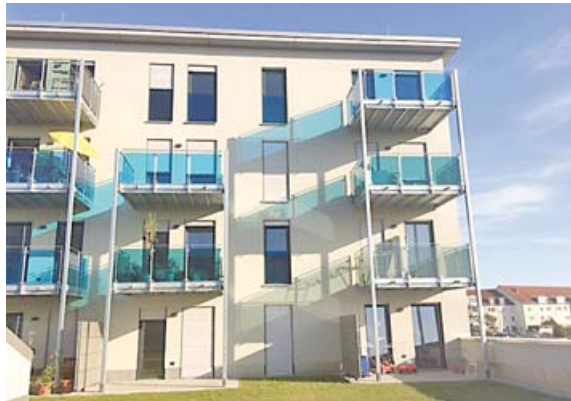
Alle 79 Wohnungen sind barrierefrei. 16 davon wurden speziell für Senioren gebaut.