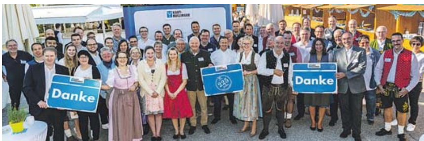
Das KAUT-BULLINGER-Team sagt »Danke« für 225 Jahre Kundentreue.

Unter dem Motto »Nachhaltigkeit« kamen rund 1.000 Teilnehmer