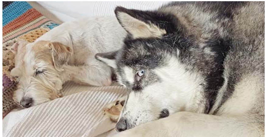
Während Frau Nelly hinten tief schläft, befindet sich Puma in der Ruhephase – beide sollte man nicht stören.

wenn Hunde durchaus spüren, wie müde sie sind, haben wir sie über Generationen so trainiert, dass sie stets zur Verfügung stehen. Solche Hunde sind stark auf ihre Besitzer fixiert und haben Angst, sie könnten etwas Wichtiges verpassen oder verlassen werden. Dementsprechend kommen die Ruhephasen zu kurz. Je weniger ein Hund zur Ruhe kommt, umso mehr fühlt er sich »verpflichtet«, sich um den Haushalt zu kümmern. Meist führt das zu Missverständnissen im Alltag, da der Hund sich in der Führung und Verantwortung sieht.