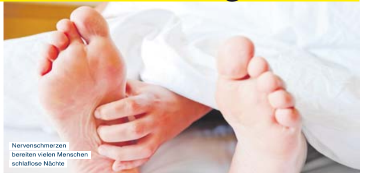
Nervenschmerzen bereiten vielen Menschen schlaflose Nächte

„Nach vier Jahren brennenden und unruhigen Füßen verbunden mit Taubheit der Zehen und Waden hat Restaxil das alles fast verschwinden lassen. Was für eine Erleichterung!“ (Sandra P.)