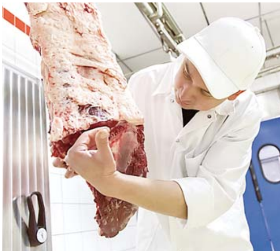
Der Metzger beurteilt den Reifezustand des Rindfleischs.

Kreativität und Organisations-talent sind nur einige der