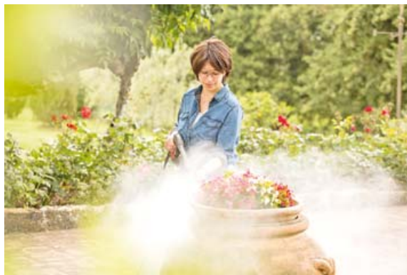
Einmal saubermachen bitte. Hochdruckreiniger sind hilfreich beim Herbstputz im Garten.

Sind alle Aufgaben vollbracht, gehen die Gartenhelfer selbst in den Winterschlaf. Allerdings sollten auch Rasenmäher, Heckenscheren und Motorsägen vorher gründlich gesäubert werden. Die Messer des Rasenmähers oder die Sägeketten am besten jetzt beim örtlichen Fachhändler nachschärfen lassen, dann sind die Geräte im nächsten Frühjahr gleich startklar. Und noch ein Tipp: Die Getriebe von Heckenschere, Motorsense und Freischneider danken eine Pflegeeinheit mit Spezialfett.