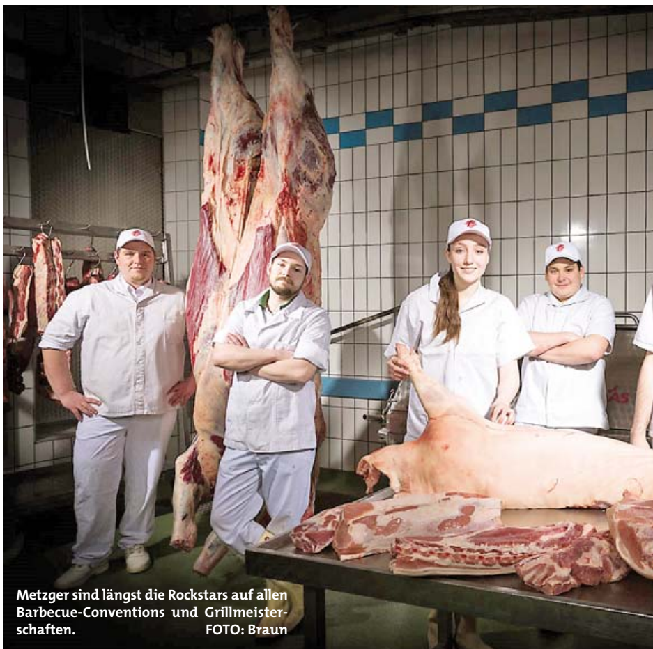
Metzger sind längst die Rockstars auf allen Barbecue-Conventions und Grillmeisterschaften.

Diverse Nachwuchs-Posts auf der Social-Mediaplattform Facebook wurden im Frühjahr veröffentlicht und das Feedback war überraschend positiv. Das Metzgerhandwerk wird wahrgenommen. In Bayern ist die Struktur des kleinen regionalen Betriebs Gott sei Dank noch vorhanden. Es liegt nun am Endverbraucher, dafür zu