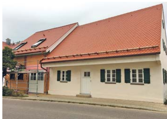
Bauernhaus in Altomünster.