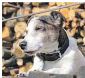
Zu einer Krimilesung rund um den Hund lädt die Stadtbibliothek Bogenhausen ein.