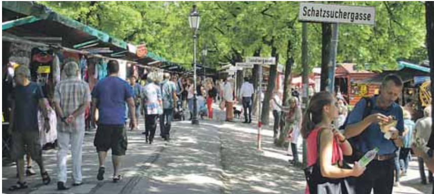
250 Geschäfte bieten ihre Produkte auf der Auer Maidult zum Verkauf an.

AU (red) - Die Auer Maidult auf dem Mariahilfplatz lädt von Samstag, 27. April, bis Sonntag, 5. Mai, zum Münchner Frühlingsvergnügen ein. 250 Geschäfte bieten ihre Produkte und Waren zum Verkauf an. Autoscooter, Kettenflieger, Schiffschaukel und das Russenrad sorgen im Schaustellerteil für Volksfestgaudi.