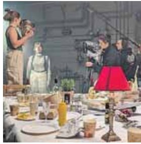
Ein Theaterprojekt inszeniert Stoff aus dem Alten Testament.

H AIDHAUSEN (red) · Das Alte Testament ist hochaktuell – auch für junge Menschen: Vom 27. April bis 4. Mai führt ein junges Ensemble aus der katholischen Jugendverbandsarbeit die Inszenierung »GERICHTET – nach dem Alten Testament« in der Jugendkirche München (Preysingstraße 85) auf. Schauspiel, Film und Musik sollen das Publikum in ihren Bann ziehen. Das Stück beruht auf dem »Buch der Richter« aus dem Alten Testament. Dieses behandelt die Zeit nach der Landnahme des Volk Israels und vor der Königsherrschaft. Das verheißene Land ist unter den Stämmen Israels ganz gerecht aufgeteilt. Um diese willkommene Kriegerruhe auch weiterhin zu genießen, gibt es nur zwei Bedingungen für das Volk: Haltet euch an die Gesetze eures Herrn und schwört nicht bei den Namen fremder Götter. Doch die