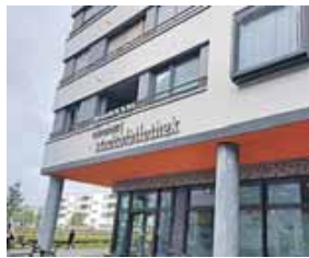
Die Stadtbibliothek Riem am Elisabeth-Castonier-Platz ist der Ausgangspunkt der Führung.

punkt: In den vergangenen zwei Jahrzehnten ist ein attraktives Stadtquartier entstanden, in dem über 20.000 Menschen aus mehr als 100 Ethnien leben. Vorgestellt wird im östlichen Teil unter anderem der aktuell entstehende Stadtplatz am U-Bahnhof Messestadt Ost mit neuen Angeboten für die Bevölkerung und unterschiedlichen Wohnformen. Architektin Susanne Flynn vom Verein Urbanes Wohnen erläutert die unterschiedlichen Wohnformen und welche Entfaltungsmöglichkeiten die jeweiligen Modelle bieten. Des Weiteren geht sie auf die Perspektiven ein, die sich aus den Erfahrungen mit diesem Quartier für die weitere Stadtentwicklung ergeben. Treffpunkt ist am Eingang der Stadtbibliothek Riem (Elisabeth-Castonier-Platz 19).