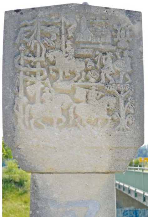
Wo in Peißenberg steht diese steinerne Tafel?

„Festgemauert in der Erden ...“ steht hier nicht Schillers Glocke, sondern vielmehr