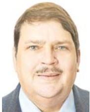
Bernd Posselt Präsident der Paneuropa-Union Deutschland und ehem. CSU-Europaabgeordneter