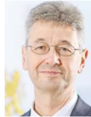
Michael Piazzolo bayerischer Kultusminister