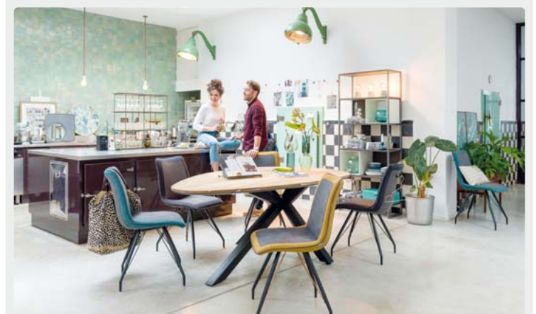
Offene Regale vermitteln die gewisse Leichtigkeit des Interieurs.

Stauraum mit Stil Abstellmöglichkeiten lassen sich geschickt ins Interieur integrieren (djd). Ungenutzte Flächen in der Wohnung können zu stilvollem Stauraum umfunktioniert werden. Das geht ganz einfach, wenn man zum Beispiel einige schmale Schränke oder Bücherregale nebeneinander in die ungenutzten Zimmerecken stellt, statt sie im Raum zu verteilen. Wer mehr Farbe in die Wohnung bekommen möchte, muss nicht unbedingt eine Wand streichen. Genauso schön und dazu auch noch Platz bringend sind Schränke in einer auffälligen Akzentfarbe wie Petrolblau. Wer ein Homeoffice nutzt, benötigt Stauraum für technische Gadgets, Papiere und andere Büro-Utensilien. Eine mögliche Lösung ist eine Dressette wie das Modell „Faneur“ von Xoon. Unter www.xoon.de gibt es dazu Bilder und weitere Stauraum-Ideen.