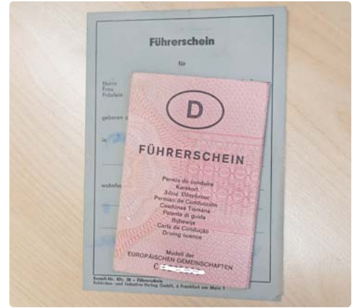
Ob grau oder rosa: Die Papierführerscheine haben ausgedient und verlieren Schritt für Schritt ihre Gültigkeit.

tausch sputen, denn hier läuft die Frist bereits zum 19.01.2022 aus. Coronabedingt kommt es derzeit jedoch zu Engpässen bei der Terminvergabe in den zuständigen Ämtern. Daher einigten sich die Verkehrsminister der Bundesländer darauf, dass Fahrer mit ungültigem Führerschein nach Ablauf der Umtauschfrist zunächst keinen Bußgeldbescheid erhalten sollen. Eine bundeseinheitliche Regelung für das konkrete Vorgehen bei Kontrollen soll noch festgelegt werden. red