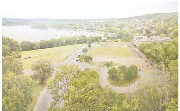
Das Gymnasium (rechts) soll sich harmonisch in die Landschaft fügen.

Für den Förderverein ist das Engagement mit dem Gemeinderatsbeschluss nicht