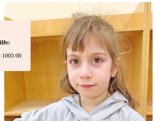
Bitte helfen Sie mit Ihrer Spende, damit alle Frühstücksklub-Kinder, die Nachhilfe brauchen, sie gleich nach Beginn des Schulunterrichts bekommen können!

So spenden Sie für Nachhilfe: Deutsche Lebensbrücke IBAN: DE11 7008 0003 0300 1003 00 Stichwort: Nachhilfe