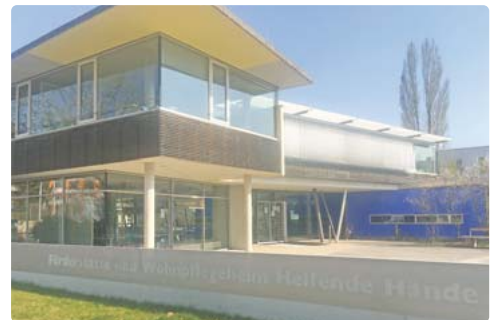
Wie viele andere Einrichtungen ist auch die Förderstätte der Helfenden Hände derzeit geschlossen.

Bereits Anfang April haben die Helfende Hände des- wegen einen Aufruf gestar- tet: „Wir wissen natürlich, dass selbstgenähte Stoff-