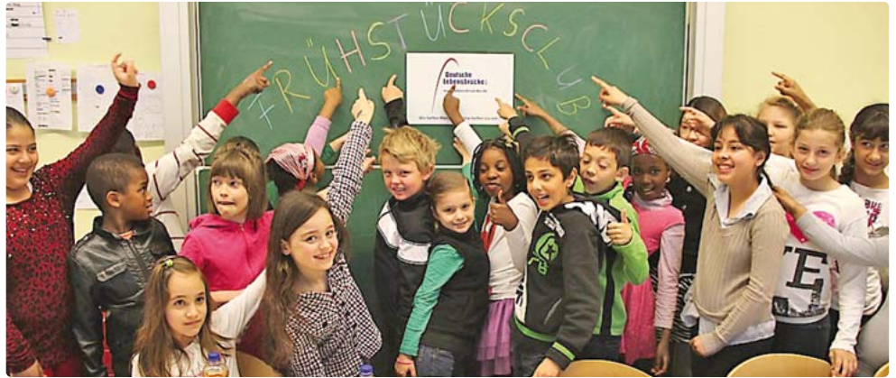
In den Münchner „Frühstücksklubs“ der Deutschen Lebensbrücke erhalten rund 80 Kinder morgens ein gesundes und leckeres Frühstück.

Nachhilfe-Spendenprojekt der Deutschen Lebensbrücke