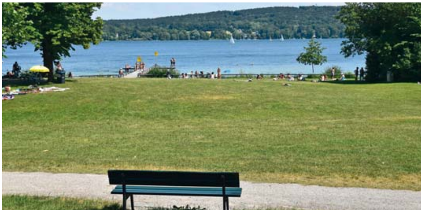
An städtischen Grünanlagen mit Seezugang (hier der Steinger Grund), Parks und Kinderspielflächen gelten neue Regeln.

Was alles in Zukunft verboten ist: Hundekot und Müll liegenlassen, Musik abspielen und anderer unzulässiger Lärm, die Belästigung anderer durch Angetrunkene, das