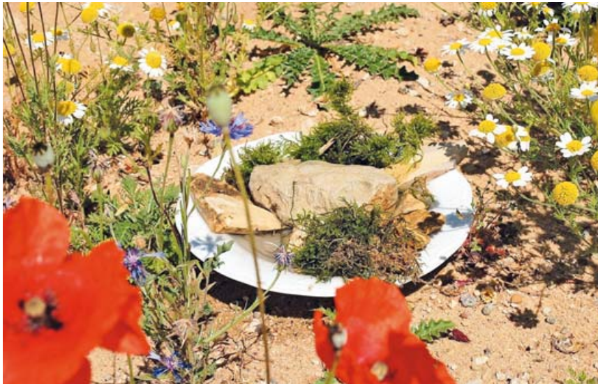
In flachen Schalen können Sandbäder oder Wasserstellen für Vögel hergerichtet werden.

Neben den Vögeln freuen sich auch Igel, Eichhörnchen oder Bienen über das kühle Nass. Ein Stein oder etwas Moos in der Wasserschale hilft Insekten, Wasser zum Kühlen oder Bauen ihrer Nester zu sammeln. Ein Stück Holz dient als Ausstiegshilfe für ungeübte Jungvögel oder verunglückte Insekten.