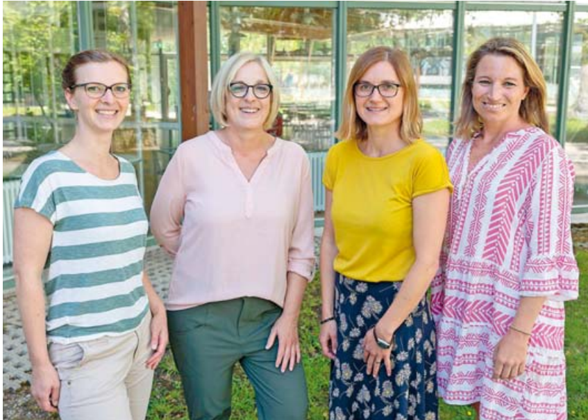
Sozialpädagogisches Team aus dem Gesundheitsamt Starnberg.

LANDKREIS STARNBERG · Die Staatlich anerkannte Beratungsstelle für Schwangerschaftsfragen am Gesundheitsamt im Landratsamt Starnberg ist seit vielen Jahren eine feste und bewährte Institution. Sie bietet ein vielseitiges Angebot rund um die Themen Schwangerschaft, Sexualpädagogik und Beratung bis zum Dritten Lebensjahr der Kinder. Schon Mitte 2021 wurde das Team der Schwangerschaftsberatung vergrößert und besteht nun aus vier Sozialpädagoginnen.