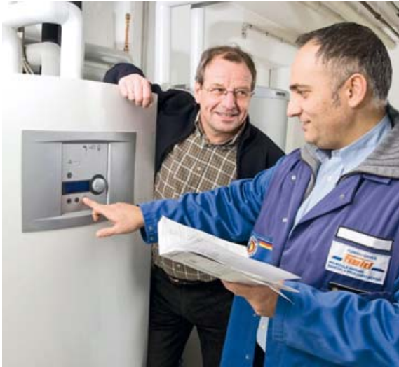
So funktioniert es: Der Fachmann erklärt die Wärmepumpe.

Speichern oder Ladesäulen sowie weiteren Erzeugern und Verbrauchern im Gebäude muss durch das Stromnetz nutzbar gemacht werden. Ein Steuerbare-Verbrauchseinrichtungen-Gesetz muss endlich kommen. Erst mit einem solchen Gesetz erhalten die Netzbetreiber die Rechts- und Planungssicherheit für die Flexibilitätssicherung.“