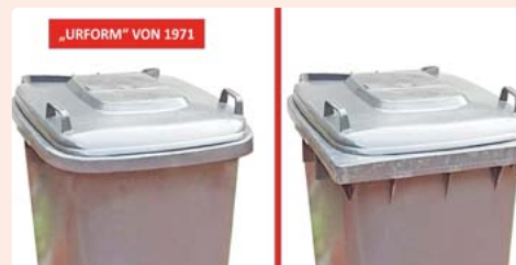
Die Mülltonne links stellt die gesuchte Urform ohne Kammleiste von 1971 dar. Bei der Mülltonne rechts handelt es sich um die Nachfolgeversion mit Kammleiste: Die entscheidende Kammleiste (drei vertikale „Zinken“) ist hier vorne unterhalb des Deckels deutlich zu sehen.