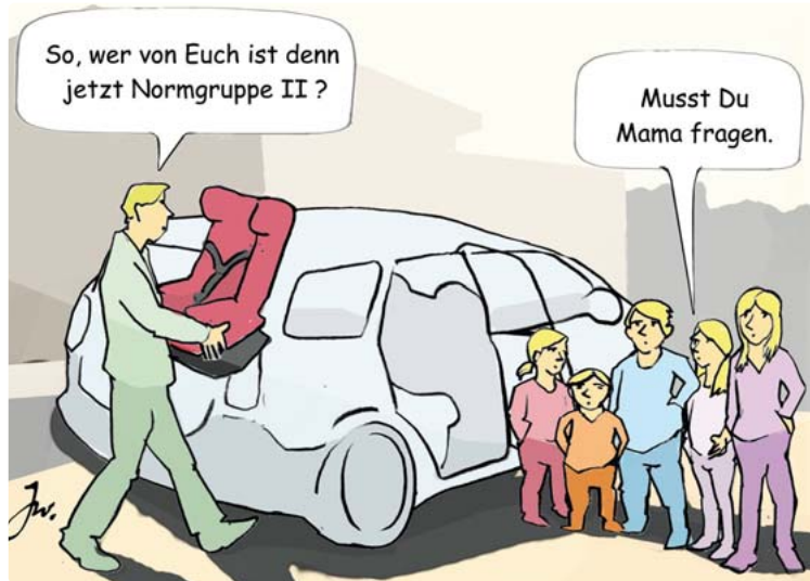
Qual der Wahl: Bei Kindersitzen müssen Eltern genau auf die richtige Passform achten.

Normen. Diese internationalen Standards bestimmen ebenfalls für Kindersitze technische Voraussetzungen, Sicherheitskriterien sowie die Prüfverfahren für die Zulassung. Eine „Kinderrückhalteeinrichtung“ sollte man auch nie zu groß kaufen, in der berechtigten Erwartung, dass das Kind ja noch wächst und man so Geld sparen kann, raten Experten. Denn nur wenn das Kind richtig in den Sitz passt, und dabei ist vor allem die Körpergröße ausschlaggebend, kann die Rückhalteeinrichtung ihrer Sicherungsaufgabe gerecht werden. Kinder mögen in Klamotten hineinwachsen, so die Fachleute, bei Kindersitzen verbieten sich solch „vorausschauende“ Entscheidungen.