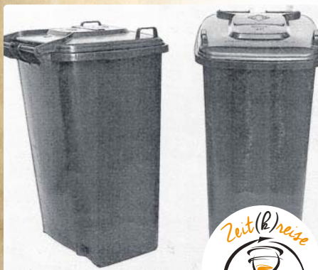
Die Ur-Tonne ohne Kammleiste: 2017 veröffentlichten wir dieses Bild in einem Beitrag von Dr. Walter G. Demmel.