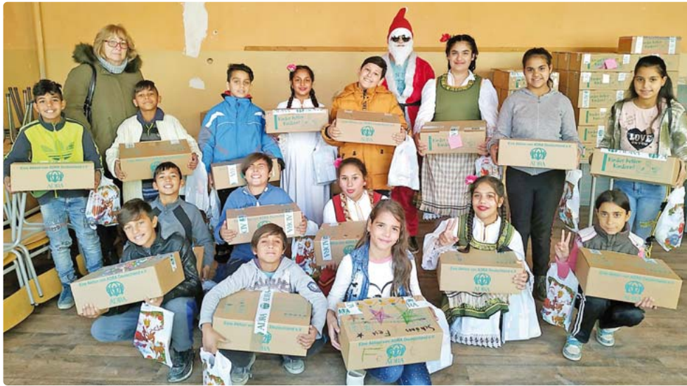
Aktion 2019: Auch in Bulgarien gab es strahlende Kinderaugen.

ADRA Deutschland ruft wieder zur Sammlung auf