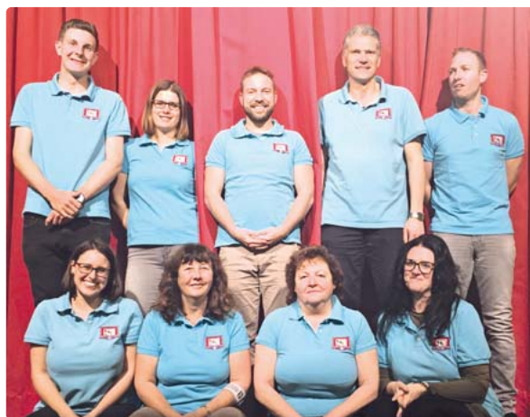
Das Ensemble der Neuaubinger Volksbühne freut sich auf schöne Theaterabende.

immer wieder Zwischenfälle. Was steckt dahinter? Spielbeginn ist an den Samstagen um 19.30 Uhr und am Sonntag um 18 Uhr. Eintrittskarten können erworben werden zu 10 Euro (zzgl. VVK-Gebühr 1 Euro) bei Bertrams Service Shop (Ubostr. 48) oder online unter www.neuaubinger-volksbuehne.de/bestellung . Beim Besuch des Stücks sind die Regeln zum Coronaschutz zu beachten. Die Plätze werden zugewiesen. bb