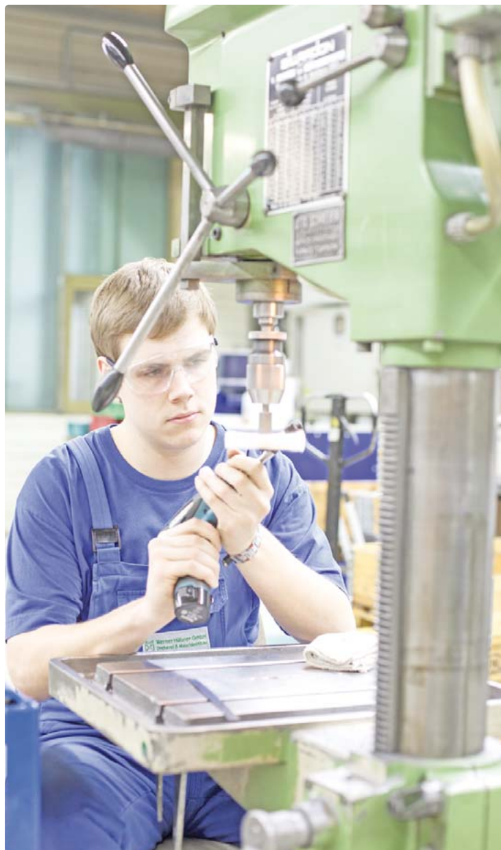
Vielseitiger Wirtschaftsbereich: Das Handwerk bietet über 130 Ausbildungsberufe.

Die Verdienstmöglichkeiten im Handwerk hängen im Überigen – wie in jedem anderen Wirtschaftsbereich auch – von der Qualifikation, der Einsatzbereitschaft und natürlich auch von der Wirtschaftslage ab. „Aber grundsätzlich gilt: Als gut ausgebildete Fachkraft hat man in jedem Handwerksberuf sein Einkommen und die Wahrscheinlichkeit, arbeitslos zu werden, geht derzeit gegen Null“, sagt der HWK-Geschäftsführer, der Jugendlichen, die vor dem Schulabschluss stehen, folgenden Tipp gibt: „Zunächst gilt es, sich selbst richtig einzuschätzen: Wo liegen meine Interessen, bin ich ein Theoretiker oder liegt mir eher die praktische Arbeit? Welche beruflichen Ziele habe ich? Kann ich diese auch mit einer Berufsausbildung und entspre-