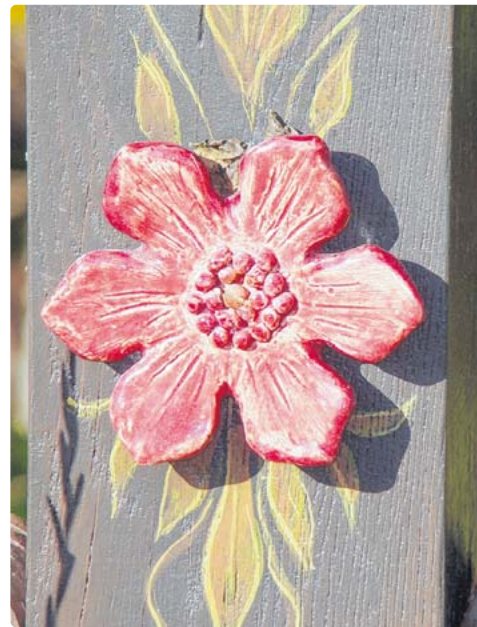
Liebevoll wurde diese kleine Rosette auf unserem gesuchten Feldkreuz vor ein paar Jahren vom Kapellenbauverein restauriert.

Wir freuen uns, wenn Sie uns Ihre „Fundmeldung“ zu kommen lassen und lösen das Rätsel in der nächsten Folge auf. Zu gewinnen gibt