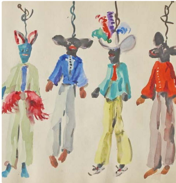
Das Bild „Puppen I“ stammt aus dem Skizzenbuch von Conny Meissen. Aquarell Conny Meissen