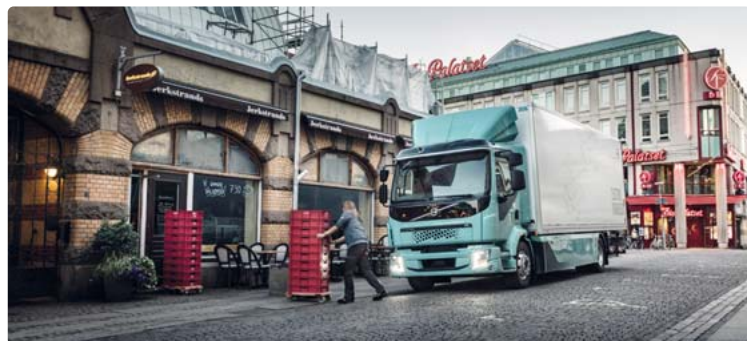
Während die Stadt gerade erst aufwacht, liefert ein E-Lkw Lebensmittel aus - ohne Nebenwirkungen für die Anwohner, denn der kraftvolle Elektromotor verursacht keine Abgase und ist besonders leise.

liefern Baustellen und sorgen dafür, dass Pakete schnell in regionalen Lieferzentren ankommen. Auch Online-shopping wird ein Stück umweltfreundlicher, wenn die Lkw der Logistikunternehmen mit Strom fahren. Das alles ist aber nur ein erster Schritt hin zu einem nachhaltigeren Transport auf der Straße, der ganz ohne Verbrennungsmotoren und Abgase auskommt. In den nächsten Jahren wird sich hier einiges tun, wenn emissionsfreie Fahrzeuge auch im Fernverkehr eingesetzt werden. Die Transportunternehmen stellen ihre Fahrzeugflotten Schritt für Schritt um. Den Wechsel unterstützt Volvo Trucks mit cleveren Lösun-