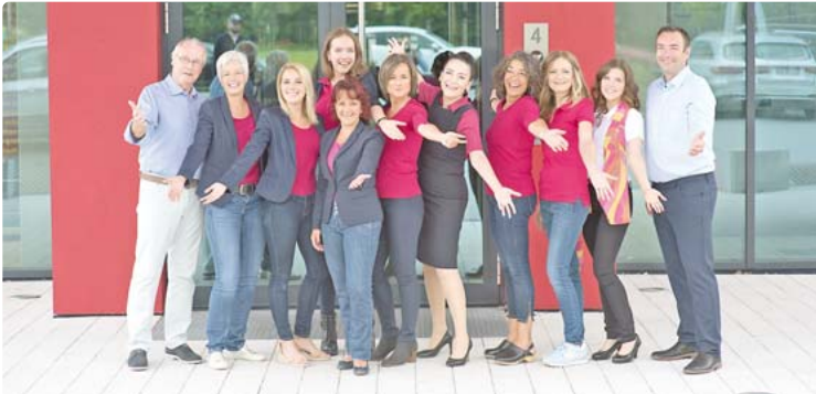
Das Team von slimpuls freut sich auf viele Interessierte am Infotag.

Gilching - Die „Corona-Kilos“ sind fast schon ein geflügelter Begriff und mittlerweile in aller Munde. Wenig Bewegung, kein geregelter Alltag, Essen aus Langeweile oder Stress – all dies begünstigt derzeit eine Gewichtszunahme. Dabei ist ein gesundes Körpergewicht insbesondere jetzt von enormer Bedeutung, denn ein gesunder Körper ist weniger anfällig für Infektionskrankheiten.