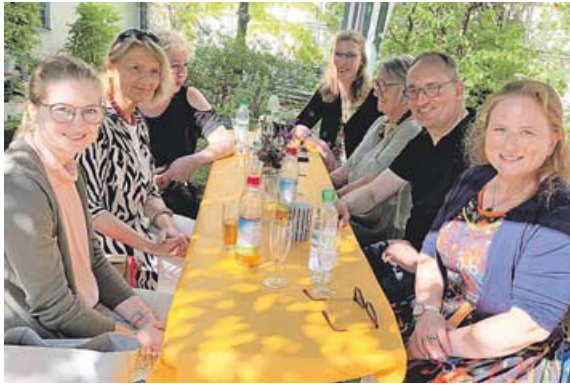
Die Dachauer Frauen Union traf sich im Garten des Bürgerbüros.