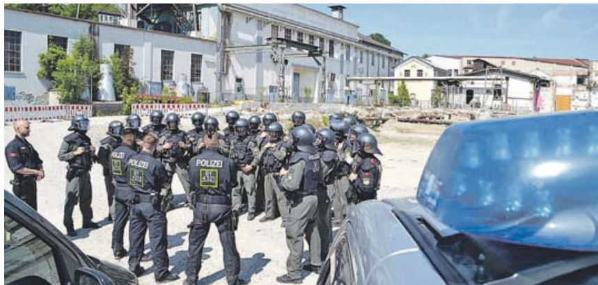
Eine Einheit der Dachauer Bereitschaftspolizei trainiert für lebensbedrohliche Einsatzlagen auf dem ehemaligen MD-Gelände.

DACHAU · Am Donnerstag, den 19. Mai, stehen um 9 Uhr über zwölf Polizeieinsatzwagen auf dem Gelände des zukünftigen Mühlbachviertels in der Ostenstraße. Aus den denkmalgeschützten Gebäuden hört man Schreie und laute Kommandos. Trotzdem steht Polizeihauptkommissar Stefan F. ganz entspannt vor dem verschlossenen Tor der Kalenderhalle: »Wir üben heute mit unserem Unterstützungskommando für diverse Einsatzlagen und nutzen die Gebäude und das Gelände für die Aus- und Weiterbildung unseres