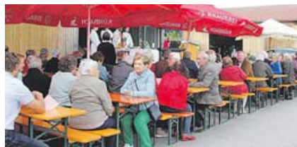
Viele Jetzendorfer kamen zum Gottesdienst auf das Ausstellungsgelände.