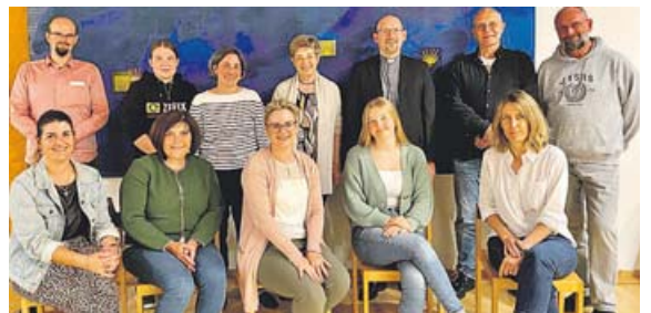
Der neue Pfarrgemeinderat von St. Johannes in Dachau.