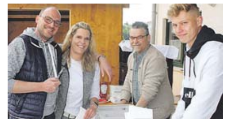
Die Küchencrew bot den Gästen ein herzhaftes Mittagessen und verschiedene Kuchen.

Fotogalerie unter www.kurier-dachau.de/nachrichten/muenchen/Freude+ueber+gelungene+Neuaufgabe,32785.html