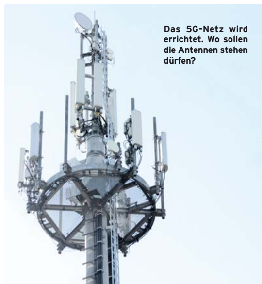
Das 5G-Netz wird errichtet. Wo sollen die Antennen stehen dürfen?

Münchner Süden · Wie fast alle neuen Technologien weckt auch das im Aufbau befindliche 5G-Netz Ängste vor gesundheitlichen Gefahren. Manche bisher bekannten Hersteller einzelner Module für die 5G-Technik wie Huawei lassen in punkto Sicherheit der Vertraulichkeit Fragen offen. Da öffentliche Veranstaltungen für Informationen derzeit nicht möglich sind, sucht die SPD im Bezirksausschuss (BA) 19 nach Alternativen. „Es sollen nicht klammheimliche Sendemasten gebaut werden“, sagte Dorle Baumann, „sondern wir sollten die Unklarheiten offensiv angehen!“