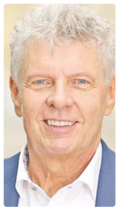
Dieter Reiter, Oberbürgermeister in München: „Die vergangenen Tage haben leider gezeigt, dass nicht alle Menschen in der Stadt die Gefahren erkennen, die von der Corona-Pandemie ausgehen.“

Die städtische Allgemeinverfügung mit dem exakten Wortlaut der Regelungen und Geltungsbereichen wird voraussichtlich im Lauf des Mittwochs auf www.muenchen.de/corona veröffentlicht. Die Maßnahmen werden voraussichtlich am Donnerstag in Kraft treten und zunächst für sieben Tage gelten. Da es am vergangenen Wochenende zu mehreren großen Menschenansammlungen in der Innenstadt gekommen ist, bei denen zahlreiche Anwesende weder eine Maske trugen noch Ab-