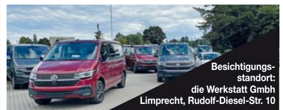
Besichtigungsstandort: die Werkstatt GmbH Limprecht, Rudolf-Diesel-Str. 10

Carl-Benz-Str. 8 82205 Gilching bei München Tel.: +49(0) 81 05/77 14 77-2