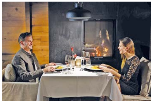
Zweisamkeit genießen: Im Hotel Lindenwirt wird den individuellen Bedürfnissen der Gäste viel Aufmerksamkeit geschenkt.

Hotel Lindenwirt Unterried 9 D-94256 Drachselsried Bayerischer Wald Tel. +49 9945 88930008 info@hotel-lindenwirt.de