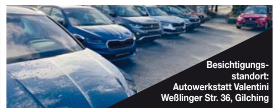
Besichtigungsstandort: Autowerkstatt Valentini Weßlinger Str. 36, Gilching