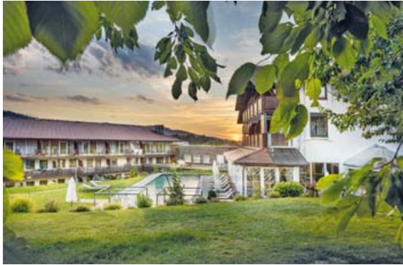
Im stilvoll nachhaltigen Wellnesshotel Lindenwirt erwartet die Gäste ein entspannter Wohlfühlurlaub vom Feinsten.

Erholungssuchende tauchen ein in die neue, vielseitige SPA- und Wellness-Oase mit Sauna-Landschaft und verschiedensten Aufgüssen bis hin zur finnischen Blockhaus-Sauna oder einem Dampfbad. Saunagängern stehen nach dem heißen Vergnügen stets Erfrischungen wie Tees und frisches Quellwasser, aber auch Säfte und Smoothies bereit. Familien mit Kindern erwartet ein breites Familien-Wellness-Angebot samt nachmittäglicher Familiensauna. Das Erlebnisbad mit Tauchbecken führt direkt ins Freie zu einem ganzjährig beheizten, dezent eingefassten 20 Meter Infinity Outdoor-Pool. Gleich daneben lädt ein kleiner Naturbadesee mit klarem Quellwasser zum Baden in der Natur ein.