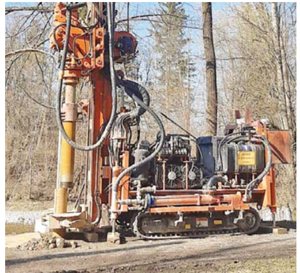
Wegen Bohrungen entlang der Ammerdeiche kommt es in den kommenden Wochen zu Absperrungen.

PEISSENBERG · An den Deichen entlang der Ammer im Bereich Peißenberg werden in den nächsten Wochen Bohrungen durchgeführt. Dies kann zu abschnittswise Sperrungen und Behinderungen an den Deichwegen führen. Die Bohrungen dienen der Erkundung der anstehenden Böden und der vertieften Überprüfung der Deiche. Die Deiche an der Ammer sind wichtige Hochwasserschutzbauwerke, die in Zeiten des fortschreitenden Klimawandels regelmäßig auf ihren Zustand sowie ihre Funktion hin überprüft werden müssen. Das Wasserwirtschaftsamt Weilheim bittet, zur eigenen Sicherheit die Absperrungen zu beachten. eis