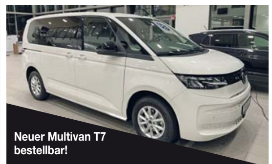
Neuer Multivan T7 bestellbar!