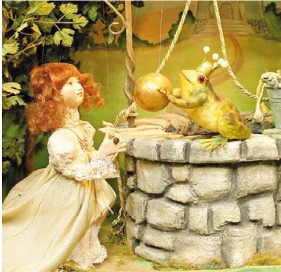
Viele Schaufenster der Weilheimer Innenstadt zeigen noch bis Montag, 2. Mai, liebevoll gestaltete Märchenszenen.

WEILHEIM · Zehn märchenhafte Schaufenster laden noch bis zum 2. Mai in die Weilheimer Innenstadt zum Spazieren und Entdecken ein. In den Schaufenstern stehen Schaukästen des Ateliers Fleschutz mit liebevoll gestalteten und mechanisch betriebenen Szenen aus den Märchen der Brüder Grimm. So werden auf dem Märchenweg die bekannten Geschichten wie der Froschkönig, Schneewittchen oder das tapfere Schneiderlein wieder lebendig. Zudem gibt es auf den Flyern ein kleines Rätsel zu jedem Schaufenster. Wer alles richtig beantwortet hat, darf seinen Zettel gegen eine kleine, süße Überraschung in der Stadtbücherei, im Stadtmuseum oder bei der Tourist-Information eintau-