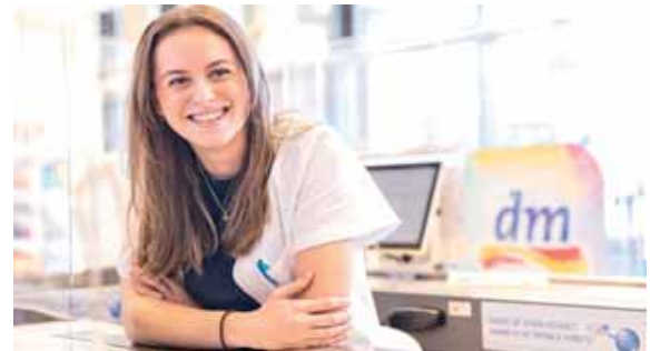
Erfolgsrezept: Bei dm-drogerie markt treffen die Teams vor Ort die Entscheidungen.