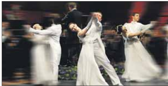
K&K Philharmoniker und Ballett gemeinsam auf der Bühne.

Die „Wiener Johann Strauß Konzert-Gala“ ist ein einzigartiges Erlebnis: