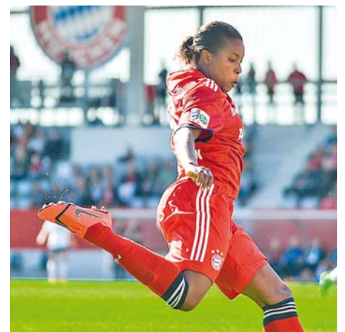
Die FC Bayern Frauen empfangen am Palmsonntag, 14. April, die SGS Essen zum Spitzenspiel.

Auch an Ostern sind die FC Bayern Frauen im Einsatz: Alle Fans sollten sich schon mal das UEFA Women's Champions League Halbfinale gegen den FC Barcelona vormerken. Das Hinspiel findet am Ostersonntag, 21. April, ab 18 Uhr am FC Bayern Campus statt. Das Rückspiel steigt eine Woche darauf am Sonntag, 28. April, um 12:00 Uhr im Mini Estadi in Barcelona. Die Frauen-Teams des FC Barcelona und des FC Bayern kämpfen dann beide um ihre erste CL-Finaleinlage. Während die Katalanen in der Saison 2016/2017 bereits einmal im Halbfinale standen, ist es für die Münchnerinnen das erste Halbfinale der Club-Geschichte. bb