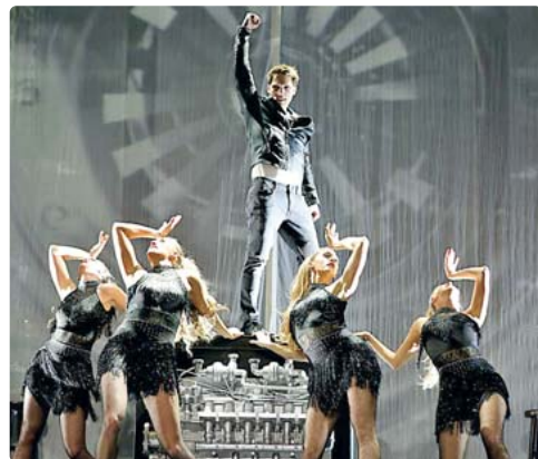
Tolle Songs und tolle Effekte präsentiert die Andrew Lloyd Webber Musical Gala.

Die Veranstaltungen begin-nen jeweils um 19.30 Uhr. Tickets gibt es beim SW Kar-teservice unter Telefon (089) 8949015, bei München Ticket unter Telefon (089) 54818181, online unter www.muenchenticket.de oder beim Ticket-Service der Münchner Wochenanzeiger in der Fürstenrieder Straße 9, Tel. (089) 546555. red