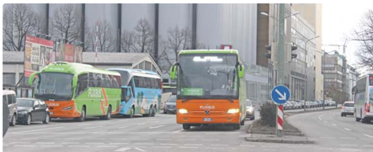
Nähe zum Zentralen Omnibusbahnhof: Zahlreiche Busse verkehren in Neuhausen-Nymphenburg und parken auch dort.

brachten Verwarnungen leider oftmals keinen ‚bleibenden Eindruck‘, so dass wir dieses strukturelle Problem mit Kontrollen alleine nicht vollständig in den Griff bekommen werden“, so das KVR. Zum Thema „Zentraler Omnibusbahnhof“ (ZOB) und der im Umgriff entstandenen Busproblematik habe man bereits mehrere Gespräche mit dem BA 9, Vertretern der Polizeiinspektion Neuhausen (PI 42) sowie der Abteilung Verkehrsordnung des KVR geführt. Eine für alle Seiten zufriedenstellende Lösung sei bisher jedoch nicht gefunden worden. „Wir werden auch weiterhin sehr personalintensiv im Bereich Marsfeld tätig sein, das Problem aber, wie dargestellt, durch Kontrollen alleine nicht vollständig lösen können.“