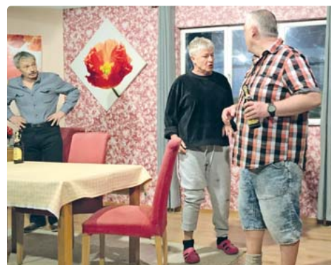
Weitere Aufführungen mit verfügbaren Plätzen am Freitag, 26. April (Karten: Tel. 0176/98103169 Mo. und Di. 18–21 Uhr oder www.sendlinger-komödienbrett.de ).