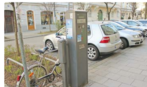
Parklizenzautomaten, wie etwa hier in der Blutenburgstraße, wird es demnächst auch im Parklizenzgebiet rund um den Rotkreuzplatz geben.

sehe konstante Abstände von maximal 50 Metern zwischen den Automaten vor – „bei etwas mehr Flexibilität mit dieser Abstandsregelung kann oft ein Standort gefunden werden, der nicht behindert“, meint der Fraktionssprecher der Grünen im BA 9.