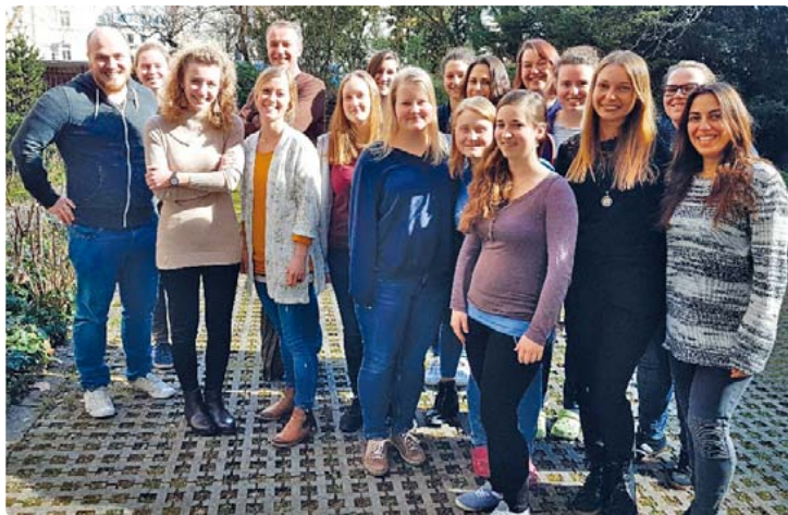
Die am Praxisprojekt beteiligten Auszubildenden haben die Herausforderung bestens gemeistert.

Am Krankenhaus Neuwittelsbach arbeiten angehende Pflegefachkräfte im „Echtbetrieb“