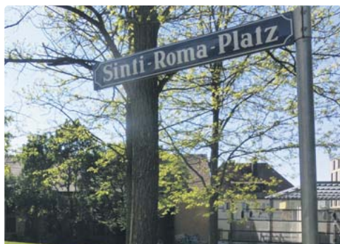
Seit 2007 hat der Bezirksausschuss Schwanthalerhöhe wiederholt ein Denkmal am Sinti-und-Roma-Platz beantragt.