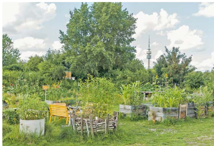
Ende 2017 wurde die Zwischennutzung des Grundstücks durch das Gemeinschaftsgartenprojekt beendet. Ein Ersatzgrundstück im Stadtviertel, so wie vom Verein gewünscht, scheint nicht in Aussicht.

Unter gewissen Umständen geeignet erscheint dem Referat für Stadtplanung und