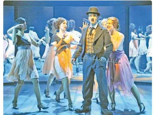
„Chaplin - das Musical“ zeigt den Mann hinter der Legende.

Am 25. Januar 2020 heißt es „Don't Stop the Music – The Evolution of Dance“. Talen-tierte Tänzer, atemberaubende Choreographien und die größten Hits aller Zeiten ver-einen sich zu einer einzigar-tigen Show, welche durch die Entwicklung des Tanzes leiten wird und magische Momente wiederaufleben lässt. Zu hören sind Ohr-würmer von Elvis Presley und den Beatles, den Bee