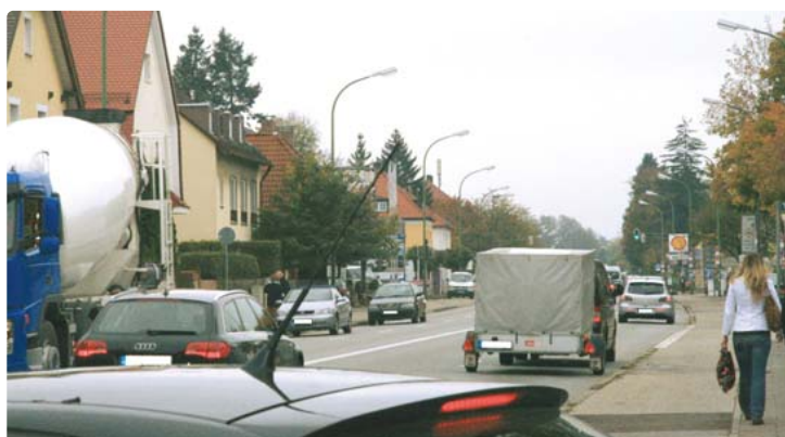
Auto an Auto und weitestgehend baumlos: So kennen die Obermenzinger ihre Verdistrasse. Die Bürgerversammlung forderte nun zumindest einen lärmmindernden Straßenbelag, Lärmschutz am Kreisell und Tempo 60 fürs Autobahnende.