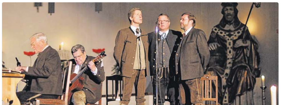
Zum Auftakt der Karwoche lädt der Schwanthalerhöher Dreigsang zum Passionssingen in die Kirche St. Rupert ein.