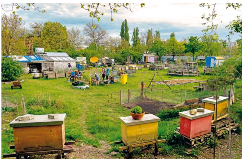
An der Schwere-Reiter- / Ecke Emma-Ihrer-Straße hatte „o'pflanzt is!“ seit 2011 auf über 3.000 Quadratmetern eine nachhaltige und nachbarschaftliche Vision vom „Urbanen Gärtnern“ verwirklicht.

Neuhausen/Nymphenburg · Im 9. Stadtbezirk ist es nach Angaben des Referates für Stadtplanung und Bauordnung wegen der innenstadtnahen Lage, der hohen Flächenkonkurrenz sowie anderweitiger Planungsabsichten der Stadt äußerst schwierig für den Verein „o'pflanzt is!“ geeignete Standorte zu finden, die in städtischem Eigentum sind. Seitens des Planungsreferats habe man einen Standortvorschlag an der Arnulfstraße zur Diskussion gestellt, für den eine weitere Abstimmung des Vereins mit dem Kommunalreferat erforderlich sei.