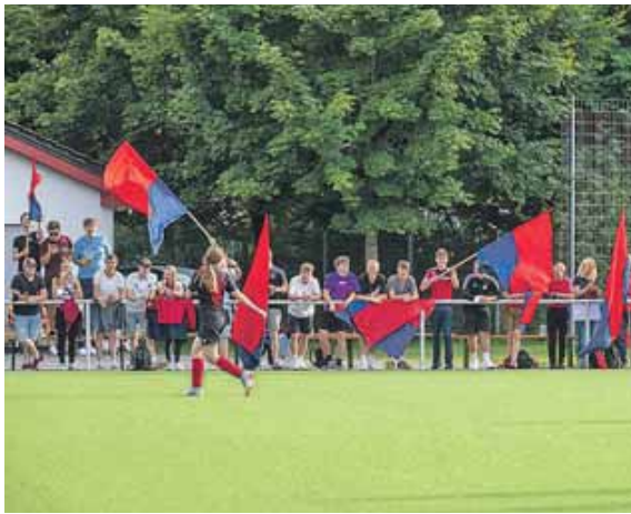
In Freundschaft verbunden: der TSV 1860 München und der SSV 1983 Weng.

MÜNCHEN - GIESING (Alfons Seeler) · Beim Spiel- und Sportverein 1983 Weng kickt man auf dem Vereinsgelände an der Friedhofstraße 20. Doch Grabesruhe herrscht dort keineswegs. Im Gegenteil, drei Herrenmannschaften, zwei Frauenmannschaften sowie Jugendteams in allen Altersklassen spielen im Trikot der Rot-Blauen aus dem Landkreis Landshut. Vor einem guten Jahr war der SSVW der erste Gegner der Frauenmannschaft des TSV 1860 München nach ihrer Wiedergründung. Zur Premiere der Löwinnen im ersten Freundschaftsspiel erschienen damals 350 Zuschauer auf der Städtischen Sportanlage an der St.-Martin-Straße in Obergiesing. Eine bunte Fanschar war extra