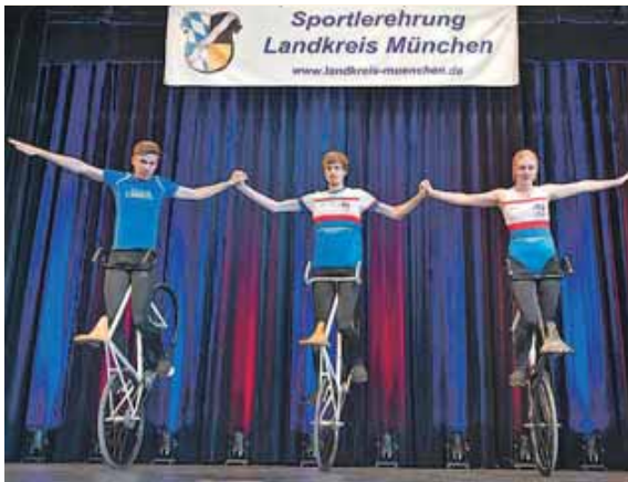
Zeigten während der Feierlichkeiten eine Kostprobe ihres Könnens: die Kunstradfahrerinnen und -fahrer des RSV Schleißheim.

(Ira/hw) · Das Who ist Who der Sportszene im Landkreis München gab sich kürzlich in Pullach ein Stell-Dich-Ein. Grund dafür war die Sportler-ehrung des Landkreises. 162 Sportler gab es für Landrat Christoph Göbel an diesem Abend für ihre Leistungen zu ehren. Eine Aufgabe, die ihn sichtlich mit Stolz erfüllte. »Die vielen erfolgreichen Sportlerinnen und Sportler vertreten den Landkreis München nicht nur regional, sondern in der ganzen Welt«, stellte Landrat Christoph Göbel, selbst Vorsitzender eines