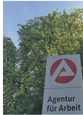
Andrea Nahles wird die neue Chefin der Bundesagentur für Arbeit.

Am 1. August ist Andrea Nahles offiziell ihre Stelle als neue Chefin der Bundesagentur für Arbeit, als erste Frau an der Spitze der Behörde, angetreten. Die 52-jährige war zuletzt Präsidentin der Bundesanstalt für Telekommunikation und zuvor in verschiedenen politischen Positionen tätig. Die ausgewiesene Arbeitsmarktpertinenz sieht einen Schwerpunkt ihrer künftigen Arbeit in der Sicherung von Arbeits- und Fachkräftebedarfen. »Es geht immer um eine: die Arbeitslosen und Beschäftigten in Arbeit bringen beziehungsweise halten«, sagte Nahles. Die Arbeitskräfte im Inland zu mobilisieren ist ein Weg, er wird jedoch nicht ausreichen, um den Fachkräftebedarf zu decken. »Zusätzliche Erwerbsmigration ist notwendig. Wir brauchen nicht