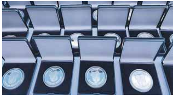
Zahlreiche Sportler wurden kürzlich für ihre sportlichen Leistungen vom Landkreis München geehrt.

Landkreis München ehrt seine erfolgreichen Sportler