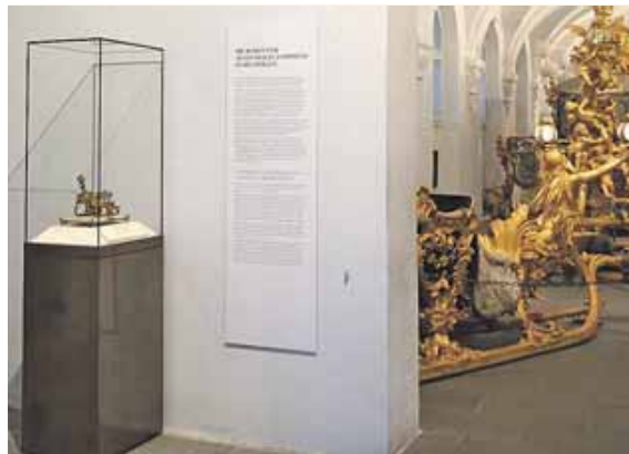
Im Marstallmuseum kann man jetzt das vergoldete Modell des Puttenschlittens am Eingang zur Wagenhalle König Ludwigs II. sehen.

Das Modell zum Puttenschlitten König Ludwigs II. wurde aus vergoldeter Bronze und Email um 1872 in München gefertigt. Der Sockel besteht aus Alabaster. Das Modell zeugt davon, wie intensiv sich Ludwig II. persönlich an der Herstellung seiner Prunkfahrzeuge beteiligte. Der König war von der Idee bis zum letz-