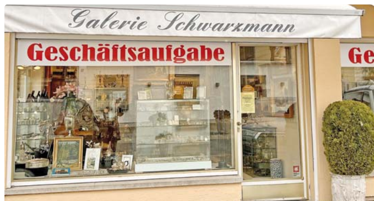
Die Galerie Schwarzmann schließt.