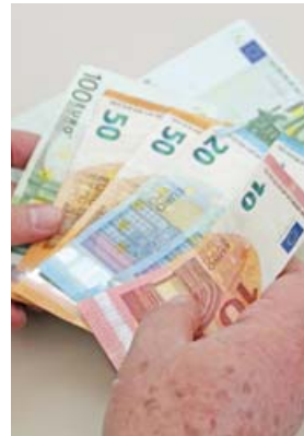
Auch 2020 kann es wieder Geld für Vereine geben.

LANDKREIS · Der Freistaat gewährt entsprechend seiner Sportförderlinien pauschale Zuwendungen für den Sportbetrieb von rechtsfähigen Sportvereinen. Die daran interessierten Vereine werden vom Landratsamt gebeten, die Zuschüsse rechtzeitig zu beantragen. Der Stichtag für die Beantragung der Vereinspauschale ist der 1. März 2022. Für die Einhaltung des Stichtags ist das Datum des Poststempels entscheidend. Die Anträge müssen mit den erforderlichen Anlagen (Originale der gültigen Übungsleiter-Lizenzen) spätestens am 1. März beim Landratsamt oder bei der Deutschen Post beziehungsweise einem lizenzierten Postdienstleister abgegeben worden sein. Aufgrund der Corona-Pandemie wird gebeten, von persönlichen Versprachen Abstand zu nehmen.