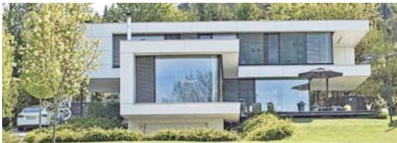
Flaches Dach, kubische Baukörper – das kommt bei vielen Bauherren gut an.

sachliche Bauhaus-Architektur für viele Menschen Ausdruck von Individualität und Stilsicherheit. „Auch bei anderen Alltagsgegenständen wie Autos, Möbeln oder Smartphones sind funktionale, möglichst schnörkellose Designs beliebt“, so der BDF-Sprecher. Besonders einfach und komfortabel sind Fertighäuser für den Bauherrn, wenn er sich für eine schlüsselfertige Bauausführung entscheidet. Laut einer Umfrage unter den BDF-Mitgliedsunternehmen werden fast 90 Prozent schlüsselfertig oder in einem weit fortgeschrittenen Maß bezugsfertig ausgeführt. „Auch das passt in die heutige Zeit, in der viele Familien zeitlich immer stärker eingespannt sind oder das Mehr an Komfort besonders schätzen. Mit einem schlüsselfertigen Holz-Fertighaus kommen sie entspannt und planungssicher in ihrem individuellen Traumhaus an“, schließt Tews. Weitere Informationen unter www.fertigbau.de im Internet. red