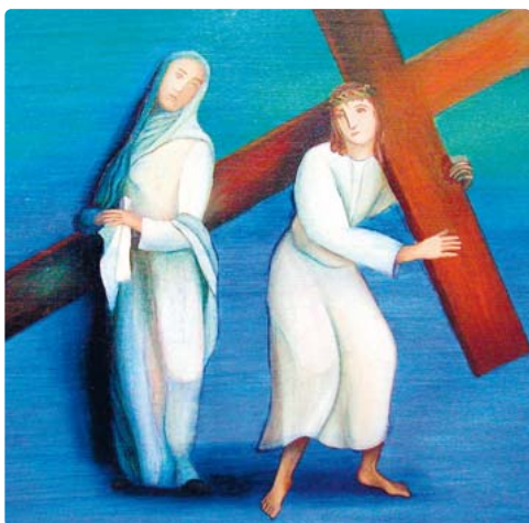
Was steht im Römerbrief und was ist die zentrale Botschaft eines der berühmtesten biblischen Texte?

Germering · Die freie evangelische Gemeinde Germering veranstaltet bis 19. November, jeweils dienstags, einen Workshop unter dem Motto „Den Römerbrief verstehen“. In dem biblischen Text erläutert Paulus die zentralen Inhalte des christlichen Glaubens. Der Kurs behandelt den Aufbau sowie die Argumentation von Paulus und gibt Einblick in den Inhalt des Briefes. Veranstaltungsort ist das Gemeindehaus der freien evangelischen Gemeinde in Germering. (Bahnhofsplatz 10). Anmeldungen werden per E-Mail an pastor@germering.feg.de oder telefonisch unter der Rufnummer (089) 84005670 entgegengenommen. Der Eintritt ist frei. red