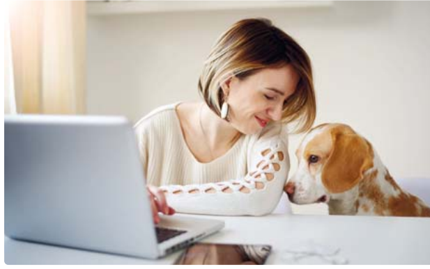
Ein Hund im Büro - das ist in immer mehr Unternehmen Alltag. Die Praxis zeigt, dass Vierbeiner die Kreativität der Mitarbeiter fördern und helfen, den Stresspegel zu senken.

txn. Hundefreundliche Büros sind heutzutage keine Ausnahme mehr. Unternehmen erlauben immer öfter die Mitnahme des Vierbeiners. Dies ermöglicht manchen Berufstätigen überhaupt erst, einen Hund zu halten. Was viele nicht wissen: Der Kollege auf vier Pfoten kann sich auch positiv auf das Arbeitsklima auswirken, sagt Petra Timm vom Personaldienstleister Randstad. „Die Praxis zeigt, dass Hunde die Kreativität der Mitarbeiter fördern und Stress abbauen.“ Das ist sogar wissenschaftlich bewiesen: So kann das Streicheln eines Hundes den Blutdruck senken und gegen Kopfschmerzen und Verdauungsbeschwerden helfen. Die Fellnasen dienen zudem als Gesprächsstoff, können selbst schüchterne Kollegen aus der Reserve locken, die Laune an-