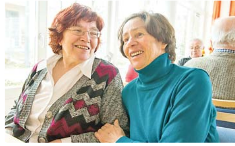
Zur großen Infoveranstaltung sind Senioren herzlich willkommen.