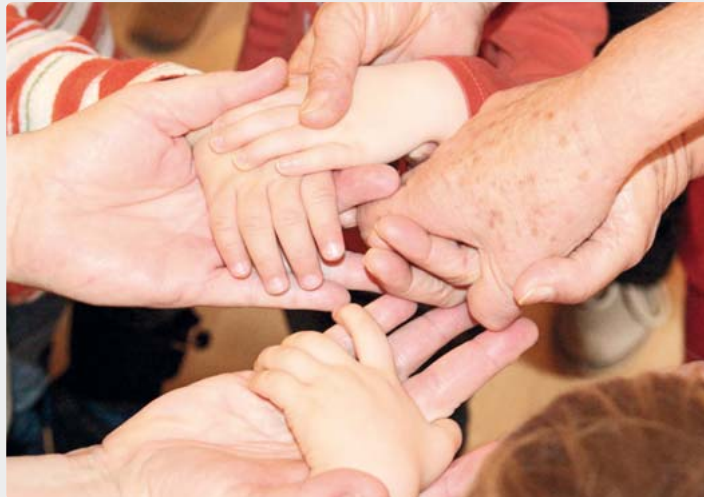
Menschen mit Demenz brauchen viel Unterstützung und Pflege von ihren Angehörigen. Über die Anzeichen einer Demenzerkrankung klärt ein Vortrag in der Gautinger Insel auf.

Bei Interesse bitten die Veranstalter um eine Anmeldung zum Vortrag, der ebenfalls kostenlos ist. Die kann telefonisch unter der Rufnummer (089) 8299200 vorgenommen werden.