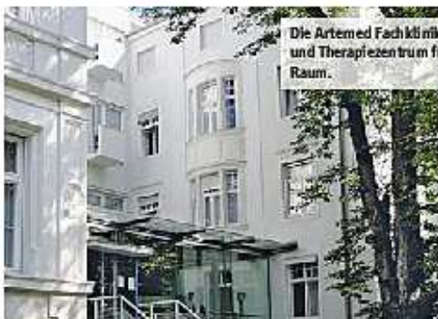
Die Artemed Fachklinik München ist das größte Diagnose- und Therapiezentrum für Venen und Haut im süddeutschen Raum.

München. Ziehen, veröden, verkleben – was hilft am besten gegen Krampfadern? Darüber diskutierten Experten vom 07. bis 09. November bei der 34. Jahrestagung der Deutschen Gesellschaft für Dermatohirurgie (DGDC) in München. Venenleiden sind in der Bevölkerung weit verbreitet, am häufigsten ist die Krampfadern Varize, Varikose. Fast jeder dritte Erwachsene hat in unterschiedlicher Ausprägung mit den nicht nur optisch unschönen Ausprägungen der hautnahen Venen zu tun, die im Laufe der Zeit zuneh-