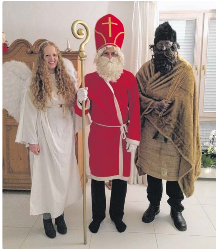
Die Jugendorganisation des Germeringer Lions Clubs organisiert auch heuer wieder einen „Nikolaus-Service“.

Leo Club Germering veranstaltet auch heuer wieder beliebte Service-Aktion