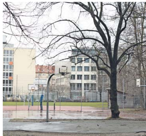
Sportplätze sollen in der dunklen Jahreszeit geöffnet und mit Flutlichtmasten ausgestattet werden, lautete eine Forderung der Bürgerversammlung Neuhausen-Nymphenburg.