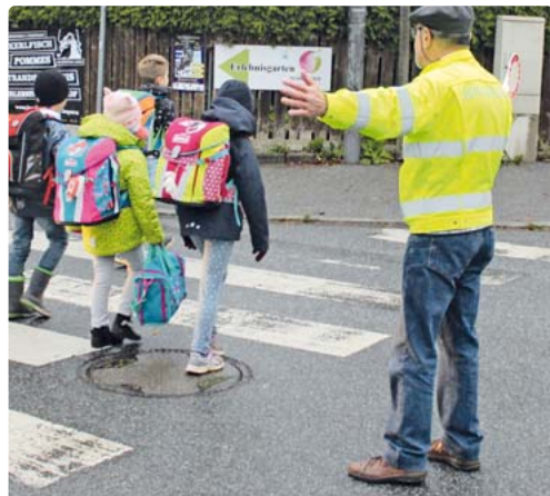
In vielen Stadtvierteln sind ehrenamtliche Schulweghelfer tätig; der Elternbeirat der Grundschule in der Helmholtzstraße bittet nun die Stadt um Unterstützung bei der Suche nach Schulweghelfern.

Im Stadtbezirk gebe es viele Gebiete, in denen man nur mit Tempo 30 fahren dürfe, erklärte eine Frau auf der Bürgerversammlung Neuhausen-Nymphenburg. Sie sei viel im Viertel unterwegs und stelle immer wieder fest, „dass sich überhaupt niemand daran hält.“ Deshalb beantrage sie, dass im gesamten Stadtbezirk mehr kontrolliert wird. Der Antrag der Bürgerin wurde mit großer Mehrheit angenommen.