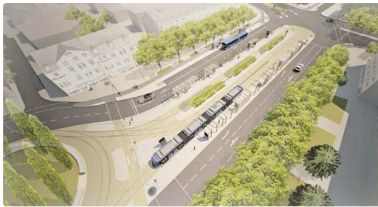
So soll der Romanplatz ausschauen, wenn der Umbau beendet ist. Ab 15. Dezember sollen die Trambahnen wieder fahren; die restlichen Arbeiten dauern voraussichtlich bis Mitte nächsten Jahres. Bild: straub architekten bda

Die Stadt solle bei der Bundesregierung eine Petition einreichen, die Gesetze so zu ändern, dass der Einsatz von Laubbläsern zumindest Privatleuten und Hausmeisterdiensten verboten werden könne, „weil die Aufrufe und Appelle des Bundesumweltministeriums an die Vernunft kaum etwas bringen“, forderte ein Bürger in einem Antrag, der mehrheitlich angenommen wurde. „Die Laubbläser blasen Abfall von einem Eck ins andere und wirbeln dabei gesundheits-