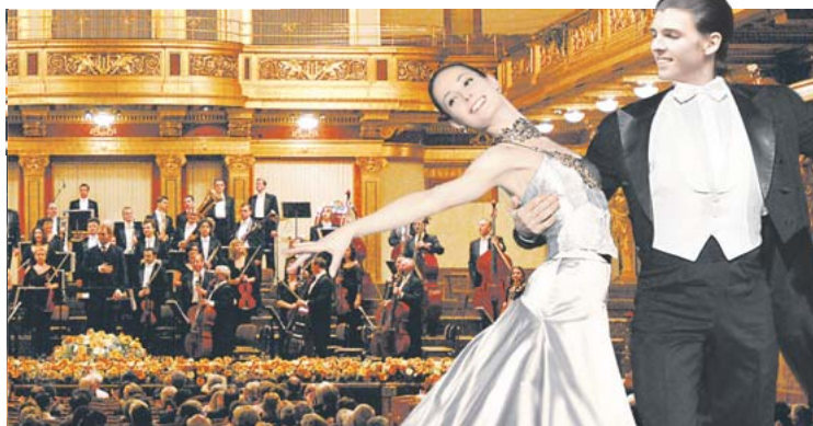
Bald im Herkulesaal: K&K Philharmoniker und Ballett gemeinsam auf der Bühne.