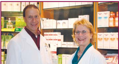
Das Team der Hirschgarten Apotheke nimmt sich gern Zeit rund ums Thema Gesundheit.