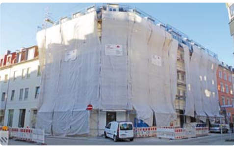
Stadtteilbewohner beklagten über Jahre den Leerstand im „Schnitzelhaus“ an der Holzapfelstraße. Die Stadt verhängte daraufhin gegen die Eigentümer ein Bußgeld wegen Zweckentfremdung von Wohnraum. Wann hier nun Wohnungen beziehbar sind und wer sich die Miete leisten können wird, steht noch nicht fest.

Westend · Die sogenannte Gentrifizierung greift im Westend schon längst. Einige Stadtteilbewohner fürchten durch Modernisierungen und drohende Mieterhöhungen aus dem Viertel verdrängt zu werden. Ein „Beratungs- und Informationsbüro für von Verdrängung bedrohte Bürger“ wurde daher in der diesjährigen Bürgerversammlung an der Schwantalerhöhe gefordert. Das Sozialreferat lehnt die Einrichtung eines solchen Büros jedoch ab und erklärt: „Aus fachlicher Sicht des Sozialreferats ist die Einrichtung eines bzw. ist die Einrichtung mehrerer Informationsbüros nicht notwendig, da bereits jetzt in ausreichendem Maße Möglichkeiten bestehen, diesen Personenkreis beratend zu unterstützen.“