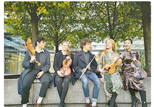
Die Gruppe „Okmo-Kollektiv“ lernte sich an der Musikhochschule in München kennen. Am Samstag, 14. Dezember, spielen die Musiker zum Jubiläums-Fest in der „Färberei“.

In der „Färberei“ sind verschiedene staunenswerte Projekte zu besichtigen: In der ersten Etage ist die Ausstellung „Selbstportrait, Triptychon, Zukunft“ der „Köskographen“ zu sehen. Das Kollektiv untersucht das Verhältnis von Natur und Kultur und dessen Auswirkung auf Gesellschaft und Individuum. Die Gruppe setzt sich aus Menschen mit verschiedenen kulturellen und sozialen Hintergründen sowie Altersgruppen zusammen. 2011 gründeten sich die „Köskographen“, als An-