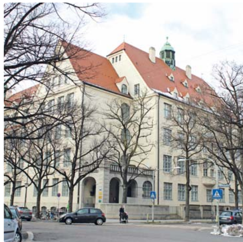
Schulbauoffensive: Die Winthirschule muss dringend erweitert werden.