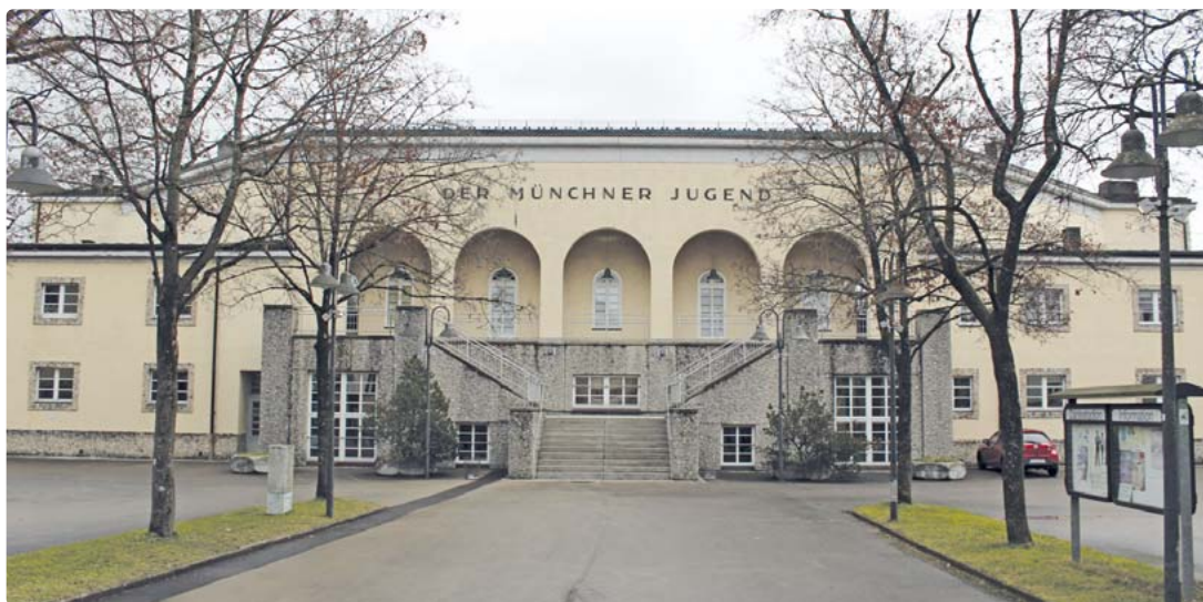
Das Dantestadion wurde im Jahr 1928 eröffnet.