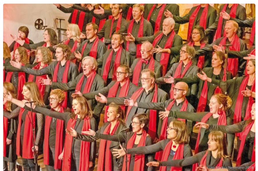
Der Nymphenburger Gospelchor Stephanus Voices lädt zum Weihnachtskonzert ein.

Samstag, 14. Dezember, um 20 Uhr, Stephanuskirche, Nibelungenstr. 51