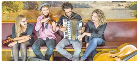
Dreiviertel der NouWell Cousins entspringen der Musikerfamilie Well.

Volksmusik, irische Bräuche und ein kleiner Rabe