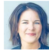
Annalena Baerbock, Bundenvorsitzende von Bündnis90 / Die Grünen.