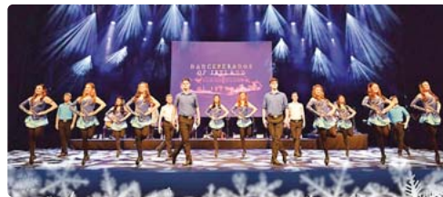
Tanzwütiges Ensemble: „Danceperados of Ireland“.

Germering · Musikalische Highlights und ein lustiges Kindertheater gibt es in der kommenden Woche in der Stadthalle Germering (Landsberger Str. 39).