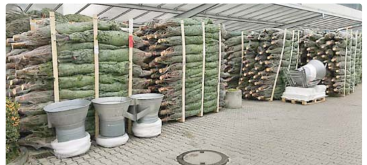
Der Christbaum-Verkauf bei Häusler startet am Samstag, 7. Dezember, um 9 Uhr an allen 14 Häusler-Niederlassungen.

da, Mazda, Fiat – und erstmals auch Citroën – zu exklusiven Preisen an. Im Mai hat das Autohaus sein Markenportfolio um die bunte Modellpalette von Citroën erweitert. Infos unter www.haeusler.de .