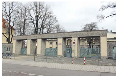
Muss saniert werden: das Dantestadion.

Im Dante-Stadion bestehen erhebliche Raumdefizite, die im Bestand – aufgrund der Grünflächen und Raumzuschnitte – nicht mehr adäquat untergebracht werden können. So fehlen eine Sicherheitszentrale, Trainings- und Büroräume für die Vereine, Umkleiden in einer gewissen Größe (für 50 Feldspieler) und Versorgungsräume (Catering) für Wettkämpfe, Punktspiele und sonstige Veranstaltungen. Laut Referat für Bildung und Sport muss darüber hinaus die Zentrale Service-Werkstatt des Geschäftsbereichs Sport aus dem Grünwalder Stadion auslagert werden, da die ohnehin knappen Flä-