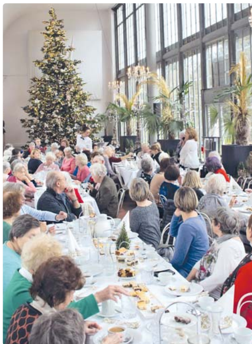
100 Senioren waren zum Weihnachtscafé eingeladen, das der Verein für Stadtteilkultur Neuhausen-Nymphenburg organisiert hatte.

kamen so schnell miteinander ins Gespräch. „Das Senioren Weihnachtscafé ist eine tolle Sache und bringt auch diejenigen zusammen, die kaum Kontakte haben oder deren finanzielle Möglichkeiten beschränkt sind“, freute sich Staudenmeyer. Das stimmungsvolle Rahmenprogramm der Familienmusik Pfundmair mit Gesang, Klarinette, Akkordeon und Okarina stimmte auf Weihnachten ein. Anklang fanden auch die von Gigi Pfundmair vorgebrachten weihnachtlichen bayerischen Geschichten. „Der wunderschöne, riesige Weihnachtsbaum und die klassischen weihnachtlichen Lieder und Geschichten gefallen mir sehr gut“, schwärmte eine 80-jährige Bewohnerin einer Seniorenwohngemeinschaft, „genau das ist für mich Weihnachten.“ sb