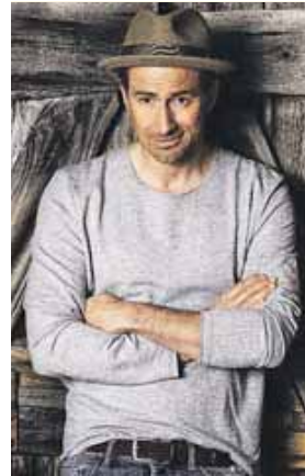
Harry G wird im Rahmen der Feierlichkeiten in Brunnthäl auftreten. Jetzt Karten sichern.