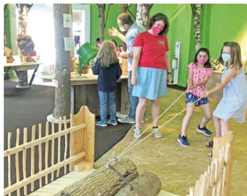
Ganz schön schwer, so ein Holzstamm. Gemeinsam geht es aber gleich viel leichter, stellen die Besucher des Kindermuseums fest.

von Kindern und Pädagogen gemeinsam entwickelt und gebaut. Das Kindermuseum hat außerhalb der Sommerferien immer donnerstags und freitags von 14 bis 17 Uhr geöffnet, zudem am Wochenende und Feiertagen von 10 bis 17 Uhr. In den Sommerferien sind die Pforten von Dienstag bis Sonntag von 10 bis 17 Uhr geöffnet. Der Eintritt kostet 5,50 Euro, bei Gruppen ab zehn Personen 4,50 Euro, Familienbanden zahlen 16 Euro. In den Ferien können Gruppen (Betreuungsgruppen) das Museum für einen Besuch auch vorab buchen unter www.kindermuseum-muenchen.de hw ghw