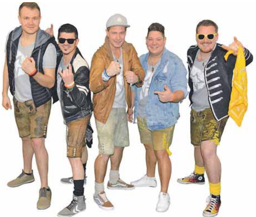
Nachtstark – Die Kultband vom Münchner Oktoberfest.