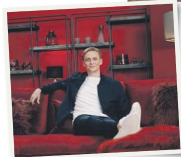
Matthias Schweighöfer fühlt sich sichtlich wohl als Markenbotschafter für XXXLutz.

alt, er spricht einfach alle an«, sagt Konrad Nill, Marketingleiter von XXXLutz Deutschland, der Parallelen zum weiteren nachhaltigen Wachstum des familiengeführten Unternehmens mit Wurzeln in Öster-