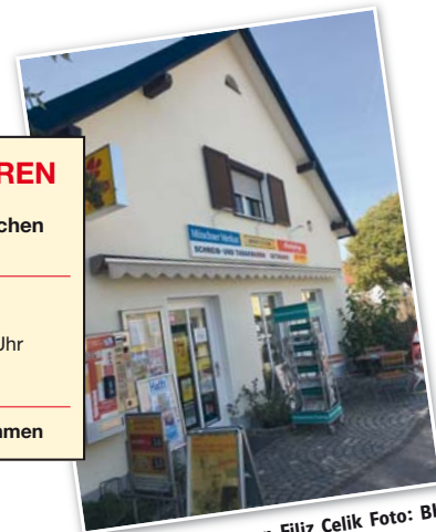
Lotto & Schreibwaren Filiz Celik