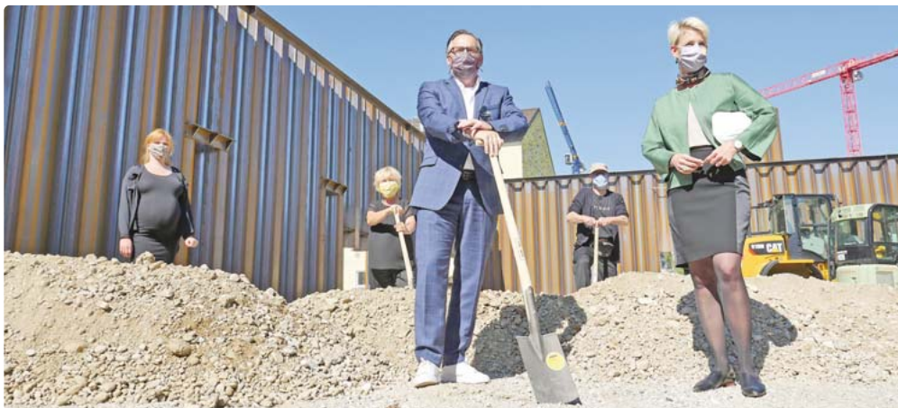
Spatenstich in Corona-Zeiten: Bürgermeisterin Katrin Habenschaden zusammen mit Kulturreferent Anton Biebl auf der Baustelle für die Interimsspielstätte des „schwere reiter“ im Kreativquartier.

Neuhausen/Nymphenburg - Bürgermeisterin Katrin Habenschaden und Kulturreferent Anton Biebl haben mit dem Architekten, dem Bauherrn und der Theaterleitung die Baustelle für das Interimsgebäude „schwere reiter“ auf dem Kreativquartier besichtigt. Seit August entsteht auf den Flächen des Kreativlabors der Stadt München ein temporärer Neubau für das „schwere reiter“. Diese Produktions- und Spielstätte für die freie Szene im Besonderen für Tanz, Theater und Musik hat seit ihrer Gründung im Jahr 2008 einen festen Platz im kulturellen Angebot der Stadt München und wird vom Kulturreferat der Landeshauptstadt unterstützt.