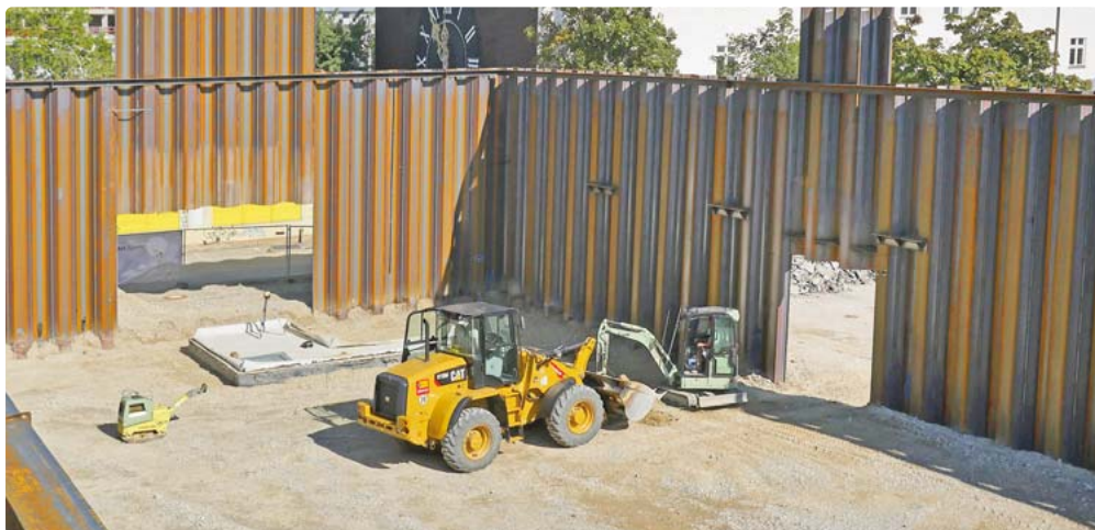
Aktuell laufen die Bauarbeiten für die neue Spielstätte des „schwere reiter“ im Kreativquartier. Die Eröffnung ist für Spätsommer 2021 geplant.