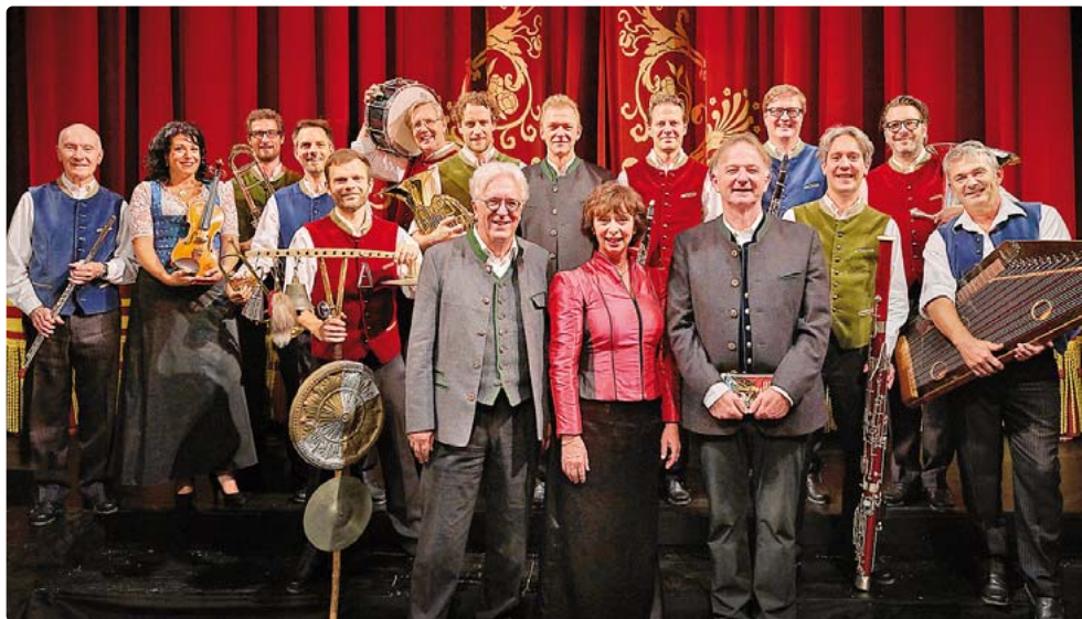
Das Ensemble verlegt die Szenerie der Opern zumeist ins bayrische Land.

Der fliegende Holländer vom Starnberger See