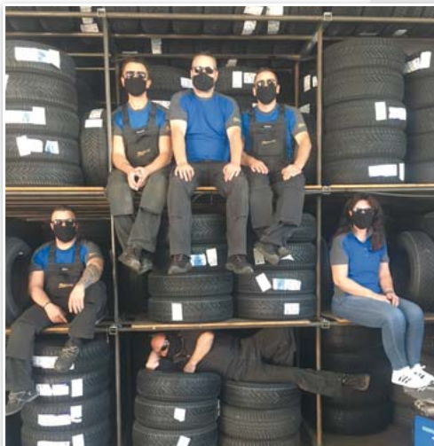
Das Team vom Reifenservice Leupold

Ihre Dienstleister & Fachhandel in der Eversbuschstraße