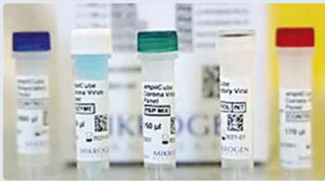
Der Corona-Schnelltest von Mikrogen: ampliCube Coronavirus SARS-CoV-2.