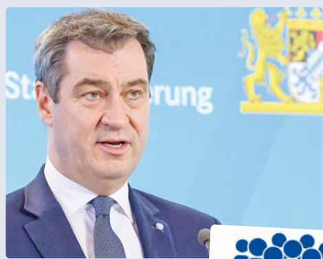
Ministerpräsident Markus Söder: „Keine Sorglosigkeit walten lassen!“

„Ich weiß, dass es keine leichte Zeit für die Menschen ist. Ich kann Ihnen versichern: Es ist notwendig!“, wandte sich Söder an die Bürger. „Wir können uns nicht wegdrücken. Wir werden diese Prüfung bestehen. Wir kommen da durch!“