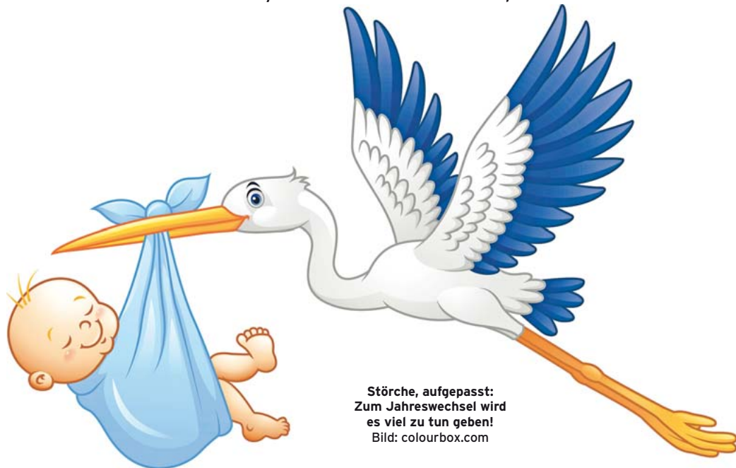
Störche, aufgepasst: Zum Jahreswechsel wird es viel zu tun geben!

Jahreswechsel mit Babyboom und Urlaubssperre für Hebammen