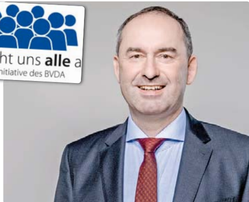
Bayerns Wirtschaftsminister Hubert Aiwanger.