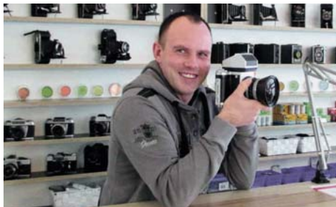
Die Mitarbeiter von der Firma Analog Lounge GmbH kennen sich bestens aus.

Die ältere Dame wartet geduldig, während der 36-Jährige die Kamera dreht und wendet, Auslöser und Rückspulauslöser betätigt und den Bereich, in den man