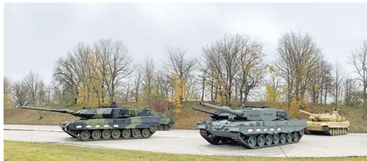
Die Panzerteststrecke von Krauss-Maffei Wegmann besteht schon seit 1964 und soll nun nach dem Bundes-Immissionsschutzgesetz (BImSchG) neu genehmigt werden.

„Im konkreten Fall tut er das Gegenteil, trifft sich informell mit dem Antragsteller, der Gewerkschaft sowie dem Vertreter der Geneh-