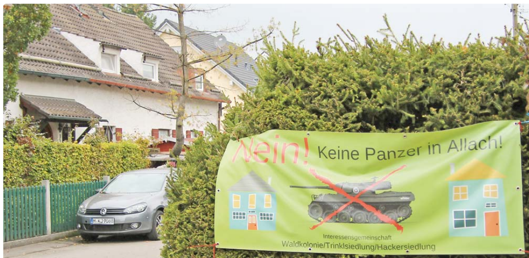
„Nein! Keine Panzer in Allach!“: Die Anwohner der Waldkolonie in unmittelbarer Nähe der Teststrecke machen deutlich, was sie darüber denken.

Panzerteststrecke: Grüne über scharfe Kritik am Vorgehen