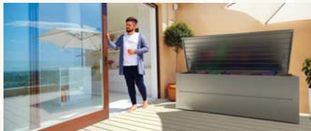
Hier findet alles seinen Platz: Wetterfeste und robuste Boxen aus Stahl sorgen auf Terrasse und Balkon für Ordnung.

Ordnungssysteme für den Außenbereich gibt es in zahlreichen Ausführungen und Preisklassen. Doch die Unterschiede sind groß. Eine Gartenhütte, die schon beim Aufbau einen wackeligen Eindruck macht, wird kaum auf Dauer Wind und Wetter trotzen können. An soliden Aufbewahrungsboxen und Gartenhütten haben Gartenbesitzer länger Freude. Aus rostfreiem hochwertigem Edelstahl sind etwa die Produkte von Guardi gefertigt. Das Material