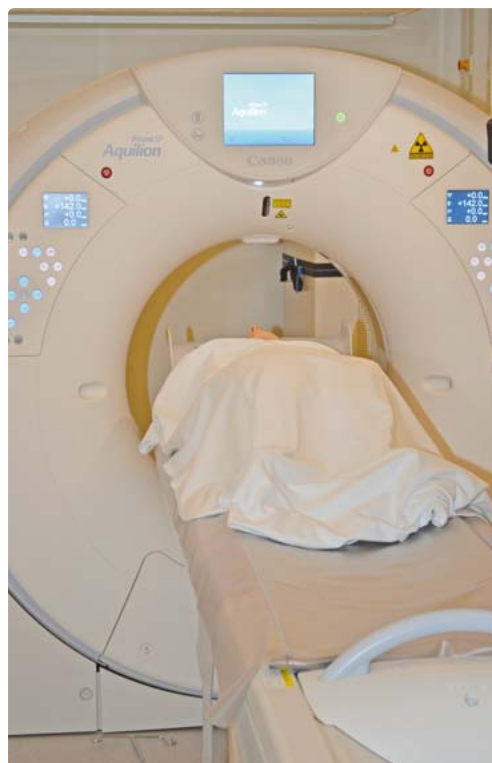
Neun Minuten nach dem wenige Sekunden dauerndem CT ist das Ergebnis da.

Noch vor einem bestätigten Corona-Labortest liefert die CT-Aufnahme des Brustkorbs charakteristische Anzeichen der virusbedingten Erkrankung. Patienten mit dem Coronavirus können damit schnell und sicher behandelt werden. Im weiteren Krankheitsverlauf gibt das System zudem wichtige Hinweise bei akutem oder drohendem Lungenversagen. Niedrige Dosiswerte reduzieren die Strahlenbelastung für Patienten.