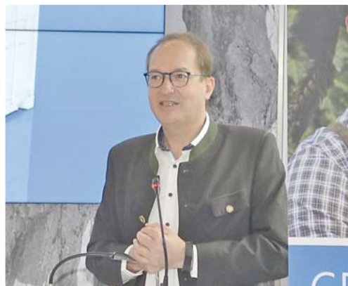
Alexander Dobrindt: „Ländliche Regionen stärken!“

Die 1,2 Millionen teure Technik, finanziert aus dem Corona-Nothilfe-Programm des Freistaates, ist eine Leihgabe