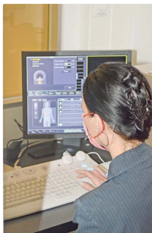
Eine Mitarbeiterin steuert in einer eigenen Kabine die Technik.

für Weilheim. Auf Befragen jedoch, er gehe davon aus, dass der Container wohl auf Dauer hier bleiben werde. Weiß bestätigte: „Der Freistaat hat uns nie im Regen stehen lassen.“