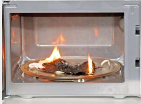
Mundschutz mit Drahtbügeln darf man nicht in der Mikrowelle „desinfizieren“, weil er Feuer fangen kann.

München · Wiederverwendbare Mund-Nasen-Masken sollten nach dem Tragen – mindestens einmal täglich – desinfiziert werden. Eine schnelle und bequeme Lösung für diese neue Alltagsaufgabe scheint die Mikrowelle zu sein. Doch Vorsicht: Bei Masken mit eingearbeitetem Draht kann es in der Mikrowelle schon nach wenigen Augenblicken zum Brandausbruch kommen, warnt wie die Münchner Feuerwehr auch das Institut für Schadenverhütung und Schadenforschung der öffentlichen Versicherer (IFS). Die elektromagnetischen Wellen in einem Mikrowellenherd versetzen die Wassermoleküle in Speisen und Getränken in Schwingung. Durch Reibung wird die Bewegungsenergie in Wärmeenergie umgewandelt. Gegenstände aus elektrisch leitfähigen Stoffen – wie zum Beispiel der Metalldraht einer Mund-Nasenmaske – wirken in der Mikrowelle wie Antennen. Ihnen wird im Garraum eine große Menge Energie zugeführt. Es kann zum Funkenschlag oder zur starken Erhitzung kommen. Beides führt zur Entzündung des Maskenmaterials, bei dem es sich in der Regel um Baumwolle oder Cellulose handelt. Zur Desinfektion von Masken mit eingearbeitetem Draht ist die Mikrowelle also ungeeignet. Alternativ können die Masken bei 90 Grad in der Waschmaschine oder durch fünfminütiges Auskochen im Wasserbad auf den nächsten Einsatz vorbereitet werden. red