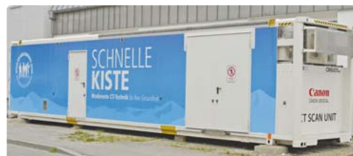
In diesem Container an der Wilhelm-Röntgen-Straße ist die CT-Scan-Technik untergebracht.