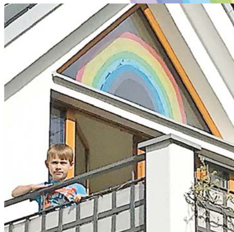
Bereits seit einigen Wochen hängt dieser Regenbogen an einem Fenster, den Luk gern mit allen Lesern teilen möchte.

Weitere Bilder finden Sie im Internet unter www.parsbergecho.de mit der Such-Nummer 2769.