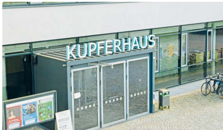
Schönes Haus, hervorragende Akustik - das Kupferhaus zieht seit Beginn vor zehn Jahren viele regional und international bekannte Künstler an. Zum Jubiläumsprogramm kann das Kulturforum Planegg alle Register ziehen.

Kulturforum Planegg präsentiert Jubiläumsprogramm fürs zweite Halbjahr