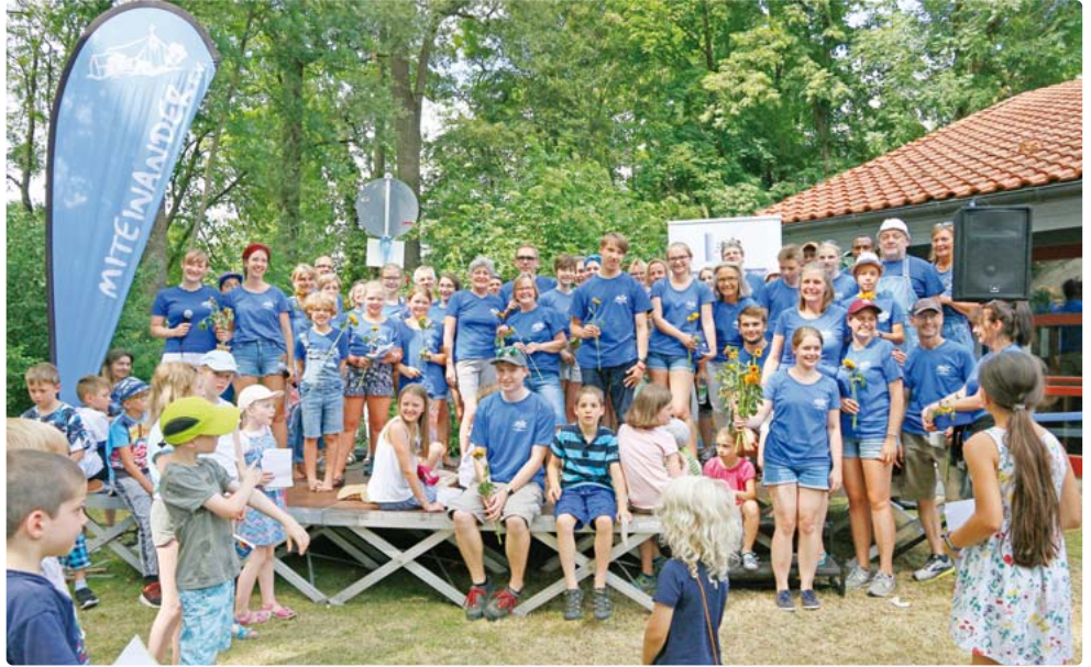
Tolles Fest - Spitzengemeinschaft! Der Verein Miteinander e.V. mit seinen rund 80 Helfern bekam viel Lob für das gelungene Entenrennen-Fest.

15. Entenrennen des Vereins Miteinander e.V.