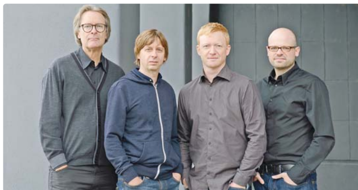
Die Gruppe ToneGallery würdigt Künstler, deren Musik heute nicht mehr genug Aufmerksamkeit erhält.