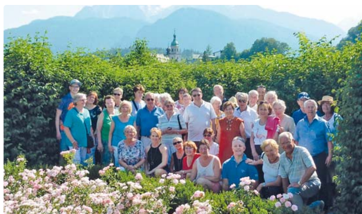
Nach Berchtesgaden führen die Damen der Frauen Union Germering.

Bei wunderbarem Wetter begleitete er die Frauenunion Germering auf einer sehr geschichtsträchtigen Tagesfahrt nach Berchtesgaden. Dabei gelang es ihm, die Reisegruppe in ein Spannungsfeld zwischen dem Wittelsbacher-Schloss mit seinen glanzvollen Kunstschatzen von Kronprinz Rupprecht einerseits und dem Kehlsteinhaus als Sinnbild für die gigantomanische NS-Ideologie andererseits zu versetzen. Von einem romantischen Rosengarten des Schlosses aus blickt man über einen land-