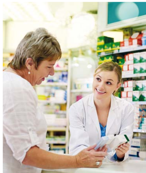
Der Umgang mit anderen Menschen macht den Beruf einer Pharmazeutisch-technischen Assistentin besonders reizvoll.

„In unseren Partner-Apotheken betreiben die Pharmazeutisch-technischen Assistenten auch aktives Marketing, planen Aktionen und Werbemaßnahmen“, so der Fachmann weiter. Zweimal im Jahr finden zudem Teamtreffen statt, bei denen Inhalte für Marketingstrategien und gute Kommunikation besprochen werden. Die PTAs geben auch Rückmeldung, welche Maßnahmen von Kunden angenommen werden und was besser und effizienter werden muss.