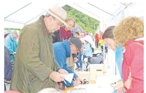
Die Unterschriftenaktion der Bürgerinitiative www.rettet-den-wuertaler-wald.de ist auch online verfügbar.

Ganz symbolträchtig pflanzten die Bürgerinitiativen eine von „Parents for future“ und von „Scientists for future“ gespendete Buche aus dem Hambacher Forst an den Neurieder Eingang zu Forst Kasten an der Gautinger Straße. Mit einem Stein ist auf die Aktion hingewiesen. Auch in den nächsten Tagen und Wochen können Bürger gegen die Waldvernichtung protestieren. Dazu haben die Initiativen Unterschriftenlisten vorbereitet, die auf der Webseite www.rettet-den-wuertaler-wald.de zur Verfügung stehen.