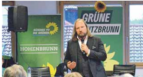
MdB Anton Hofreiter hielt eine vielbeachtete Rede im Ratssaal im Bürgerhaus Putzbrunn.

LANDKREIS MÜNCHEN (red) · »Ein starkes Europa ist grün« war der Titel eines Vortrags von Dr. Anton Hofreiter, zu dem die Ortsverbände der Grünen aus Putzbrunn, Hohenbrunn und Brunnthal in den Ratssaal im Bürgerhaus Putzbrunn geladen hatten. Vor gut 80 Zuhörerinnen und Zuhörern entfaltete der Vorsitzende des Bundestags-Ausschusses für die Angelegenheiten der Europäischen Union ein breites Spektrum von Themen, vom russischen Angriffskrieg gegen die Ukraine über die Bedrohung durch Artensterben und Klimakatastrophe bis hin zur Notwendigkeit, Demokratie und Wohlstand zu verteidigen. Diese Aufgaben seien nur gemeinsam in einem starken Europa zu leisten, das sich auch wirtschaftspolitisch gegenüber den USA und China behaupten könne. Putins Großrussland-Fantasien be-