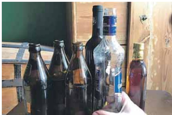
Durch die Teilnahme an Treffen der Anonymen Alkoholiker kann die Sucht zur Vergangenheit werden.

Anonyme Alkoholiker treffen sich in St. Nikolaus