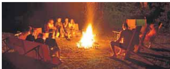
Hinein in die Natur und ab ans Lagerfeuer, heißt es wieder in den Pfingstferien.

boomerang bietet kostenfreie Ferienfreizeit