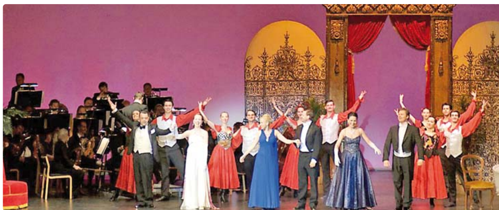
Mit einer Operetten-Gala wird das neue Jahr eingeläutet.