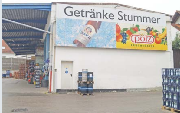
Auf dem Betriebshof von Getränke Stummer befindet sich das Lager mit den unterschiedlichsten Getränken sowie der Getränkemarkt.