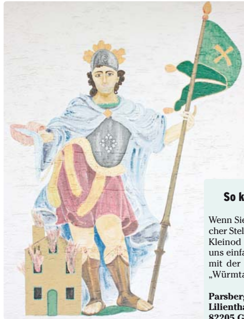
Sankt Florian löscht überall im Würmtal. Wo tut's dieser?

Jede Gemeinde im Würmtal hat - mindestens - eine Freiwillige Feuerwehr. Der heilige Florian ist aller Patron. Er war römischer Legionär (so wird er heute noch dargestellt) und verbrachte seinen Lebensabend im heutigen St. Pölten. Dann wurde er im Jahr 304 - es war die Zeit der Christenverfolgung unter Kaiser Diokletian - als Märtyrer in der Enns ertränkt. Der Wasserkübel, mit dem er abgebildet wird, deutete ursprünglich auf diese Todesart hin und wurde erst später zum Symbol für seine Schutzaufgabe. Wo aber ist unser St. Florian zu finden?