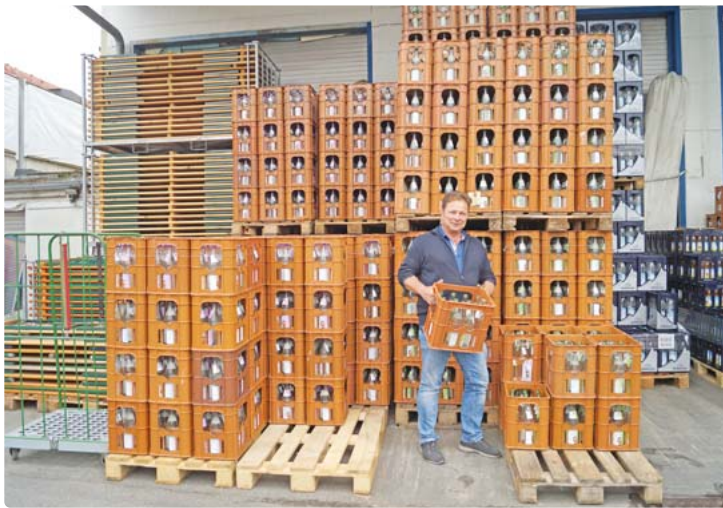
Die Hitzewelle kann kommen. Meterhoch stapeln sich die Mineralwassertragqn.

Sein Vater hat den Betrieb dann ins moderne Zeitalter überführt. Die ersten Lastwagen und Computer wurden angeschafft. In den 1970er Jahren brachte der erste Stapler eine unglaubliche Zeitersparnis. Früher hätten acht Mann sechs Stunden lang mit der Sackkarre das Leergut mühsam auf die Lastwagen gestapelt. Mit den neuen Dieselstapler konnte diese Aufgabe ohne große Anstrengung von einem Mann in einer Stunde bewältigt werden, erinnert sich Stummer. Er selbst hat bereits als Bub