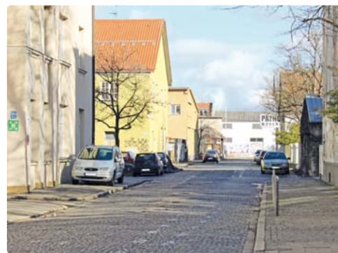
Das 20 Hektar große Areal des Kreativquartiers befindet sich 2,5 Kilometer nordwestlich der Altstadt, nahe des Olympiaparks, und liegt in den Bezirken Neuhausen-Nymphenburg und Schwabing West.

Auf dem 20 Hektar große Areal zwischen Dachauer-, Loth-, Schwere-Reiter-, Heß- und Infanteriestraße entsteht ein urbanes Stadtquartier, in dem Wohnen und Arbeiten mit Kunst, Kultur und Wissen verknüpft werden. Bestehende Nutzungen sollen dabei behutsam weiter-