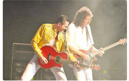
Zeitreise: Die Illusion kommt bei „A Tribute to Freddie Mercury“ dem Original sehr nah.

Queen, das ist untrennbar mit der Person Freddie Mercury verbunden – denn der geniale Frontsänger und Freigeist der britischen Rockband hat mit seiner extrovertierten Art Musikgeschichte geschrieben. In „A Tribute to Freddie Mercury“ gelingt es vor allem dem benadeten Sänger Harry Rose, die Illusion eines echten Queen-Konzerts durchzusetzen: Seine verblüffende Ähnlichkeit in Stimme, Aussehen