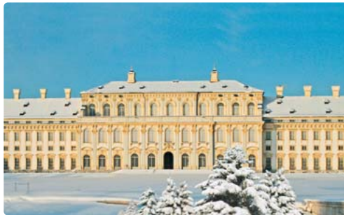
Verwandelt sich vom 8. bis zum 10. November in einen voradventlichen Traum: Schloss Schleißheim.

Geöffnet ist der Markt am Freitag von 14 bis 21 Uhr und am Samstag und Sonntag von 11 bis 20 Uhr. Der Eintritt kostet acht Euro, Kinder unter 16 Jahren sind frei. pe/pr