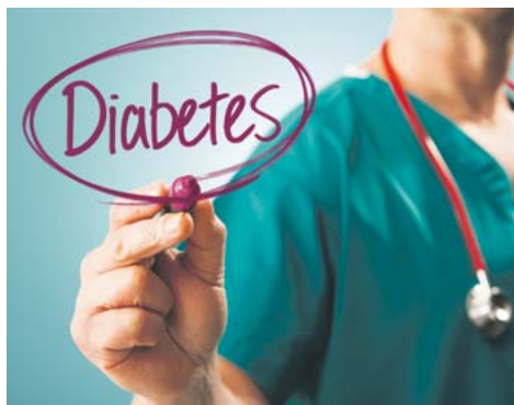
Volkskrankheit Diabetes – jeden Tag erkranken 1.000 Menschen neu

Jambulbaum „bremst“ Diabetes Eine wieder entdeckte Pflanze, der Jambulbaum