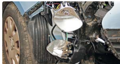
Hier hat es richtig gekracht: Bei einer schwerwiegenden Kollision ist von allen Beteiligten besondere Umsicht gefragt.