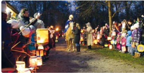
St. Martin reitet heuer zum 16. Mal durch Obermenzing.

rum Blütenburg e.V. die Durchführung des Umzuges übernimmt dessen Theatergruppe mit musikalischer Unterstützung der Würmtaler Blasmusik. Zudem stellen im Zehentstadel an diesen beiden Tagen Künstler ihre Werke aus. Diese sind am Samstag von 14 bis 19 Uhr und am Sonntag von 11 bis 19 Uhr zu sehen. Für das leibliche Wohl ist mit Kaffee und Kuchen, Kinderpunsch, Glühwein und Flammkuchen gesorgt. Alle interessierten Familien sind herzlich zum diesjährigen Martinimarkt eingeladen.