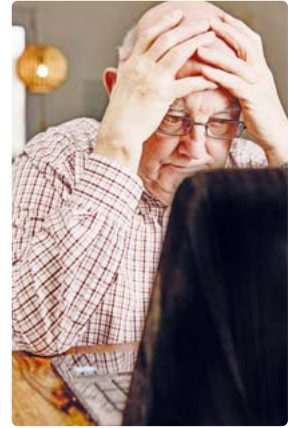
Online-Betrug hinterlässt viele Nutzer verzweifelt und hilflos.

Eine Rechtsschutzversicherung hilft auch bei Streitigkeiten im Internet. Mehr Informationen gibt es unter www.itzehoer-rechtsschutz-union.de und unter Telefon 04821-773900. Interessierte finden hier einen Berater in ihrer Nähe. Wer etwa einen Tarif mit Urheberrechtsschutz gewählt hat, kann sich beraten lassen, wenn er beim privaten Surfen eine Abmahnung erhalten hat. Denn immer öfter werden User von einem Anwalt kostenpflichtig aufgefordert, eine bestimmte Handlung zu unterlassen. Viele wissen dann nicht, wie sie sich verhalten sollen.