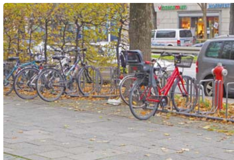
Direkt gegenüber von „Brillen Müller“ bietet ein Fahrradständer Parkmöglichkeiten für Radler.