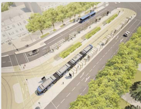
Der Romanplatz aus der Vogelperspektive als Illustration: so soll der Platz ausschauen, wenn der Umbau beendet ist. Bild: straub architekten bda

Weil sich der ein- als auch der auswärtsfahrende Verkehr rund um den Romanplatz staut, hat FDP-Stadtrat Thomas Ranft eine Anfrage zur Verkehrssituation in Nymphenburg an die Landeshauptstadt München gestellt. Die Laimer Unterführung sei seit 17. September dieses Jahres komplett gesperrt und der Romanplatz eine Baustelle mit umfangreicher Verengung und Schleifen. Die Fahrbahnbreite der Wotanstraße in Richtung Romanplatz verenge sich von zwei auf eine Fahrspur. „Ein Ausweichen auf den ÖPNV bietet keine Lösung, da auch die Busse