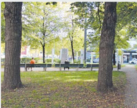
Vorschlag des Bezirksausschusses abgelehnt: Auf dem Platz der Freiheit werden die Reinigungs- und Pflegezeiten nicht erhöht.

sicht des Baureferats auch nicht erforderlich sei. Die Verkehrssicherheit sowie der Unterhalt und die Reinigung der auf dem Platz installierten Stelen hingegen obliege alleine dem Künstler Wolfram Kastner, der für die Aufstellung eine befristete Sondernutzungserlaubnis durch das Kreisverwaltungsreferat (KVR) erhalten habe. sb