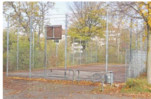
Die Chillecke vor dem Eingang zum Sportplatz des Adolf-Weber-Gymnasiums kann nach Angaben der Stadt nicht erweitert werden.

Dieser Bereich wird von Jugendlichen gut und bisher ohne bekannte Konflikte mit der Schullnutzung angenommen“, heißt es von Seiten des Referats für Bildung und Sport. Daneben befindet sich der Eingangsbereich des Sportplatzes, sowie die Fahrradabstellplätze für die Schüler des Adolf-Weber-Gymnasiums. Diese Fahrradabstellplätze seien baurechtlich erforderlich und genehmigt. Die Bepflanzung mit weiteren Bäumen, Büschen und das Aufstellen von Mobiliar seien somit aus Platzgründen nicht umsetzbar. Die Landeshauptstadt Mün-