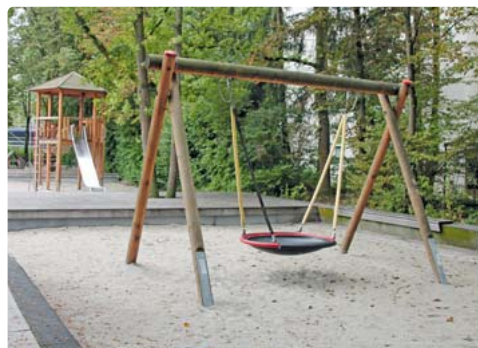
Eine Vogelnestschaukel so wie auf unserem Foto wünscht sich der BA 22 für den Spielplatz an der Hohenesterstraße.

Jetzt soll die Münchner Verkehrsgesellschaft prüfen, ob dort ein größeres Wartehäuschen und ein weiterer Mülleimer aufgestellt werden könnten. Außerdem sollten auf der Strecke größere Busse und ein Zehn-Minuten-Takt eingeführt werden. Neben vielen Schülern, die in den Bildungscampus fahren, würden auch die Bewohner der Gemeinschaftsunterkunft und der beiden neuen Wohnanlagen regelmäßig mit den Bussen fahren. „Für Eltern mit Kinderwagen und Menschen mit Mobilitätseinschränkungen ist es sehr schwer geworden, einen Platz in diesem Bus zu erhalten“, so die Antragsteller. pst