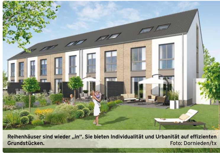
Reihenhäuser sind wieder „in“. Sie bieten Individualität und Urbanität auf effizienten Grundstücken.