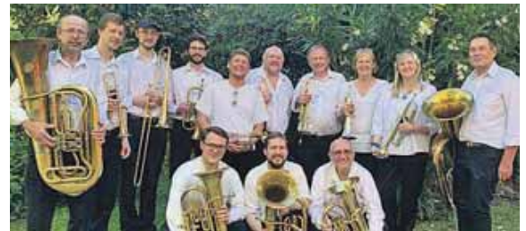
Der Posaunenchor aus Villa Ballester spielt am 26. April mit dem Posaunenchor der Lätarekirche.

13 Künstler aus Argentinien und 20 Künstler aus München bereiten sich schon intensiv auf das Konzert in der Lätarekirche vor. Der Eintritt ist frei.