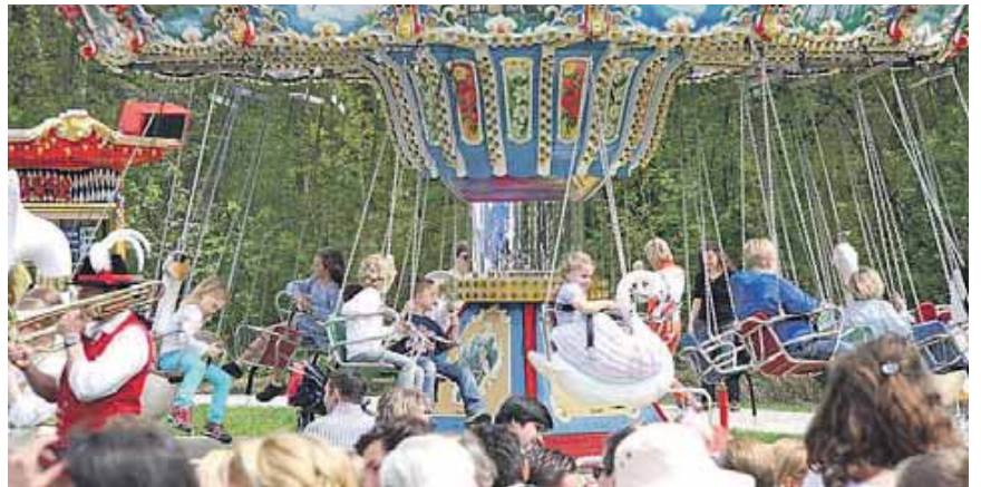
Am Pfingstweekende wird wieder das Burschenfest der Harlacher Burschen gefeiert. Auch sonst ist wieder jede Menge geboten.

Brauchtum und Geselligkeit rund um den Maibaum