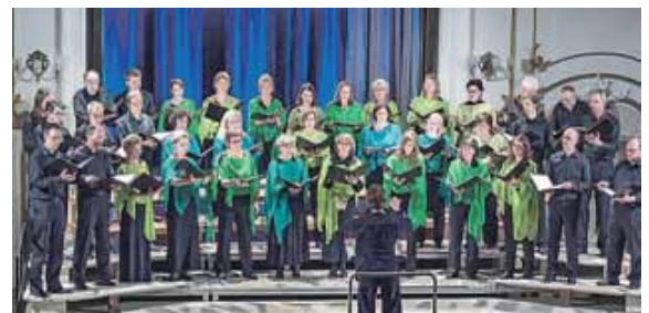
Der Holzkirchner Chor cantica nova lädt zu himmlischen Klängen ein.

monische Klänge, spannende Rhythmen und eingängige Volksliedmelodien. Tickets gibt es zu 15 Euro, erm. 13 Euro, Jugendliche 13 bis 18 J.: 8 Euro, Kinder -12 J.: 6 Euro. Karten gibt es online: www.kultur-im-oberbraeu.de oder telefonisch: 08024/478.505 sowie an der Theaterkasse: Di bis Mi von 10 bis 12 Uhr sowie Do und Fr von 18 bis 19 Uhr. Die Abendkasse öffnet eine Stunde vor Beginn.