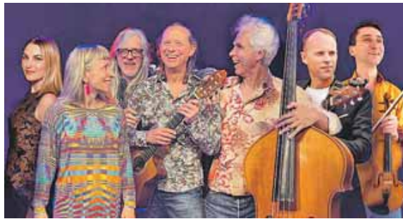
Zahlreiche Künstler haben sich für das Friedenskonzert am 30. April zusammen gefunden.

sich die Frage: »Was können wir als Einzelne tun?« Die unablässigen Kriegsberichte an verschiedenen Kriegsschauplätzen lassen uns mehr und mehr abstumpfen. Untätigkeit bedroht die Demokratie, dagegen wollen, nein müssen wir aktiv werden«, lautet das Credo der beteiligten Künstler. Mit dieser Musik soll ein Zeichen gesetzt werden. Der Eintritt ist frei, um Spenden wird gebeten.