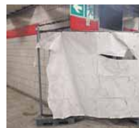
Die BI »Mehr Platz zum Leben« mahnt die Fertigstellung der Toiletten am Kolumbusplatz an.

bürgerschaftliches Engagement«, bedauert sie und klagt an: »Der 'Halt 58' verkommt immer mehr zur öffentlichen Toilette.« Die Pas-