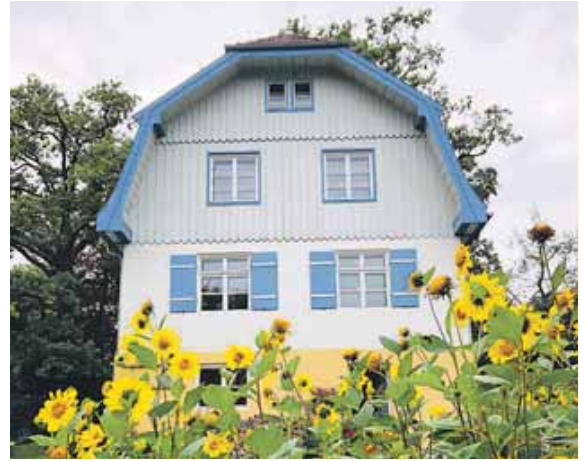
Beim Ausflug nach Murnau bietet sich ein Besuch des Gabrielle Münterhauses an.

Am Montag, 29. April, führt die Besucher des ASZ ein Ausflug um 9.00 Uhr nach Murnau am Staffelsee. Besichtigt