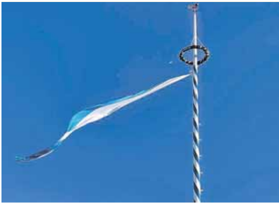
Am 1. Mai finden vielerorts rund um die Maibäume wieder zünftige Feiern statt. So auch in Perlach und Untergiesing. Al- le sind zum Mitfeiern eingeladen.

Ab 10.30 Uhr sorgt das Blaser- chester St. Michael Perlach