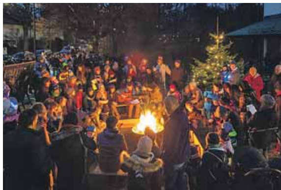
Die evangelische Gustav-Adolf-Gemeinde läutet am Wochenende die Adventszeit ein.

Am Samstag und Sonntag können im Gemeindefest eine Vielzahl von Bastelarbeiten erworben werden, die der Bastelkreis der Gemeinde hergestellt hat – außer weihnachtlichem Schmuck aller Art gibt es Seidenmalerei, Karten, Marmelade und Kerzen und vieles mehr. Mit Kaffee und Kuchen kann man sich in der Kaffeestube verwöhnen lassen. Der Erlös des