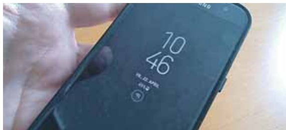
Die Stadtbibliothek hat viele digitale Angebote, die auf dem Smartphone oder Tablet nutzbar sind.

Haidhausen (red) · Wer einen Ausweis bei der Münchner Stadtbibliothek hat, weiß oft nicht, dass neben der Medienausleihe auch digital so einiges möglich ist: Zugang zu eBooks und anderen eMedien, unterschiedlichen Datenbanken, digitalem fremdsprachigen Angebot und Online-Inhalten für Kinder. Interessenten er-