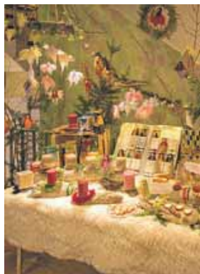
Der Bastelkreis der Gemeinde bietet im Gemeindefest eine Vielzahl von Bastelarbeiten an.

Marktes kommt der Gemeinde für Sanierungsarbeiten zugute. Der Adventsmarkt hat am Samstag von 14.30 bis 18.30 Uhr und am Sonntag von 11 bis 13 Uhr geöffnet. Am Samstag öffnet zusätzlich von 14.30 bis 18.30 Uhr der »Adventszauber« mit Glühwein, Punsch, Bratwürstel und Waffeln im Garten der Kirchengemeinde.