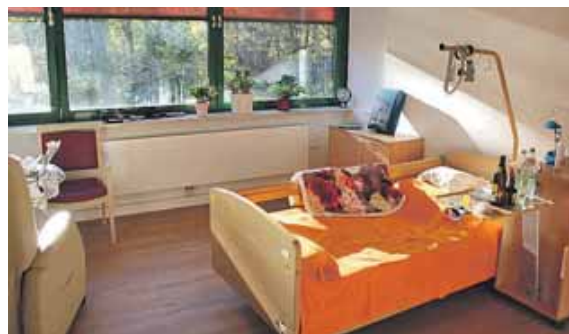
Das Heim in der Gravelottestraße beherbergt jetzt 102 Pflegeplätze mit 51 Einzelzimmern.