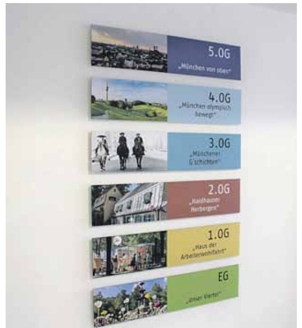
Die Geschosse wurden individuell nach Themenmotiven gestaltet – mit Bezug auf das Franzosenviertel, die AWO-Geschichte oder München allgemein.

Von außen merkt man dem Gebäude außer der frischen Farbe nur wenig Veränderung an. Bei der Sanierung wollte die AWO einerseits viel Gebäudesubstanz erhalten, andererseits der Einrichtung eine zukunftsfähige Funktionalität geben. Da die Einrichtung einer Pflegeheimgeneration angehört, die nach dem Vorbild von Kliniken gebaut wurde, bestanden bis in die 90er Jahre noch Drei-Bett-Zimmer bei insgesamt 148