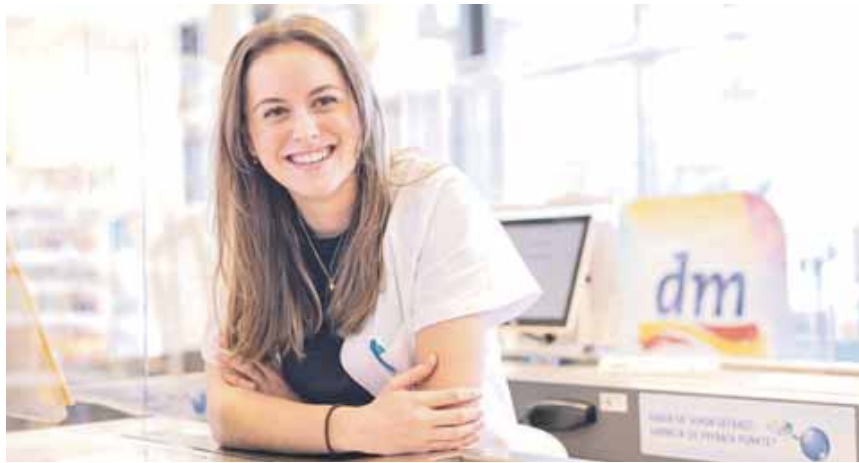
Erfolgsrezept: Bei dm-drogerie markt treffen die Teams vor Ort die Entscheidungen.

Die Marktforscher haben für dm 24,8 Prozent Umsatzan-