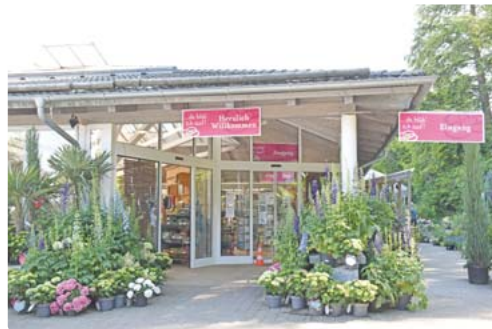
Mit Tradition: Die Gärtnerei Fischer gibt es schon seit 1955.

Die Gärtnerei Fischer in Starnberg ist eine der großen und alteingesessenen in der Region. Die ehemalige Schlossgärtnerei des Palais Sonnenhof wird seit 1955 von der Familie Fischer geführt, mittlerweile in der dritten Generation. Der Ladenverkauf hatte wegen des Lockdowns geschlossen, aber die Leute verlangten nach Ware – sie waren während des Zwangsurteils oder Homeoffice daheim und hatten Zeit für ihre Gärten. Die Fischers reagierten deshalb mit einem Lieferservice über Internet und Facebook.