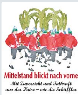
Mittelstand blickt nach vorne Mit Zuversicht und Tatkraft aus der Krise – wie die Schöffler

In loser Folge stellen wir lokale Unternehmen vor und zeigen, wie sie die Herausforderungen bewältigen.