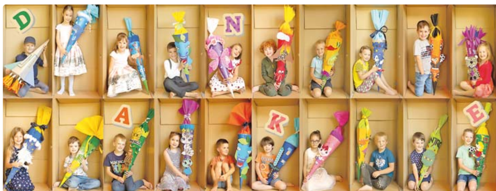
Die Vorschulkinder wurden einzeln fotografiert - und dann zur Gruppe vereint.