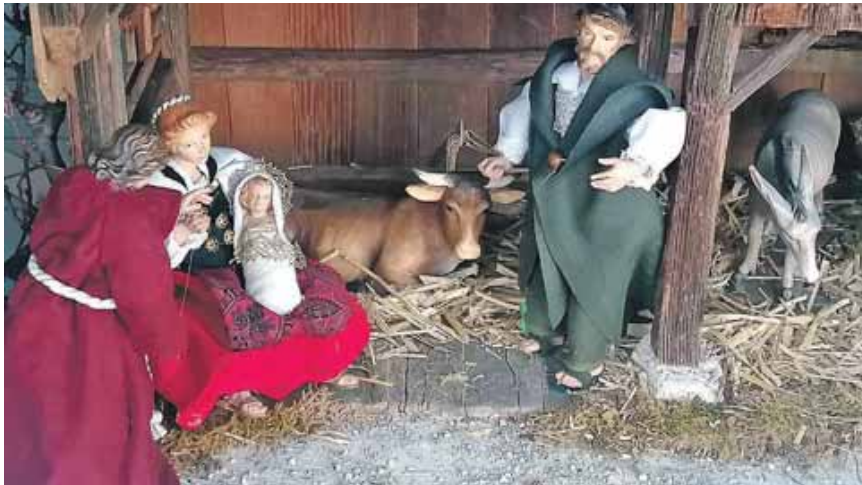
Bei Familie Bögl findet die Heilige Familie unter einem Unterstand vor dem Stall Unterschlupf.