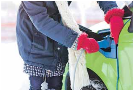
Im Winter sinkt die Reichweite der E-Autos.

Kalte Temperaturen im Winter sorgen nicht nur dafür, dass der Kraftstoffverbrauch von Verbrennungsmotoren steigt, auch die Reichweite