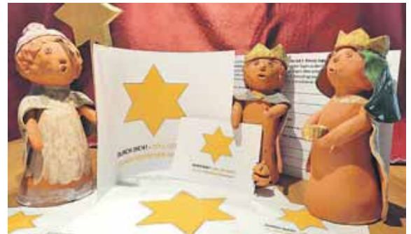
Kleine Tüten mit einem gebackenen Stern und einer Anmeldepostkarte wurden verteilt, um für die Sternsinger-Aktion zu werben.