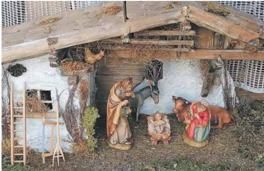
"... und Maria gebar ihren Sohn, den Erstgeborenen. Sie wickelte ihn in Windeln und legte ihn in eine Krippe, weil in der Herberge kein Platz für sie war«, heißt es bei Lukas. In der Skiwerkstätte Hörmann zeigt diese Krippe die Szene.