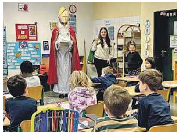
Der Nikolaus hat die ersten und zweiten Klassen der Kleinfeldschule besucht.

Zum Glück waren diese Bedenken unbegründet: Trotz der widrigen Witterungsverhältnisse traf der Nikolaus pünktlich in der Kleinfeldschule ein, wo er den aufgeregten Erst- und Zweitklässlern persönlich einen Besuch im Klassenzimmer abstattete. Er las den Kindern aus seinem goldenen Buch vor, was ihm seine Engelchen über die einzelnen Klassen aufgeschrieben hatten. Vor allem die Erstklässler erhielten viel Lob für all das, was sie in ihren ersten Schulwochen schon gelernt hatten. Ein paar Verbesserungsvorschläge gab es natürlich auch, aber die Kinder versprachen dem Nikolaus fest, diese bis zu seinem nächsten Besuch besonders zu beherzigen. Zum Abschied hatte der heilige Mann noch für jedes Kind eine liebevoll verpackte Gabe aus dem Nikolaussack.