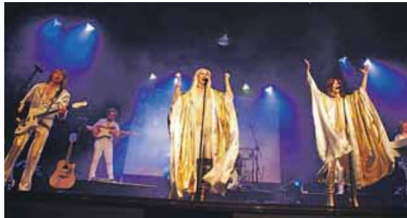
ABBA-Feeling: An Silvester darf man sich in der Stadthalle Germering auf ein ganz spezielles Déjà-vu und auf unvergessene Hits freuen.

Queen« über »Mamma Mia« bis »The Winner takes it all« zum Besten gegeben werden.