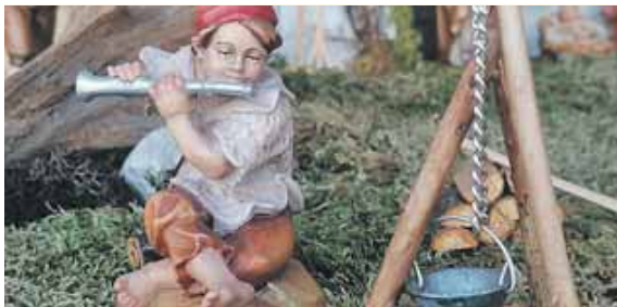
In der Skiwerkstätte Hörmann spielt dieser Junge Flöte, während die Suppe über dem offenen Feuer kocht.

Die Bilder auf diesen Seiten zeigen Krippen des Oberstädtler Krippenweges in Weilheim, zu dessen Besuch der Heimat- und Trachtenverein Weilheim einlädt. Bis zum 6. Januar sind die Krippen in den Fenstern auf beiden Seiten des Stadtbaches entlang der Oberen Stadt zwischen dem Vereinsheim und dem Rathaus sowie im Fenster des Stadtarchivs zu sehen.