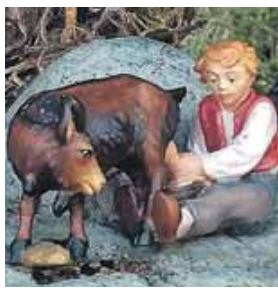
Bei Familie Stellwag wird eine Ziege gemolken. Vielleicht bekommt das Jesuskind gleich einen Schluck frische Milch? Schließlich hat nicht jeder Gold oder Weihrauch, die er dem Neugeborenen schenken kann.