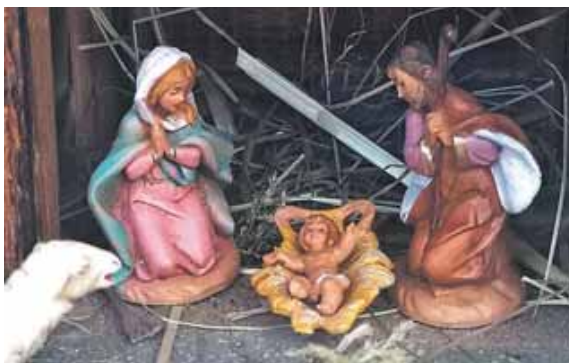
Bei Christel Obermeier begrüßt ein Lämmchen das Jesuskind.