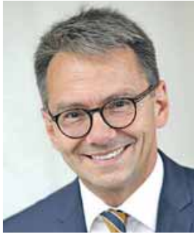
Landrat Thomas Karmasin.

Lassen Sie mich mit etwas Positivem anfangen: Im April wurde die Corona-Pandemie offiziell für beendet erklärt, nachdem uns das Virus mit all seinen Auswirkungen über drei Jahre in Atem gehalten und viele Menschen an ihre Grenzen gebracht hat. Auch wenn Corona nicht verschwunden ist, wie man jetzt wieder an den steigenden Krankheitsfällen und an Langzeitauswirkungen sieht, haben wir einen Weg gefunden, damit umzugehen. Der Mensch ist ein soziales Wesen. Wie wichtig der Kontakt