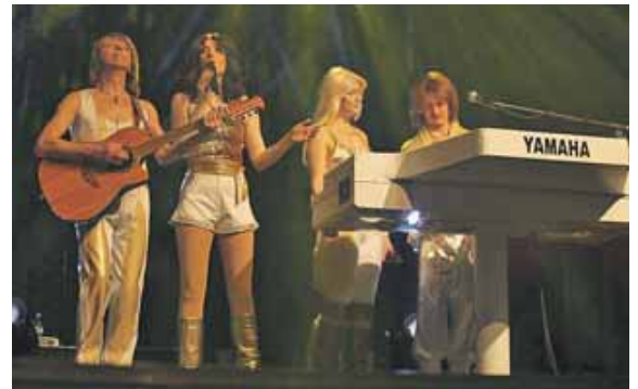
Kleidung, Stil und Instrumente: Die Show lässt ABBA (fast) Wirklichkeit werden.

An Silvester, 31. Dezember, um 19 Uhr ist The Björn Identity im Orlandosaal zu sehen. In der Stadthalle Germering (Landsberger Str. 39) kann sich das Publikum also auf einen schwungvollen Jahresausklang freuen, wenn die unvergessenen Hits und zeitlosen Klassiker von »Dancing