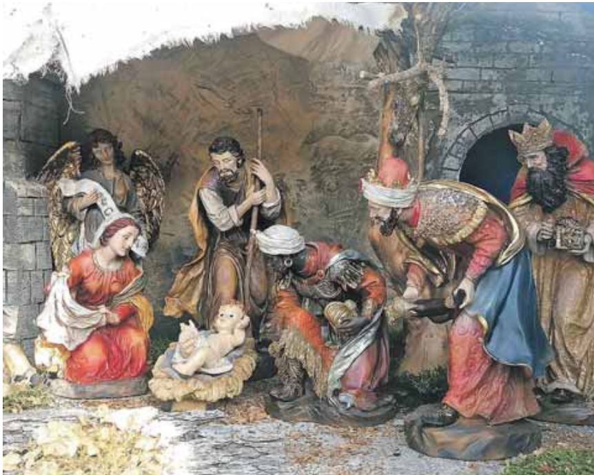
Bei Günter Maier sind bereits die Heiligen drei Könige an der Krippe angekommen. Bei Matthäus sind die drei Sterndeuter; sein Evangelium erzählt von ihnen so: »Der Stern, den sie hatten aufgehen sehen, zog vor ihnen her bis zu dem Ort, wo das Kind war; dort blieb er stehen. Als sie den Stern sahen, wurden sie von sehr großer Freude erfüllt. Sie gingen in das Haus und sahen das Kind und Maria, seine Mutter; da fielen sie nieder und huldigten ihm. Dann holten sie ihre Schätze hervor und brachten ihm Gold, Weihrauch und Myrrhe als Gaben dar.«