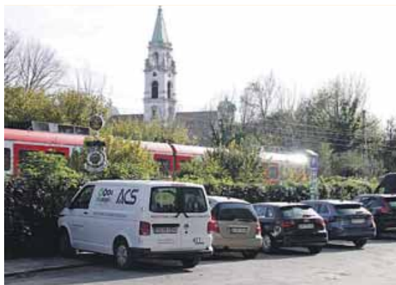
In der Martin-Beheim-Straße hat die Bahn in einer »Nacht- und Nebel-Aktion« (so Günter Keller) Parkautomaten aufgestellt.

Etwas weiter ist man damit im Bereich zwischen Bahnlinie, Mittlerem Ring und Fernpaßstraße: Dieses Gebiet soll nach langem Warten im Frühjahr 2023 endlich zum Parklizenzgebiet werden, kündigte Keller an.