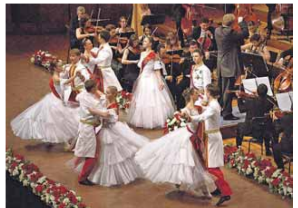
Der Kaiserwalzer

MÜNCHEN (red) · Sie ist zurück – die K&K »Wiener Johann Strauß Konzert-Gala!« Nach all den Wirren dieser Zeit sind die Operettenmelodien, Walzer, Polkas und Märsche der Strauß-Dynastie, gekrönt von einer gehörigen Portion Schlagobers, das perfekte Rezept, um frisches Lebensgefühl und Vitalität zu tanken. Im Herkulesaal der Residenz bietet sich am Samstag, 14. Januar, 19 Uhr, die Gelegenheit, Matthias Georg Kendlingers Exportschlager – das Original mit den K&K Philharmonikern und dem Österreichischen K&K Ballett – endlich wieder ausgelassen genießen zu können.