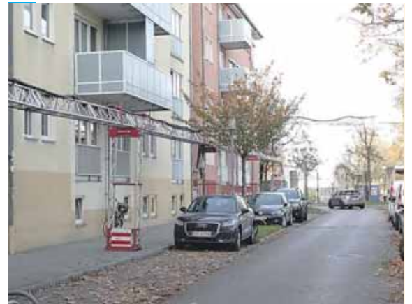
Die Lenggrieser Straße ist schmal und endet in einer 90 Grad-Kurve. Die Bürger wünschen sich hier eine Einbahnregelung – zumindest ab der Hälfte der Straße in südlicher Fahrtrichtung.

SENDLING (tab) · Eine große Mehrheit stimmte für einen Vorschlag in der Bürgerversammlung des 6. Stadtbezirks (Sendling). Es ging um eine Einbahnregelung. »Die Lenggrieser Straße ist relativ schmal. Hier kann nur ein Auto in eine Richtung fahren«, führte ein Bürger aus. Hinzu käme am Ende der