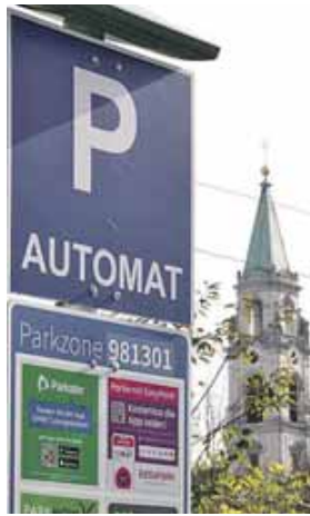
In der Martin-Beheim-Straße kostet Parken Geld.

SENDLING-WESTPARK (job) · Ein schmaler Streifen entlang der Bahn- und der Martin-Beheim-Straße gehört der Bahn. Die hat dort vor einem Jahr Parkautomaten aufgestellt und verlangt seither Geld für die Nutzung der Stellplätze. Die Anwohner sind damit alles andere als glücklich. Für die Anwohner hat sich durch die Maßnahme der Bahn der Parkdruck »unerträglich erhöht«, schilderte ein Bürger der Bürgerversammlung Sendling-Westpark die Folgen. Es sei für Anwohner unmöglich geworden, tagsüber einen Parkplatz zu finden, während