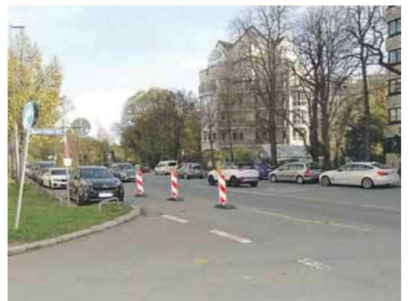
Eine neue Fußgängerampel an der Radlkofer-/Hans-Klein-Straße: Diesem Wunsch wurde in der Sendlinger Bürgerversammlung zugestimmt.

Bürgerversammlung des 6. Stadtbezirks (Sendling) hin und forderte aus diesem Grund eine Fußgängerampel an der Hans-Klein-Straße. Dem Vorschlag wurde zugestimmt.