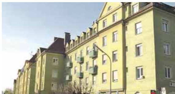
Die Wohnanlage an der Fall-/Ecke Zechstraße stammt aus dem Jahr 1911. Geht es nach den Bürgern, soll sie erhalten werden.

SENDLING (tab) · Gegen einen Teilabriss der Wohnanlage an der Fall-/Ecke Zechstraße im Jahr 2024 hat sich eine Bewohnerin in der Sendlinger Bürger-