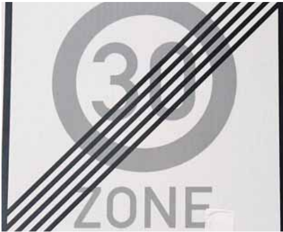
Zwischen Gilm- und Friedrich-List-Straße ist die Tempo-30-Zone auf 200 Meter unterbrochen.

Erstmals wurde Tempo 30 in der Ehrwalder Straße (zwischen Garmischer und Gilmstraße) 2016 auf Empfehlung der Bürger eingeführt. Nachdem der Bau des Tunnels am Mittleren Ring die Bedeutung der Ehrwalder Straße für den Durchgangsverkehr geschmälert hatte, war dies möglich geworden.