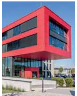
slimpuls ist im ersten Obergeschoß im working & living HOUSE

slimpuls Abnehmen mit Herz slimpuls Therapiezentrum Gilching • E.L. 5 Seen GmbH Dornierstr. 4 • 82205 Gilching • Gewerbegebiet Süd Kostenfreie Kundenparkplätze • Bushaltestelle direkt vor dem Haus Nicht bei krankhafter Fettsucht. Für eine langfristige Gewichtsreduktion bedarf es der dauerhaften Einhaltung der im Programm vermittelten Ernährungsregeln.