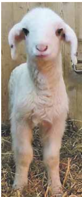
Eins der neun Lämmchen.

Der Tierschutzverein München e.V. versorgt rund 8.000 Haustiere und heimische Wildtiere jährlich.