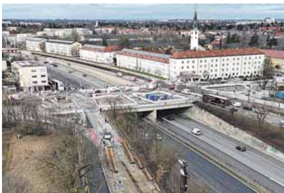
Blick auf die Brücke, auf der die Fürstenrieder Straße die A 96 quert. Im Vordergrund die Baustelleneinrichtung für den »Bypass«; links daneben das Gelände der früheren Landesgehörlosenschule. Der Kirchturm hinten rechts ist der von Namen Jesu.