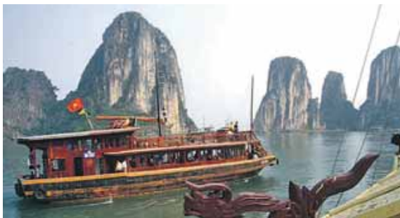
Bild einer Dschunke in der malerischen Halong-Bucht, die im Norden Vietnams liegt.

ISMANING (red) · Die Multivisions-Show »Vietnam – Der aufgehende Stern Südostasiens« wird am Dienstag, 30. April, um 19.00 Uhr in Ismaning in der VHS, Mühlenstr. 15, Kleiner Saal gezeigt. Die Multivisions-Show stammt von dem Reisejournalisten und Weltentbummler Harald Mielke. Von Corona nur kurz gebremst entwickelt sich kein Land Indochinas so rasant wie Vietnam, das Land zwischen Rotem Fluss und Mekong. Der »Tiger« hat zum Sprung angesetzt in eine wirtschaftlich noch erfolgreichere Zukunft.