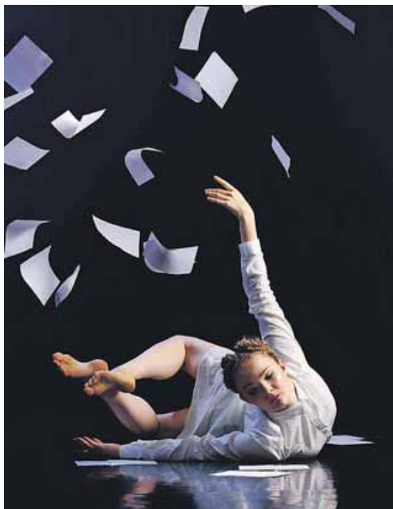
Die Tanzkomödie »Images fantastiques« platziert den Karneval der Tiere in einem Großraumbüro.

Am 8. Mai können die Besucherinnen und Besucher dann ein modernes Ballett für die ganze Familie erleben: »Images fantastiques« präsentiert eine einzigartige Tanzkomödie, die den Karneval der Tiere in einem Großraumbüro zum Leben erweckt. Als Tanzminiatur zeigt die Dance Company zudem Clair de Lune von Debussy und Beethovens Sinfonie Nr. 6 F-Dur Pastorale als ein hingebungsvolles Tanz-Bekenntnis an die Lebensfreude. Erleben Sie die kreative Fusion von Musik und Tanz in einer unvergesslichen Aufführung! Diese und viele weitere Veranstaltungen des Forum Unterschleißheim finden Sie unter www.forum-unterschleissheim.de Tickets gibt's online unter: www.muenchenticket.de , per E-Mail unter ticketshop@ush.bayern.de oder per Telefon 089/3109-200