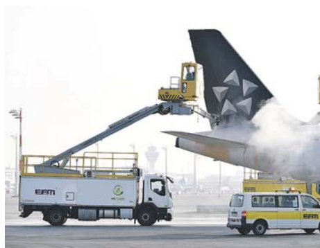
E-Mobility auf dem Vormarsch am Flughafen: Elektrischer »Elefant« enteist Flugzeuge.

werden, ohne dass nachgeladen werden müsste. Zu den Enteistungsfahrzeugen fährt das Fahrzeug noch mit konventionellem Dieselmotor und ist damit flexibel einsetzbar. Am Einsatzort selbst aber wird der Motor abgestellt, und die vollelektrische Enteistung beginnt. Elefanten wird bekanntlich große Ausdauer und ein besonderes Feingefühl nachgesagt: Keine schlechten Voraussetzungen für den Elephant e-BETA,