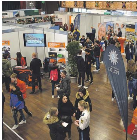
Dieses Jahr findet der Moosburger Karrieretag online statt, es ist aber genauso viel geboten wie sonst.

Mit einem ansprechenden Firmenprofil werden die Betriebe sich als Arbeitgeber vorstellen sowie über die verfügbaren Stellenangebote informieren. Die interessierten Bewerber können am 19. März von 9 bis 16 Uhr über ein Kontaktformular, direkt per E-Mail oder Whatsapp sowie telefonisch mit den direkten Ansprechpartnern in Kontakt treten. Alle Inhalte bleiben bis zum 04. April auf der Website online und natürlich ist auch in diesem Zeitraum die Kontaktaufnahme mit den jeweils zuständigen Ansprechpartnern weiterhin möglich. Nicht nur Schüler, die auf der Suche nach einem Ausbildungsberuf, Praktikumsplatz oder dualem Studium sind, werden hier fündig. Auch für Fachpersonal werden diverse Stellen angeboten. Das Spektrum der verschiedenen Branchen ist groß und vorgestellt werden eine Vielzahl an unterschiedlichen Berufen. Neben Moosburger Betrieben sind Firmen aus dem Umland auf dem digitalen Karrieretag vertreten. Somit macht es die Moosburg Marketing eG allen Jobsuchenden auch während der aktuellen Corona-Situation möglich, die Arbeitgeber vor Ort direkt kennenzulernen.