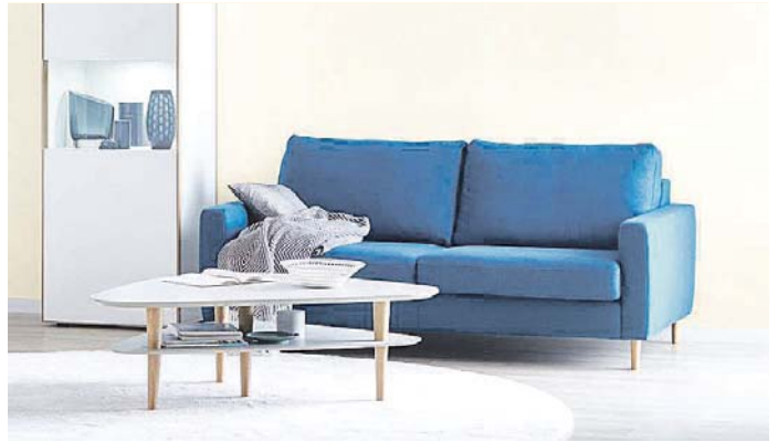
Vor einem Umzug heißt es Altes entsorgen und die guten Stücke ordentlich für den Transport vorbereiten.

Damit am Umzugstag selbst nicht Panik und Stress ausbrechen, sollte man rechtzeitig mit dem Packen beginnen. Nicht unwichtig: Berechnen Sie vorab schon einmal das ungefähre Umzugsvolumen (dafür gibt es im Internet sogar Vorlagen), damit Sie die Anzahl der benötigten Kartons, die Größe des Transportmittels und den Zeitaufwand für die Umzugshelfer einschätzen können. Sobald bekannt ist, dass ein Umzug vor der Tür steht, sollten Sie außerdem beginnen, geeignete Verpackungsmaterialien zu sammeln - das können neben alten Zeitschriften zum Beispiel Plastikfolien oder Styroporplatten von Online-Bestellungen sein, die Sie dann beim Einpacken für zerbrechliche Gegenstände wie Geschirr oder Lampen verwenden können. Klar, dass es jetzt auch heißt sinnvoll auszusortieren. Im Durchschnitt besitzt jeder Deutsche rund 10.000 Gegenstände, daher sollte man sich im Vorfeld fragen, ob Sie diese Dinge wirklich alle noch benötigen bzw. wie man sinnvoll recycelt. Was nicht mit soll also vorher verkaufen, verschenken oder sinnvoll entsorgen. Diese Gegenstände müssen dann gar nicht erst für den Umzug eingeplant werden. Das spart nicht nur Zeit beim Ein- und Auspacken, sondern auch