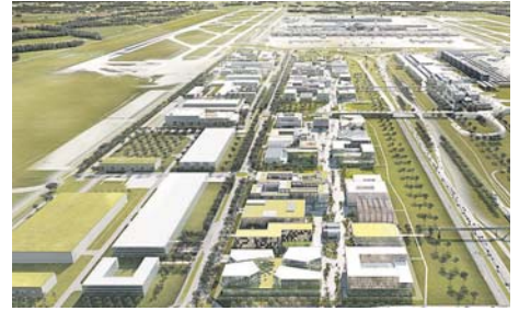
Das große Areal am Flughafen bietet viele Entwicklungsmöglichkeiten für Unternehmen.