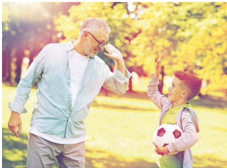
Um fit genug fürs Fußballspielen mit dem Enkelkind zu sein, braucht der Körper genug Nährstoffe.

Bei einem Mangel an Vitamin D besteht die Gefahr, dass die Knochen zu weich werden und es zur Erkrankung Osteoporose kommt. Ältere Menschen sollten da-