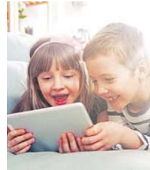
Kinder werden im Internet zu Werbungsoffern.

Das ist das Ergebnis einer Studie der Universität Hamburg – noch vor der Corona-Krise! Ein Bündnis aus Wissenschaftlern, Kinderärzten und dem AOK-Bundesverband erneuert angesichts dieser Zahlen die Forderung – wie es in vielen Ländern bereits Standard ist. Bitte Gas geben, liebe Politiker!