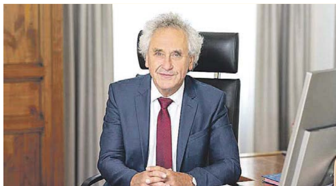
Freising's Landrat Helmut Petz.

Landrat Petz begrüßt Einsatz der Mediziner im Kampf gegen das Corona-Virus