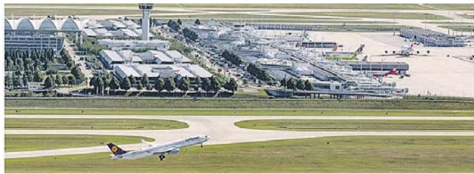
Wer zum Flughafen will, muss sich auf Umwege einstellen.

Flughafen · Aufgrund einer aufwendigen Gradienten-Anpassung ist noch bis einschließlich 28. März der Südring am Flughafen München gesperrt.