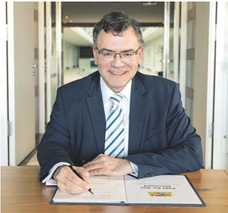
Staatskanzleichef Dr. Florian Herrmann weist auf die Wichtigkeit des Ehrenamts hin und zollt allen Aktiven größten Respekt.