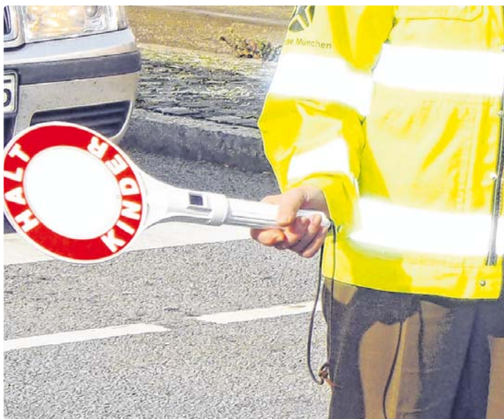
Der Bezirksausschuss Sending-Westpark sucht dringend einen Schulweghelfer.

Infoflyer für Interessierte liegt im Sekretariat der Plinganserschule (Plinganserstr. 28) aus.