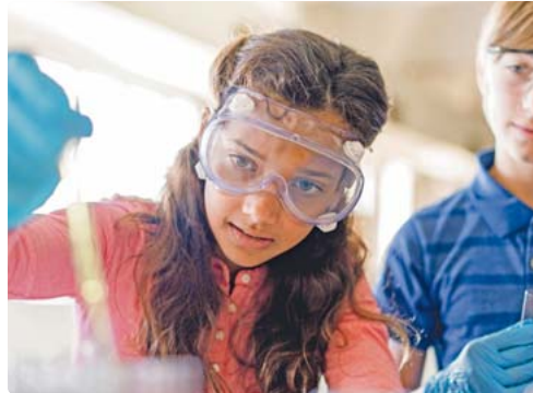
Geht Deutschland der wissenschaftliche Nachwuchs aus? Laut einer Studie planen nur acht Prozent der 18- bis 39-Jährigen eine Karriere in MINT-Berufen.

Womöglich haben Vorbehalte gegenüber MINT-Berufen mit überkommenen Vorurteilen zu tun. Der Nerd, der einsam im Elfenbeinturm forscht, hat mit der Realität wenig gemeinsam. „Forscher arbeiten heute häufig in internationalen Teams zusammen. Kommunikation ist ein wesentlicher Faktor, um voranzukom-