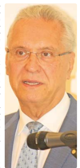
Innenminister Joachim Herrmann: „Statistisch gesicherte Daten sind eine wichtige Entscheidungsgrundlage für die Politik. Und sie sind hoffentlich auch ein Mittel gegen Ignoranz und Fake News.“

19 zu sterben, deutlich größer ist als bei Jüngeren“, erklärte Herrmann. Weise die Statistik bei den unter 60-Jährigen noch keine Auffälligkeiten auf, sei die erhöhte Sterblichkeit bei Menschen zwischen 60 und 79 Jahren deutlich: „Sowohl im April 2020, als auch Ende 2020 / Anfang 2021 überstieg die Zahl der Todesfälle den Schnitt der vergangenen Jahre signifikant“, stellte Herrmann fest.