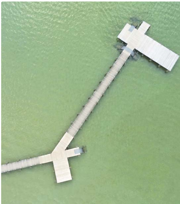
Steg am Starnberger See.