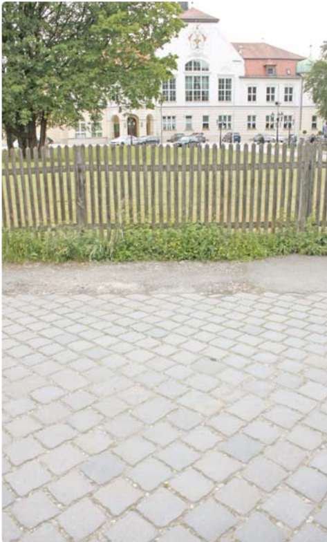
Das Pflaster an der Einfahrt zum Schützengarten gefällt nicht jedem.

Obersendling · Die ersten 40 Meter der Zielstattstraße – zwischen Bahnanlagen und Schützengarten – sind mit großen Steinen gepflastert. Manche Passanten haben damit Probleme, z.B. wenn sie auf einen Rollator angewiesen sind. Andere finden das Pflaster lästig, Eltern mit Kinderwägen und Fahrradfahrer mit Kindern. Ein Bürger bat daher den Bezirksausschuss Sendling-Westpark um Prüfung, ob man das Pflaster nicht durch Asphalt ersetzen können. Genau dort, wo der kleine Pflaster-Abschnitt beginnt, ist auch die Grenze zwischen den beiden Vierteln Sendling-Westpark und Obersendling. Der Bezirksausschuss Sendling-Westpark gab daher das Bürgeranliegen an seinen Nachbar, den Bezirksausschuss im Münchner Süden weiter. Dieser bat jetzt die Stadt um Prüfung des Asphalt-Wunsches. job