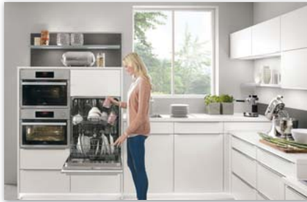
Küchenarbeit ohne krummen Rücken: Eine ergonomische Einrichtung des Zuhauses hat großen Anteil am seniorengerechten Wohnen.

Frühzeitig an eine barrierefreie Einrichtung und ergonomische Möblierung denken