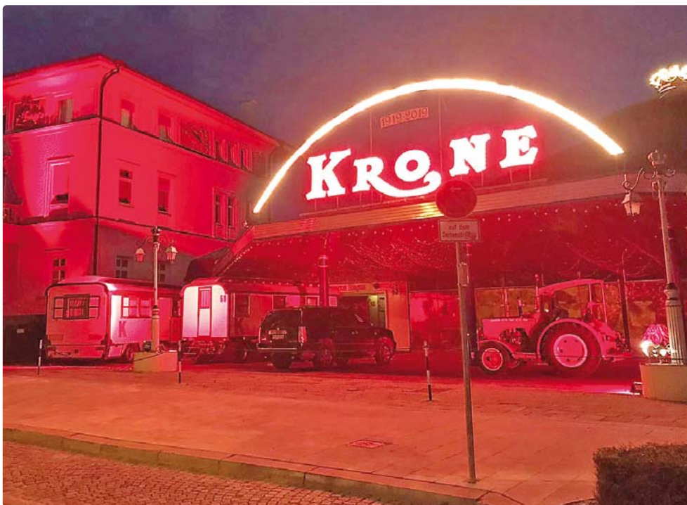
Circus Krone - ganz in alarmierendem Rot.