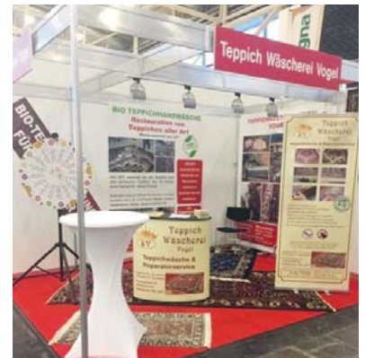
Am Puls der Zeit: Teppichwäscherei Vogel bei der Internationalen Handwerksmesse in München.