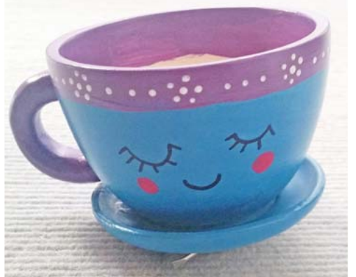
In der Kreativ-Werkstatt entstehen unter anderem Tassen wie diese.

Programm endlich wieder gestartet. Durch die aktuelle Situation können zwar keine Koch- und Backaktionen stattfinden wie bisher, dennoch bietet das Team vom Tatz verschiedene Bastelaktionen und Spielnachmittage an. Das Motto lautet: „Lasst euch überraschen!“ Von Beutel bemalen, Stempel selber machen, Malen auf Leinwand und viele andere kunterbunte Angebote ist jede Menge dabei. Die Öffnungszeiten des Feuerwerk Tatz sind (außerhalb der Schulferien): Für Kinder von 6 bis 11 Jahren immer Mittwoch bis Freitag von 14.30 bis 17 Uhr und Samstag von 14 bis 16.30 Uhr, und für die Jugendlichen von 12 bis 16 Jahren immer Mittwoch bis Freitag von 17 bis 19.30 Uhr und Samstag von 16.30 bis 19 Uhr. Normalerweise ist das Tatz ein offener Treff – coronabedingt ist jetzt auch hier durch die begrenzte Teilnehmerzahl eine Anmeldung unter Tel. (089) 51262863 oder per Mail an tatz@feuerwerk.de erforderlich. Das Tatz-Team freut sich darauf, endlich wieder Kinder und Jugendliche vor Ort begrüßen zu dürfen! Alle Infos gibt es auf tatz.feuerwerk.de im Internet. tab