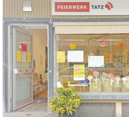
Auch der Kinder- und Jugendtreff Feuerwerk Tatz hat seine Pforten wieder geöffnet.

Auch der Kinder- und Jugendtreff Feuerwerk Tatz hat sein