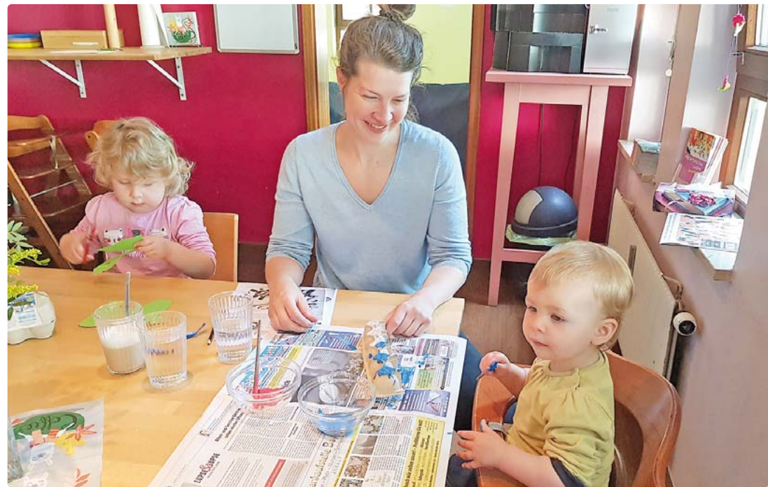
Viele Ideen für kleine Künstler gab es beim Mütterzentrum.

Einzelne Angebote im Mütterzentrum Sendling wieder möglich