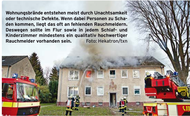
Wohnungsbrände entstehen meist durch Unachtsamkeit oder technische Defekte. Wenn dabei Personen zu Schaden kommen, liegt das oft an fehlenden Rauchmeldern. Deswegen sollte im Flur sowie in jedem Schlaf- und Kinderzimmer mindestens ein qualitativ hochwertiger Rauchmelder vorhanden sein.