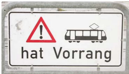
Um Platz für die Tangente zu bekommen, ist eine Verlegung der Fahrspuren für den motorisierten Individualverkehr notwendig.

rieder/Agnes-Bernauer-Straße sowie an der Kreuzung Fürstenrieder-/Ammerseestraße vorgesehen. Die Gesamtstrecke umfasst auf rund 8,4 km 17 Haltestellen. Diese können – aufgrund der großen Nutzlänge – mit bis zu fünfteiligen Straßenbahnfahrzeugen bedient werden. red