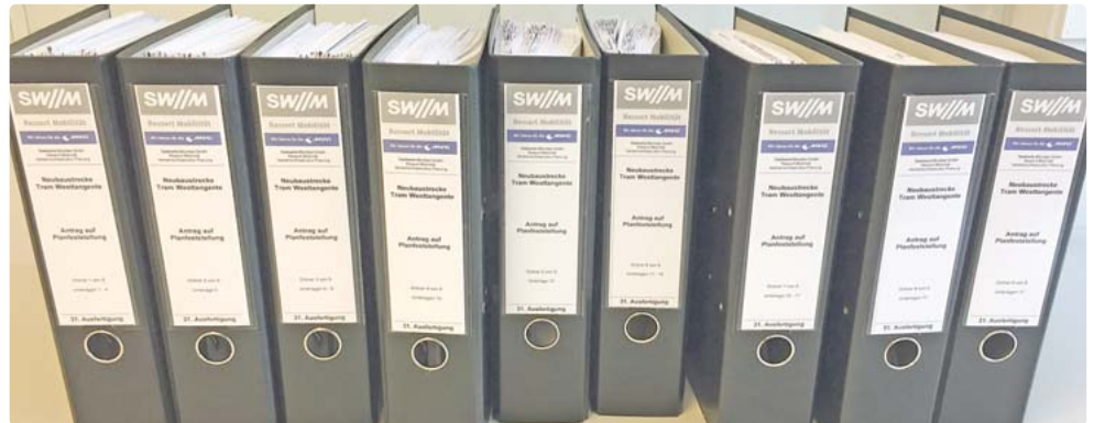
In diesen Ordnern befinden sich alle einsehbaren Unterlagen zum Planfeststellungsverfahren der Tram-Westtangente.

jekt schriftlich oder zur Niederschrift erhoben werden. Anerkannte Natur- und Umweltschutzverbände sowie anerkannte Verbände nach dem Behindertengleichstellungsgesetz können innerhalb derselben Frist bei den beiden Behörden Stellungnahmen zu dem Plan abgeben. Zur Aufnahme der Niederschrift ist vorab telefonisch ein Termin zu vereinbaren. Dies ist möglich bei: Landeshauptstadt unter (089) 23324467 (Montag bis Donnerstag von 8 bis 12 Uhr und von 14 bis 16 Uhr, Freitag von 8 bis 12 Uhr) oder der Regierung von Oberbayern unter (089) 21762152 (Montag bis Donnerstag von 8 bis 12 Uhr und von 14 bis 16 Uhr, Freitag von 8 bis 12 Uhr). Einwendungen in elektronischer Form, zum Beispiel durch Mail, sind unzulässig. tab