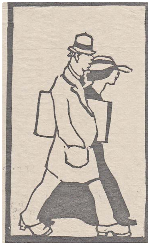
Auf dem Holzschnitt auf Seidenjapanpapier sieht man das Künstlerpaar. Holzschnitt Conny Meissen