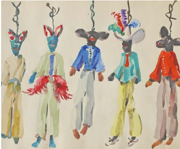
Das Bild „Puppen I“ stammt aus dem Skizzenbuch von Conny Meissen. Aquarell Conny Meissen