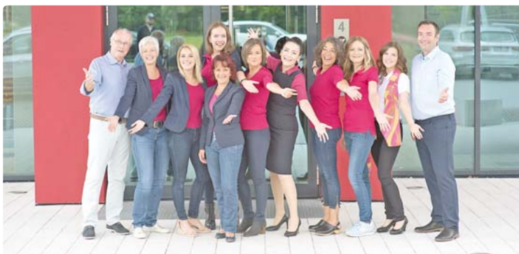
Das Team von slimpuls freut sich auf viele Interessierte am Infotag.

Neben den deutlich sichtbaren „Corona-Röllchen“ kann zusätzlich eine unsichtbare Gefahr in uns schlummern: das innere Bauchfett, auch viszerales Fett genannt. Wenn der Anteil an Bauchfett zu hoch ist, steigt das Risiko für Diabetes, Bluthochdruck, Schlaganfall, Herzinfarkt, Alzheimer und Krebs. Das betrifft nicht nur offensichtlich