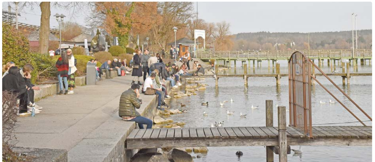
Die Seepromenade ist ein beliebter Treffpunkt. Hier darf man aber nur noch einen Dämmereschoppen zu sich nehmen. Ab 22 Uhr ist Alkohol verboten.

geschlossen hatten, wurde das Wetter schlecht und dann kam der Herbst“, so Janik. Er plädierte dafür, die Verordnung zu lassen und am Ende der Sommersaison ein Fazit zu ziehen. Dafür fand sich am Ende auch eine Mehrheit im Stadtrat. Nur um Haaresbreite wurde indes das Mitführ-Verbot bestätigt. ha