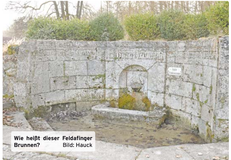
Wie heißt dieser Feldafinger Brunnen?

Feldafing · Tagtäglich gehen wir in unserem Ort an Sehenswürdigkeiten vorbei, großen und kleinen, bekannten und unbekannt, offenen und versteckten. In unserer Serie „Wie gut kennen Sie Ihre Heimat?“ zeigen wir Ihnen jede Woche ein Stück Ihrer Gemeinde und fragen Sie: Kennen Sie das und wo ist es zu finden?