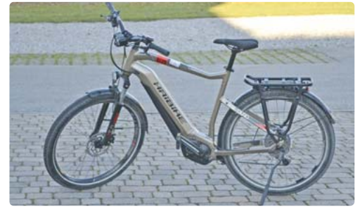
Das ist das Fahrrad, das ich inzwischen wiederbekommen habe.

Traurig und frustriert kaufte ich mir, nachdem ich die Hoffnung, es wiederzubekommen aufgegeben hatte, das gleiche Fahrrad mit Mühe noch einmal (Fahrräder waren inzwischen Mangelware geworden). Im Oktober nun rief mich die Polizei an und informierte mich darüber, dass man die bösen Buben erwischt habe und mein Fahrrad vollkommen unversehrt