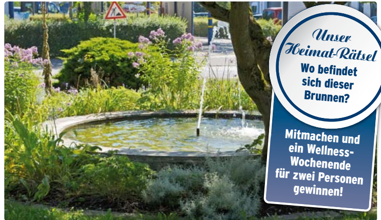
Wo in Weilheim steht dieser Brunnen?

Wir freuen uns, wenn Sie uns dann Ihre Rückmeldung zukommen lassen und lösen das Rätsel im Rahmen des