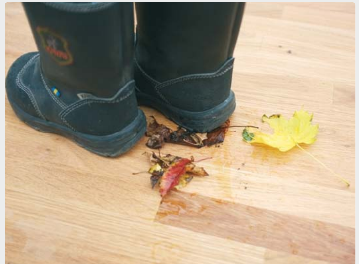
Die kalte Jahreszeit bringt Feuchtigkeit und Schmutz ins Haus. Damit Holzfußböden dadurch nicht geschädigt werden, ist die richtige Pflege jetzt besonders wichtig.

Der Holzfußboden gilt als Inbegriff für gemütliches Wohnen und zeichnet sich durch seine beeindruckend lange Lebensdauer aus. Allerdings möchte das natürliche Material auch gepflegt werden - vor allem in der kalten Jahreszeit, wenn feuchter Schmutz von draußen ins Haus gelangt. Hier einige Tipps: Damit Matsch und Feuchtigkeit draußen bleiben, am besten zwei Fußmatten verwenden - eine für größeren Schmutz draußen vor der Eingangstür und innen eine zweite, die Nässe und kleine Partikel von den Schuhsohlen entfernt. Um den Holzfußboden zu schonen und vor Kratzern zu schützen, sollte er generell nicht mit Straßenschuhen betreten werden. Im Eingangsbereich häufiger staubsaugen. Verschmutzungen am besten immer gleich wegwischen, dabei aber möglichst wenig Wasser benutzen, da Holzfußböden auf zu viel Feuchtigkeit empfindlich reagieren. Empfehlenswert ist der Spray Mop von Bona, der speziell für die schonende Pflege von Holzböden entwickelt wurde und ohne Wasser sofort einsatzbereit ist. Haben sich bereits Mikrokratzer auf dem Holz gebildet, lassen diese sich nach dem Reinigen mit einem Parkett Polish beseitigen. Bei geöltem Holzboden hilft ein sogenannter Öl-Refresher. Bei tieferen Kratzern empfiehlt sich der Kontakt zu einem von Bona empfohlenen Handwerker, der den Boden abschleift und ihm damit zu neuem Glanz verhilft. Weitere Informationen zur Pflege von Holzfußböden gibt es online unter www.bona.de .