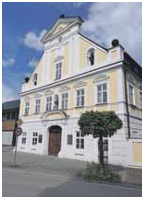
Das Rivera Palais ist ein Wohnhaus aus dem Jahr 1712.

legen, sind doch zahlreiche Gewerbetreibende an der Straße angesiedelt. Von Restaurants, Tankstellen, Ladengeschäften über Studios, Agenturen bis zu Arztpraxen findet sich in dieser lebendigen Straße fast alles was man für den Alltag braucht. Die Ladenbetreiber sind stolz auf ihre Geschäfte an dieser geschichtsträchtigen und belebten Verbindungsstraße.