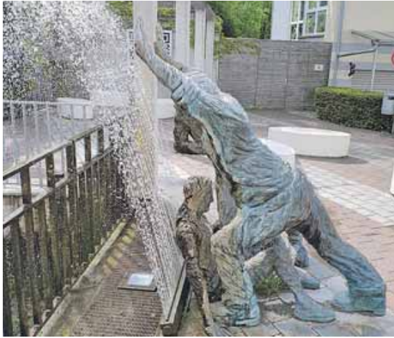
Ein Wahrzeichen der Straße ist der Turmschieberbrunnen.

Für Besucher lohnt es sich allemal auf der Straße zu flanieren, zu radeln oder einen kurzen Stopp mit dem Auto einzu-