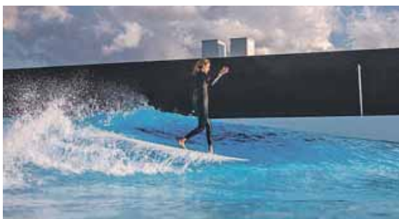
Einzigartige Momente auf den Wellen erleben.

HALLBERGMOOS (red) · Türkisblaues Wasser, wie auf Hawaii. Wellen, die sich per Knopfdruck an dein Surf-Level anpassen. Adrenalin, Sonne, Fortschritt. Und das alles direkt vor den Toren Münchens: In der O2 Surftown beginnt ab sofort die Bewerbungsphase für ein ganz besonderes Erlebnis. Sechs Menschen können ein Surf-Stipendium im Wert von jeweils 1.600 Euro gewinnen – inklusive zehn individueller Surf-Sessions. Die Stipendien bieten nicht nur ein intensives Surf-Coaching, sondern eröffnen den Zugang zu einem weltweit einzigartigen Hightech-Wellenbecken mit individuell einstellbaren Wellen. »Wir wollen mit dem Stipendium zeigen, dass Surfen bei uns für alle da ist – nicht nur für Profis. Auch Anfänger, Kids, Rentner oder Quereinsteiger können in der O2 Surftown lernen, wie sich Wellen-