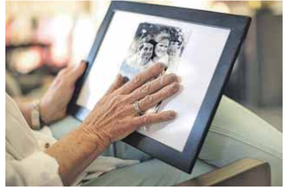
Über einen geliebten Menschen möchte jeder auf seine eigene Art trauern.

Zur ganz persönlichen Trauerbewältigung gehören inzwischen viele alternative Wege, um den Verlust eines geliebten Menschen zu verarbeiten. Mit Erinnerungsdiamanten besteht heute sogar die Möglichkeit, den Verstorbenen oder die Verstorbene über den Tod hinaus nicht nur im Herzen, sondern auch physisch bei sich zu tragen.