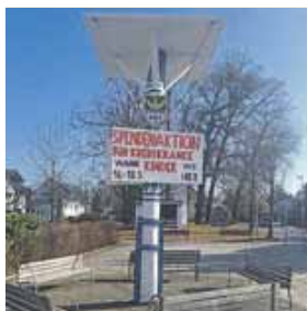
Eine tolle Aktion von der Jungbauernschaft Altenerding.

Die Idee hinter dem Pfahlsitzen ist es, die Herausforderungen und Einschränkungen, denen krebskranke Kinder gegenüberstehen, sichtbar zu ma-