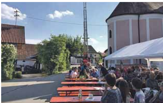
Die Drehleiter auf dem Bild stammte von der Feuerwehr Taufkirchen.

Das traditionelle Floriansfest in Grünbach