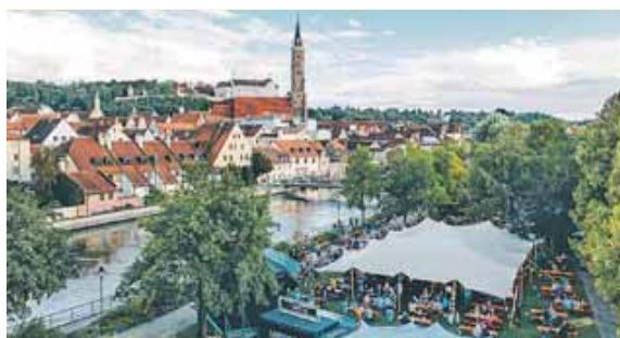
Am 18. Mai wird es bunt und voll kultureller Vielfalt in Landshut.

Auf verschiedenen Bühnen, vor der Stadtresidenz, am Ländtor, an der Martinskirche und in der Neustadt, erwartet