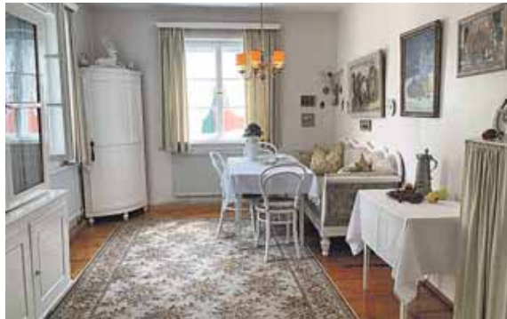
Im Franz Xaver Stahl Museum sind viele Räume noch im Originalzustand.

- Museum Franz Xaver Stahl Kunst trifft Geschichte: Im ehemaligen Wohnhaus des