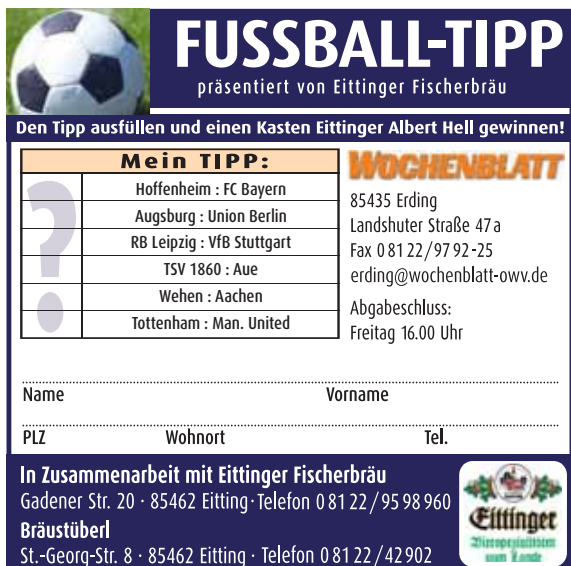
Bild der Woche