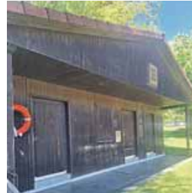
Im Wasserwacht Häuschen fand vergangenes Wochenende ein stiller Abschied statt.

Wenn es nicht gelingt, Ehrenamt und Gemeinschaftssinn neu zu denken, wird aus dem kleinen Paradies in Langenpreising bald ein leerer Fleck, was sehr schade für die Gemeinde wäre.