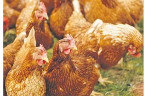
Die Geflügelpest oder auch hochpathogene Aviäre Influenza (HPAI) breitet sich in Europa und Deutschland immer weiter aus.

nen aus dem Landkreis Freising, die im besagten Zeitraum Geflügel bei einem mobilen Geflügelhändler erstanden haben, sollen daher umgehend das Veterinäramt Freising unter der Telefonnummer 0 8161/6 00-123 kontaktieren.