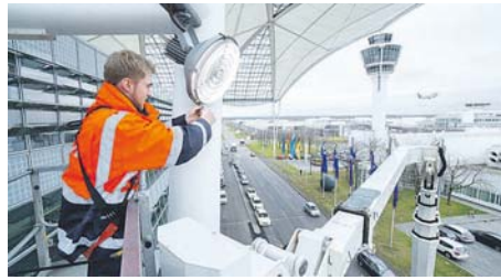
Der Airport bleibt trotz Krise ein Top-Ausbildungsbetrieb.

det Nachwuchskräfte in insgesamt elf Berufen und dualen Studiengängen aus. Die Ermittlung der besten Ausbildungsbetriebe erfolgte mittels einer umfangreichen Datenanalyse durch das unabhängige Institut für Management und Wirtschaftsforschung IWWF. Beim sogenannten »Social Listening« wurden im Kalenderjahr 2020 rund 300.000 Suchbegriffe und Texte in re-