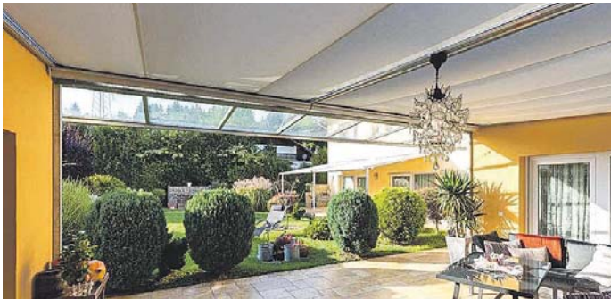
Unterglasmarkisen sind dank unterschiedlicher Montagelösungen recht einfach an der Decke zu montieren.

Wo&Wo Sonnenlichtdesign frei stehende, angelehnte oder gekoppelte Markisen bis auf den Millimeter passgenau. Auf diese Weise können auch in Eigenregie gebaute Pergolen sicher überspannt werden. Für eine optimale Lösung wendet man sich am besten an einen Fachhändler und lässt sich vor Ort beraten. Die per Funkmotor oder smarter Steuerung betriebene Gegenzuganlage kann Flächen bis zu einem Ausfall von sieben Metern und einer Breite bis zu sechs Metern beschatten. Wer sichergehen will, dass das Markisentuch auch bei leichtem Wind auf Spannung bleibt, sollte zusätzlich ein Reißverschluss-Stoffführungssystem (Ziprail) einbauen lassen. Auf Wunsch sorgt eine integrierte LED-Lichtleiste für stimmungsvolle Beleuchtung am Abend.