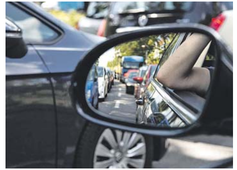
Auch in Zeiten von Lockdown und Homeoffice bleibt die Zahl derer, die zur Arbeit weite Strecken zurücklegen, auf hohem Level

Nach Angaben der Arbeitsagentur verließen 2020 bundesweit vier von zehn sozialversicherungspflichtig Beschäftigten auf dem Weg zur Arbeit die Grenzen ihrer Stadt oder ihres Landkreises. Damit erreichte die Zahl der Fern-Pendler trotz Pandemie einen Höchststand von 13 Millionen.