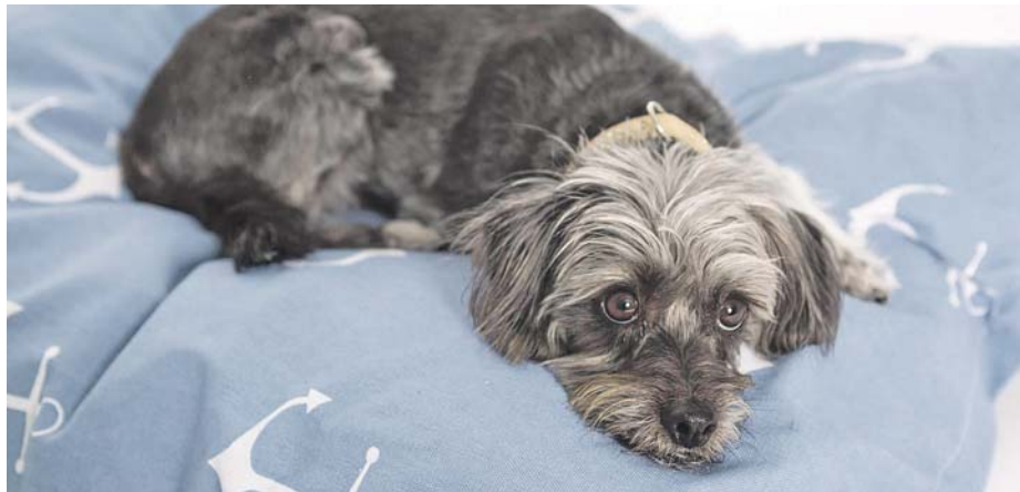
Hunde brauchen einen ungestörten Ruheplatz.

In 20 Prozent der deutschen Haushalte lebt inzwischen ein Hund. Im vergangenen Jahr wurden sogar deutlich mehr Hunde angeschafft als in den Jahren zuvor. Die treuen Vierbeiner sind bekanntlich die besten Freunde des Menschen und passen sich sehr geschickt an das Leben und die Alltagsgewohnheiten ihrer Herrchen und Frauchen an – in Singlehaushalten ebenso wie in kunterbunten Familien. Das ist gut, möchte man meinen, doch bei so manchem Hund kommt dabei der Schlaf zu kurz. Viele der gewohnten Hobbys und Freizeitbeschäftigungen von Erwachsenen und Kindern sind seit Beginn der Pandemie weggefallen oder können nur eingeschränkt ausgeübt werden.