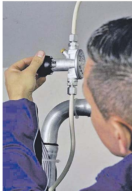
Bei einer Tankreinigung werden alle relevanten Bauteile des Tanks überprüft und korrekt eingestellt, wie hier das sogenannte Antihebeventil.

Bei dieser Gelegenheit kann der Experte, der die Reinigung vornimmt, den Tank auch gleich begutachten und bei Bedarf instand setzen. »Ein guter Zeitpunkt dafür ist stets dann, wenn nicht mehr