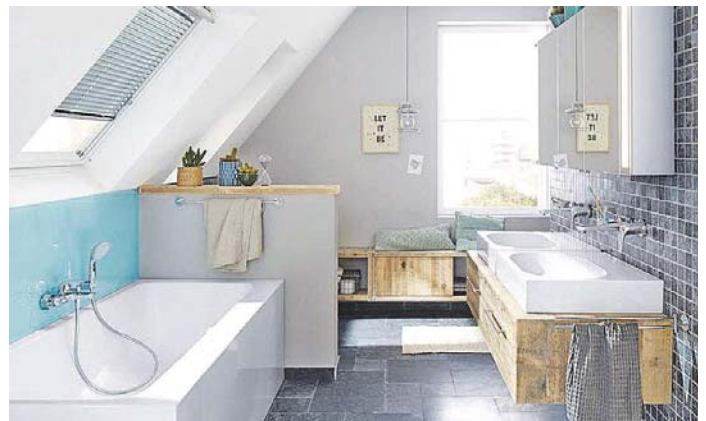
Neuer Glanz für ältere Bäder: Mit frischen Farben und einem anderen Wandbelag erhält der Raum im Handumdrehen einen modernen Look. Foto: djd/Knauf Bauprodukte

das Material in vielen Baumärkten. Nach dem Auftragen muss die Wand nur noch trocknen, schon ist alter Putz wieder glatt und kann ganz nach eigenen Wünschen in der Liebingsoptik tapeziert, gestrichen oder neu verputzt werden. Ein Tipp dazu: Heimwerker können sogar vorhandene Fliesen mit dem Flächenspachtel überziehen und sich damit das mühsame und schmutzintensive Abklopfen ersparen. Stattdessen verwandelt sich der alte Wandbelag in eine fugenlose, verputzte Oberfläche – und der schnellen Verwandlung in ein modernes Wohlfühlbad steht nichts mehr im Wege. (djd)