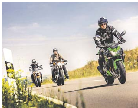
Vor dem Start in die Motorrad-Saison sollte eine sorgfältige Vorbereitung stattfinden.

Wenn im Frühjahr die ersten sonnigen Tage angesagt sind, werden gerne die Motorräder aus den Garagen geholt. Wer sicher unterwegs sein will, sollte gerade zum Saisonstart einiges beachten. Hier kommen die wichtigsten Tipps von den Experten der DEKRA Unfallforschung.