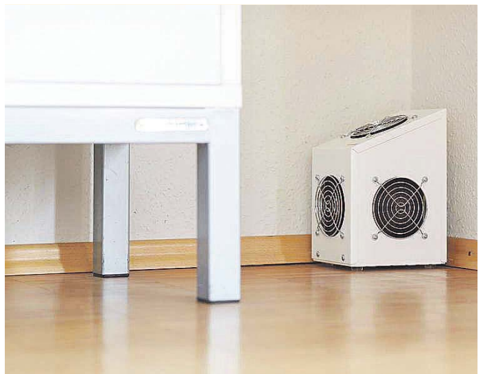
Für Nischen im Haus, an denen sich oft Feuchtigkeit ansammeln kann, gibt es spezielle Lüftungsgeräte.

Lückemeier Bauabdichtungs GmbH Regionalbüro München Unsöldstr. 2 • 80538 München www.bkm-chiemgau.de info@bkm-chiemgau.de