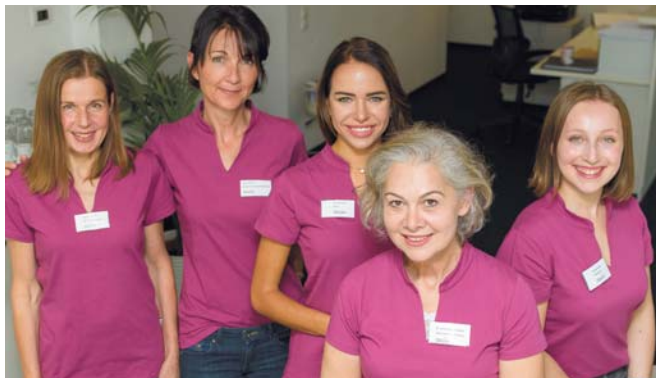
Team Easylife in München Ost

Hungern ist keine Lösung. Unsere intensive individuelle Betreuung, die Analyse Ihres Stoffwechsels und ein professioneller Umgang mit Lebensmitteln und Ernährung – spielen im Abnehmkonzept bei easylife eine große Rolle. Mit dem easylife Erfolg entwickeln Sie ein positives Lebensgefühl, bekommen neue Energie, ein gutes Aussehen und sind stolz auf das, was Sie erreicht haben.