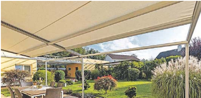
Überspannte Pergolen beschatten große Flächen.

Die Überdachung der Pergola schützt freilich vor Wind und Regen. Eine Markise sorgt zudem je nach Sonnenstand und -intensität für wohlthuenden Schatten. Die Auswahl an Markisenstoffen und Designs ist mannigfaltig. So fertigt zum Beispiel die Firma