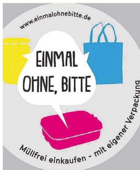
In Betrieben mit diesem Sticker bemüht man sich um die Vermeidung von Verpackungsmüll. F.: »Einmal ohne bitte«

Die Agenda-Gruppe hofft, dass es durch diese Veranstaltung gelingt, praktikable Maßnahmen zur Reduzierung von Einweg-Verpackungen in Stadt und Landkreis Freising anzustoßen und die entsprechenden Partner zusammen zu bringen.