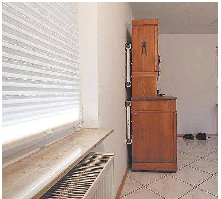
Hinter Schränken, insbesondere an Außenwänden, sammelt sich oft Feuchtigkeit. Ein Minilüfter kann dies verhindern.

Wie wichtig regelmäßiges Lüften für ein gesundes Raumklima ist, dürfte den meisten bekannt sein. Besonders empfohlen wird das sogenannte Querlüften: Mindestens zwei Fenster weit öffnen, die Zimmertüren geöffnet halten – so kann die Frischluft von außen die Wohnung oder das Haus buchstäblich durchpusten. Dies genügt jedoch nicht, um