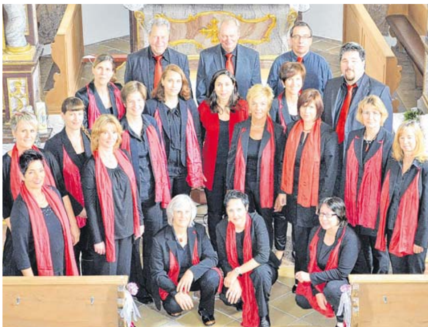
The Gospel Voices Schwabhausen kommen am nächsten Samstag ins AEZ.

Es wird eine Bunte Mischung aus dem Repertoire mit Gospels und Weihnachtsliedern gesungen, um die Kundinnen und Kunden des AEZ auf die Vorweihnachtszeit einzustimmen. Es wird sich also lohnen beim samstäglichem Einkauf etwas mehr Zeit einzuplanen, innezuhalten und den weihnachtlichen Melodien zu lauschen.