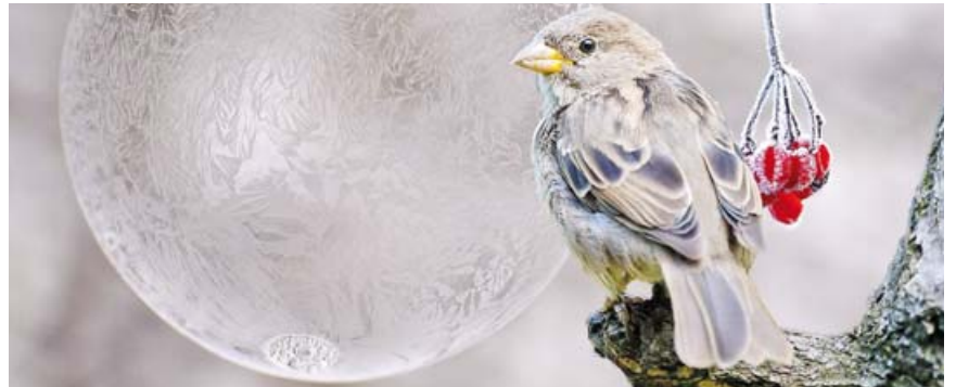
Mit dem richtigen Futter und einer Wasserstelle kommen unsere Wildvögel gut über den Winter.

■ LANDKREIS · Auch wenn wir bisher noch keinen Dauerfrost hatten, wird er wohl kommen – früher oder später. Wenn dann alles unter einer Schnee- und Eiskecke erstarrt, wird es für unsere Wildvögel immer schwieriger, Nahrung und Zugang zum Wasser zu finden. Darum hier ein paar Regeln des Deutschen Tierschutzbundes: Kein Brot oder Speisereste verfüttern, die schon allein wegen der Gewürze, Konservierungsstoffe und Geschmacksverstärker für Vögel nicht geeignet sind. Kein Futter auslegen, das Feuchtigkeit enthält und im Winter gefrieren kann. Obst im Winter nur in kleinen Mengen frisch auslegen. Bei der Herstellung eines Fut-