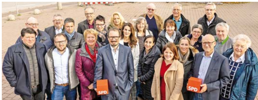
Das fast vollständige Team der SPD-Liste.