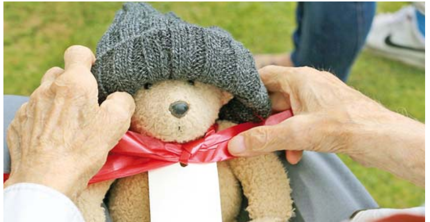
Große Freude kann man einsamen Senioren mit kleinen Geschenken machen.

Spendenaktion sorgt bei Senioren für schöne Weihnachten