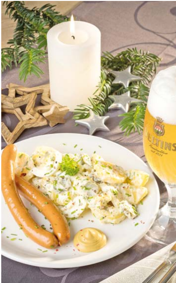
Zu Würstl mit Kartoffelsalat passt ein leichtes und spritziges Pils.

■ LANDKREIS · Früher gab es ab Martini (11. November) bis zum ersten Weihnachtsfeiertag am 25. Dezember eine weitere Fastenzeit. Mit einem eher kargen Mahl am Heiligen Abend sollte der Armut von Maria und Josef gedacht werden und wie sie in einem einfachen Stall die Geburt Jesu Christi erlebten. Damit doch alle satt wurden, gab es Kartoffeln in allen möglichen Variationen.