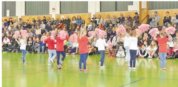
Auch die kleinen Cheerleader begleiteten Hänsel und Gretel durch die Show.

Besuchen Sie uns unter www.kurier-dachau.de