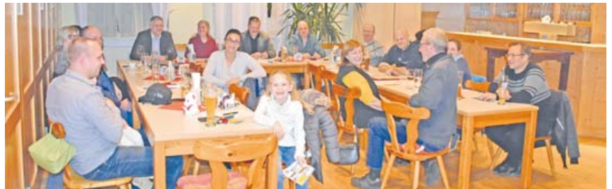
Jahreshauptversammlung des Erdweger Gewerbevereins im kleinen Saal im Bürgerhaus Kleinberghofen.

Hauptversammlung als gemeinsamer Jahresabschluss