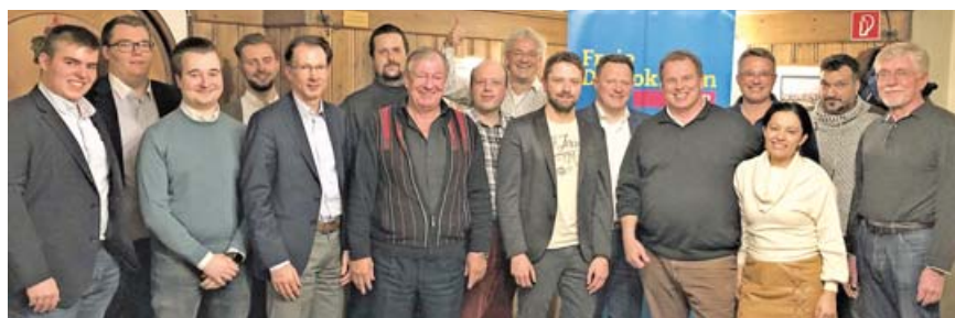
FDP-Aufstellungsversammlung am 28. November im Dachauer Zieglerbräu.

»Ein motiviertes und schlagkräftiges Team«