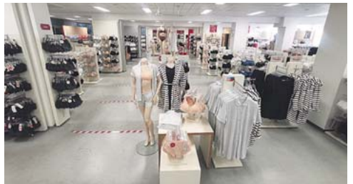
Zweimal im Jahr steigt im FOC in der Marsstraße 40 ein großer Sonderverkauf von Triumph und Sloggi.

Mitglied im Bundesverband Deutscher Anzeigenblätter e.V. Regelmäßige Auflagenkontrolle der Anzeigenblätter durch BDZV/BVDA