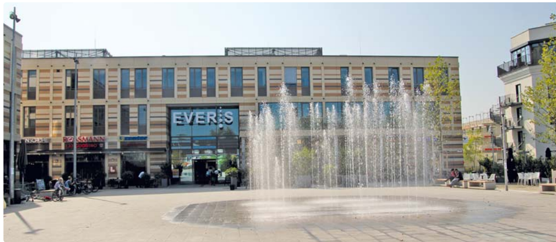
Das Nahversorgungszentrum EVER.S liegt direkt im Herzen von Allach-Untermenzing, am Oertelplatz. Das Center verfügt auch über eine Tiefgarage mit über 300 Stellplätzen.

Das EVER.S bietet ein konzentriertes Angebot für das Stadtviertel