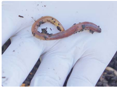
Den Regenwurm haben die Kinder unter einer Becherlupe genau betrachtet.