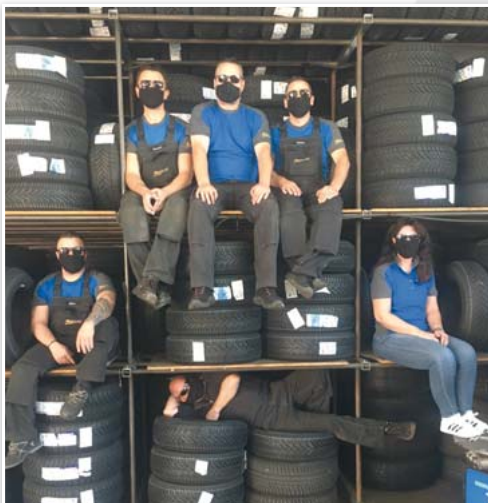
Das Team vom Reifenservice Leupold

Ihre Dienstleister & Fachhandel in der Eversbuschstraße