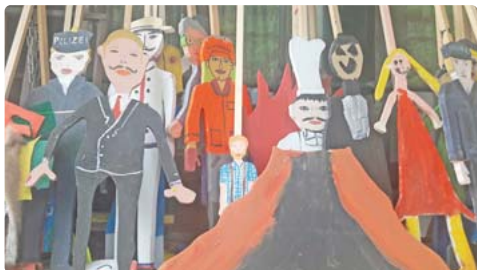
Das Internationale Figurentheaterfestival kommt im Oktober in die Pasinger Fabrik.

schauber teilnehmen können, sondern auch selber aktiv werden können, Puppen- und Kulissen bauen, Stücke entwickeln und Bühnenluft schnuppern können. Außerdem können alle, die die Spielstadt Mini-München verpasst haben in der Ausstellung „Mini-München 2020 – Im Westen was Neues“ einen nachträglichen Blick in den Alltag der erstmals dezentralen Spielstadt im Corona-Jahr werfen und das Spielstadtleben im Münchner Westen nacherleben. Info: www.pasinger-fabrik.de . red