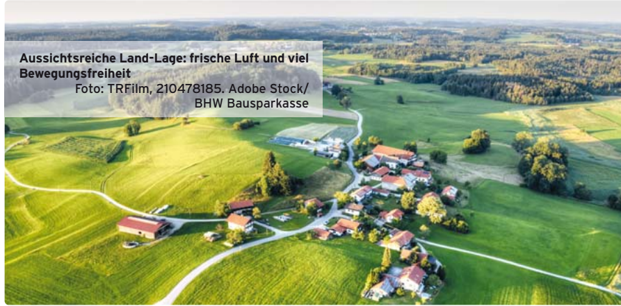
Aussichtsreiche Land-Lage: frische Luft und viel Bewegungsfreiheit