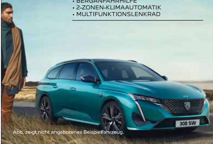
Abb. zeigt nicht angebotenes Beispielfahrzeug.