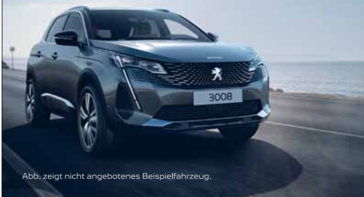
Abb. zeigt nicht angebotenes Beispielfahrzeug.