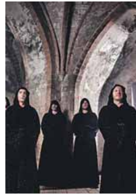
EVENTS

Gänsehaut-Momente sind garantiert beim imposanten Auftritt der Sänger.