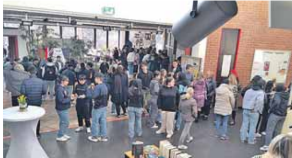
Die gefüllte Aula der Wirtschaftsschule beweist: die Veranstaltung war ein voller Erfolg.

vor Ort die Möglichkeit alle Eindrücke bei Kaffee und Kuchen auf sich wirken zu lassen und letztendlich sein Kind im Sekretariat anmelden.