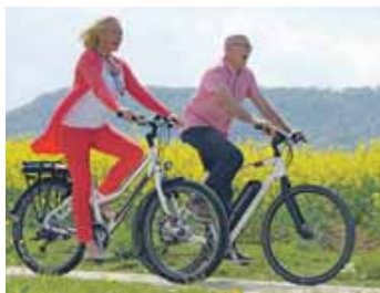
„DAS GEL IST DER HAMMER!“ (Robert S.)

Cannabis ist eine der ältesten traditionellen Pflanzen. Schon seit tausenden von Jahren werden ihre