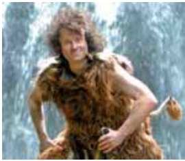
Der kleine Troll Wurlitz F: red

Grün im Buchenwald« wird gemeinsam gesungen, getanzt und sich gefreut: Endlich ist es wieder so weit, der laue Wind trägt die ersten Frühlingsgrüße hinab ins Tal. Endlich gibt es wieder Ameisenaufbruch mit Blattsalat. Endlich geht's wieder barfuß durch den Baz. Neben den frühlingsfrischen Trollliedern erzählt »Wurliz« lustige Geschichten und verrät den Kindern trollige Geheimnisse, warum zum Beispiel die Trollblume Trollblume heißt. Der Eintritt kostet sechs Euro pro Person. Einlass ist ab 14.30 Uhr. Vor und nach der Vorstellung gibt es im Eltern-Kind-Cafe eine thematische Bastelaktion. Karten können bei der Stadtjugendpflege im Vis-a-Vis von Mittwoch bis Samstag zwischen 15.00 und 20.00 Uhr unter der Telefonnummer 0.81.61/54-4.53.53 reserviert werden.