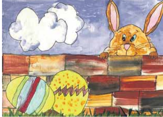
Dieser freche Osterhase war bei den ersten Einsendungen dabei.

FREISING (nsc) · ... und wir freuen uns über jedes Bild von Euch. Alle Kinder bis einschließlich 14 Jahre sind herzlich eingeladen, an unserem Ostermalwettbewerb teilzunehmen. Auch ganze Kindergartengruppen, Kinderkrippen oder Schulklassen können mitmachen.