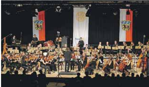
Freisinger Musikschule und Rotarier unterstützen MS Selbsthilfegruppe und Senioren.

Das erste Konzert fand im Schafhof statt und auf dem Programm standen u.a. Beethoven, Dvorak und Bizet. Das