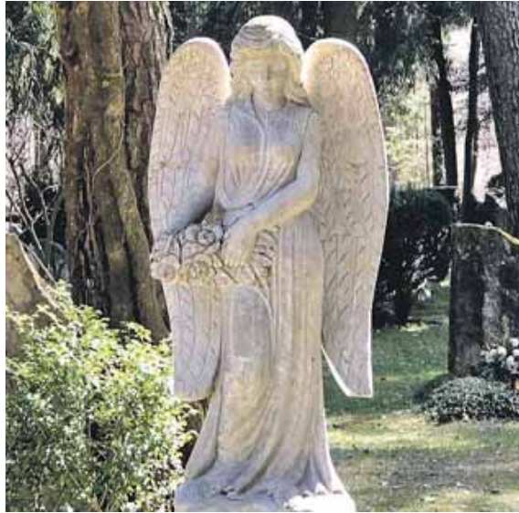
Immer mehr Menschen wünschen sich eine Bestattung weg vom klassischen Grab.

Während im Jahr 2004 noch 39 Prozent der Bundesbürger für die eigene Bestattung ein klassisches Sarggrab auf dem Friedhof wünschten, ist der Anteil nach einer aktuellen Studie mittlerweile auf 12 Prozent gesunken. Großen Zuspruch erfahren hingegen die Beisetzung der Urne in einem Bestattungswald mit 25 Prozent und pflegefreie Grabangebote auf Friedhöfen (18 Prozent). Hierunter zählen unter anderem Urnenwände, Gemeinschafts-, Rasen- und Baumgräber, in der Regel für Urnen. Ein klassisches Urnengrab auf einem Friedhof bevorzugen 14 Prozent der Be-