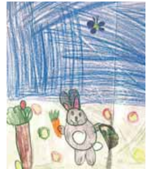
Hier strahlen Osterhase und Sonne um die Wette. Foto: Luisa R., 8 Jahre

A4. Vergesst nicht, auf der Rückseite Euren Namen mit Alter und Adresse zu schreiben. Und dann in einen Briefumschlag, mit dem Kennwort »Osterhase« adressieren an Wochenblatt Erding, Landshuter Str. 47a, 85435 Erding und ab zur Post. Oder bringt es gerne persönlich vorbei. Wir wünschen Euch viel Spaß und viel Glück!