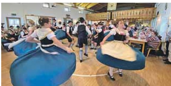
Die Jugend des Trachtenvereins Bairer Winkler führte voller Elan und gekonnt einige Tänze beim Krieger- und Soldatenstreffen des Landkreises Ebersberg auf.

der Kreisvorsitzende Bradler noch auf die 150-Jahr-Feier des Soldaten- und Kriegervereins Glonn am 28. Juli und des Veteranen- und Reservistenvereins Forstinning am 4. August hin. Mit dem gemeinsamen Singen der Bayern- und der Deutschlandhymne ging ein geselliger und perfekt ausgerichtetes Nachmittag beim Kreiskameradschaftstreffen in Antholing für alle Beteiligten zur vollen Zufriedenheit zu Ende.